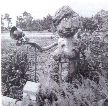
10. att. Sieviete. 2005. gads.

Izpētot iepriekš publicētos materiālus, var secināt, ka unikālie tēli savu dzīvi mājas apkārtnē vada līdzīgi cilvēka dzīvei raksturīgajam mainīgam ritumam. Vairāk nekā desmit gadu laikā, ienākot arvien jauniem darinājumiem, iepriekšējie iemītnieki mainījuši savu atrašanās vietu un izskatu. Piemēram, sieviete, kas 2005. gadā savas kuplās krūtīs cēli demonstrēja pie ieejas saimniecībā, tagad nogurumā atspiedusies pret sētas vārtiem pagalma aizmugurē (10.,11. att.).