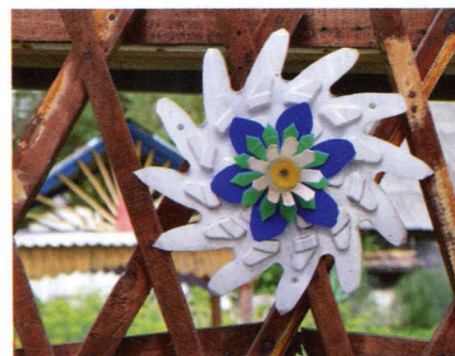
8. att. Zieds.