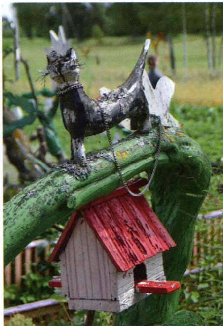
5. att. Kaķis, baložu pāris un putnu būris.