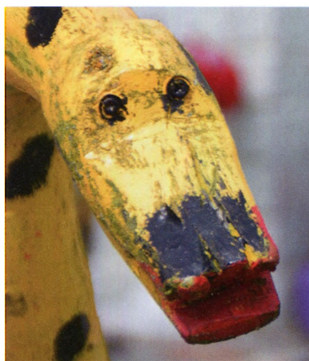
14. att. Čūskas acis.

Var ievērot, ka autors īpašu vērību velta tēlu sejas vaibstiem un acīm, cenšoties piešķirt tiem dzīvīgumu un emocijas. Dažiem tēliem acis veidotas no metāla skrūvēm (14. att), kas