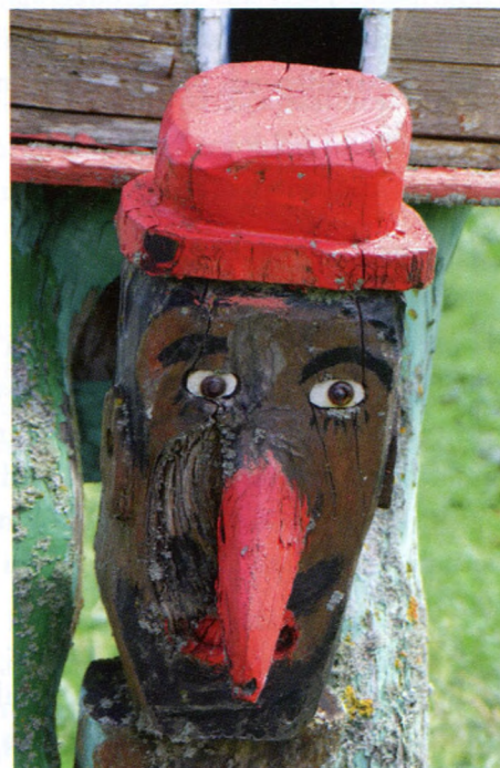
7. att. Pinokio līdzinieks.