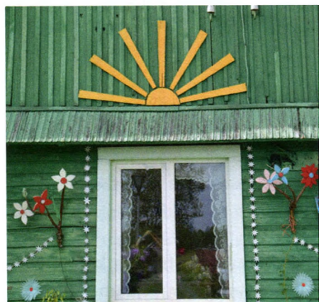
16. att. Dzīvojamās mājas fasāde.