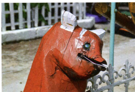
15. att. Lapsa.