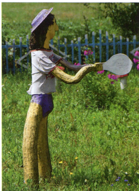
13. att. Tenisists. 2016. gads.

Dažiem pārmaiņas krietni ievērojamākas: brazīliešu futbola karalis Pele pievērsies mierīgākam un vecumam atbilstošākam sporta veidam – tenisam (12., 13. att.). Vai varbūt tagad tas ir Ernests Gulbis?