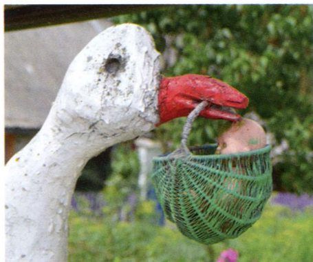
4. att. Zoss un zīdains.