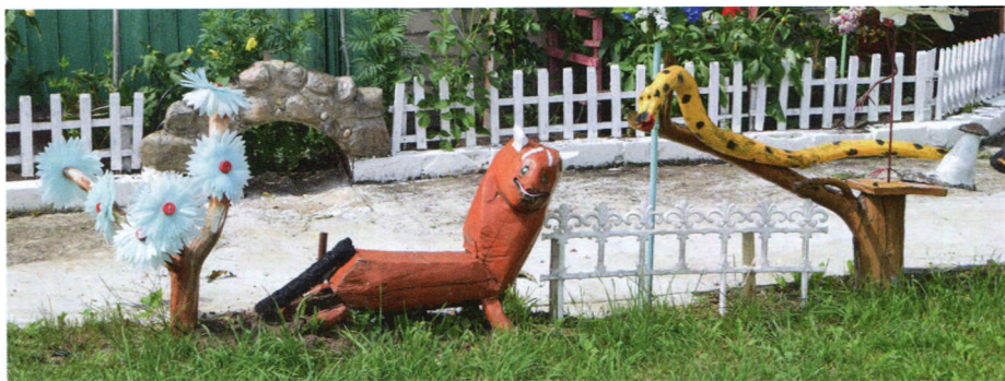
9. att. Čūska un lapsa.

tēliem, čūskas atrodas izdevīgākā situācijā, piemēram, ar ieinteresētu skatienu no augšas vēro lapsu (9. att.).