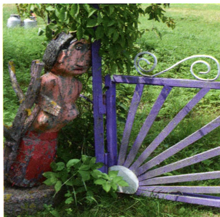
11. att. Sieviete. 2016. gads.