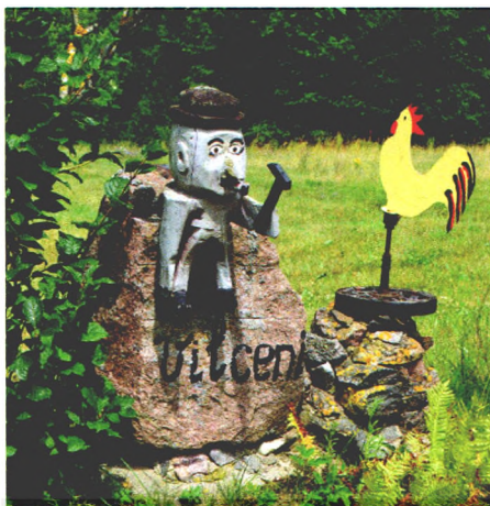
2. att. Mājas zīme “Vilceni”.

Vajag ar kaut ko nodarboties. Piemēram, ziemā snieg sniegs un tas ievazājas mājā. Lai sniegu nenestu iekšā, vajag uztaisīt nojumi. Uztaisīju nojumi. Tā – pamazām! Ej uz mežu malku zāgēt, ieraugi kaut ko piemērotu – uztaisi. (NMV–4433, Jānis Kukjāns)