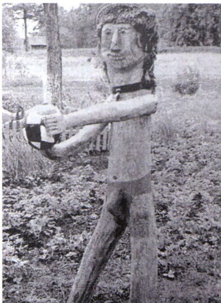
12. att. Futbolists Pele. 2005. gads.