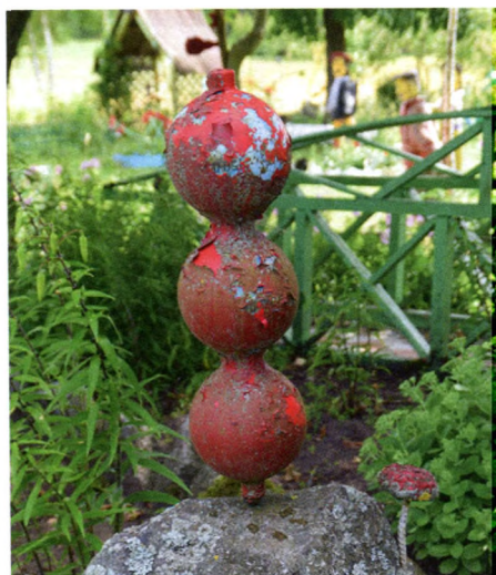
17. att. Krāsojuma slāņi.

acu skatienam piešķir noteiktību un mērķtiecīgu virzību. Savukārt citiem tēliem acu vietā liktas stikla lodītes, kas lauž gaismu un dažādās stundās un laika apstākļos piešķir skatienam atšķirīgu savdabīgu noskaņu (15. att.).