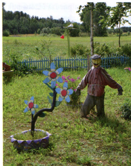
6. att. Dārznieks un puķe.