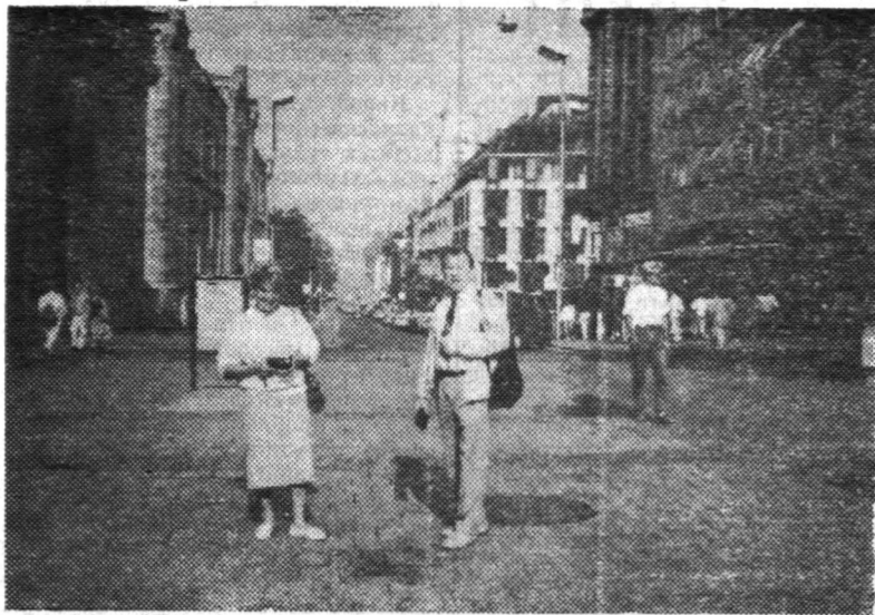
* Oslo ielā.