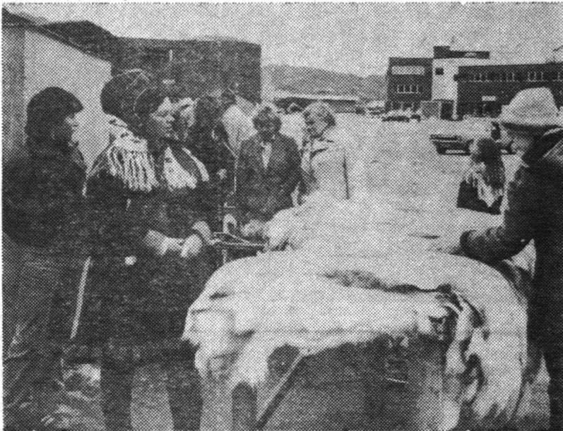
* Tirdzniecība ar zverādām.