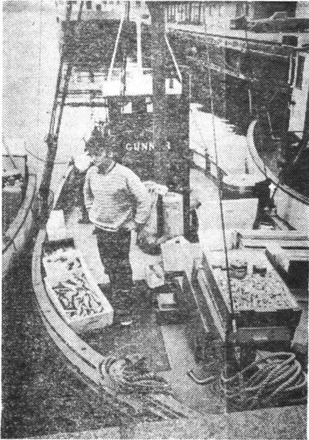
* Svalgu zivju loms.