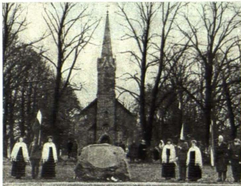
● Piņķu baznīca 1991. gada 5. janvārī. Priekšplānā — Piņķu piemiņas akmens.

● Dievkalpojumu Piņķu baznīcā notur Latvijas Evaņģēliski luteriskās baznīcas arhibīskaps Kārlis Gailītis un prāvests Jānis Liepiņš.