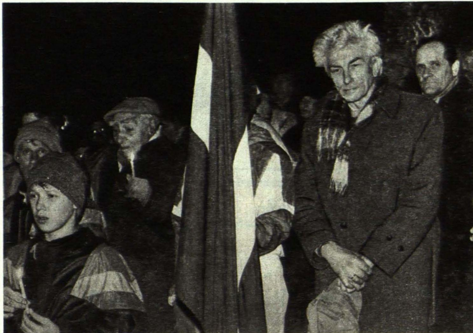
● Piemiņas brīdī Ložmetējkalnā.

Tās dega arī 1991. gada janvāra sākumā neilgi pirms vēl vienas asiņainas latviešu tautas traģēdijas. 5. janvārī tika atklātas