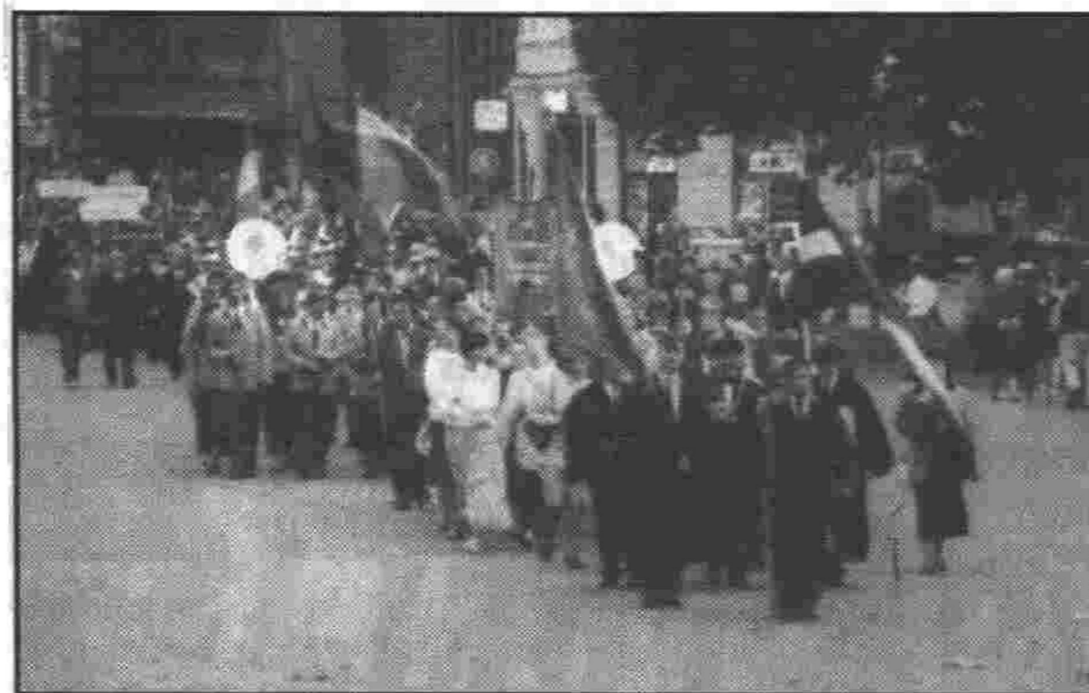
Kurp gāja, ko darīja pirmā kursa students pirmās septembra svētdienas vakarā? Atbilde uz šo jautājumu varētu būt viennozīmīga, piedalījās "Jaunā studenta svētkos 95"