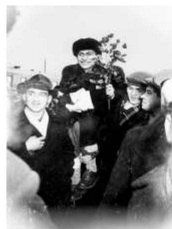
Mihails Tāls - pasaules čempiona sagaidīšana Rīgā 1960. gadā.