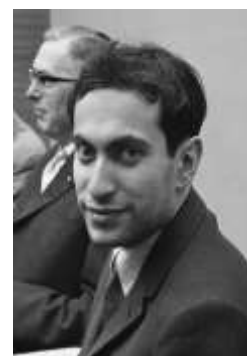
Mihails Tāls.

Beidzis Latvijas Valsts universitāti. 1960.-1970. gadā bija žurnāla "Šahs" galvenais redaktors.