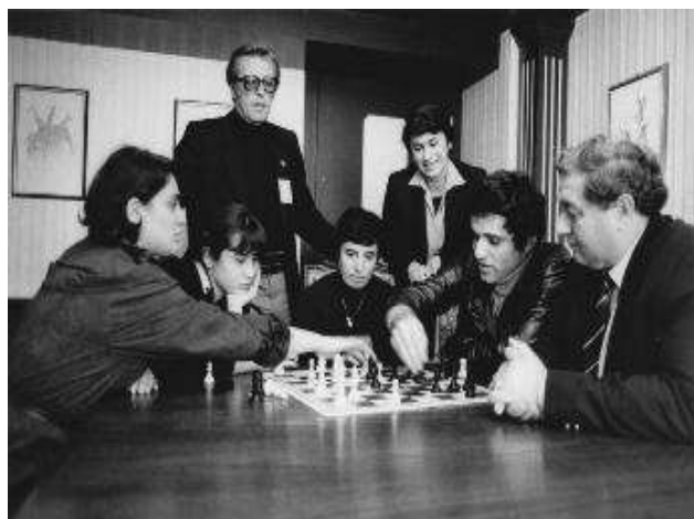
Korčnoja-Kasparova spēles analīze, 25. šaha olimpiādē, Lucernā (Šveice), 1982. gads. No kreisās pusēs Maija Čiburdanidze, Nana Joseliani, Aivars Gipslis, Nona Gaprindašvili, Nana Aleksandrija, Garijs Kasparovs, Eduards Gufelds.