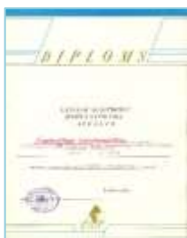
Diploms LU sieviešu komandai par iegūto 1. vietu Latvijas 1. Universiādē, 1991. gads

1992. gadā LU komanda iegūst 1. vietu vīriešu un sieviešu grupā Latvijas Universiādē. Laika posmā no 1993. līdz 1997. gadam LU komanda uzvar Latvijas Universiādē. 1996. gadā LU komanda pirmo reizi iegūst Latvijas čempionu titulu. 1998. gada LU komanda iegūst 3. vietu Eiropas kausa izcīņas priekšsacīkstēs, kā arī LU komandai otro reizi 1. vieta Latvijas komandu čempionātā.