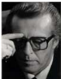
Aivars Gipslis.

Vēl viens spožs LVU pārstāvis šahā - Aivars Gipslis (1937-2000).