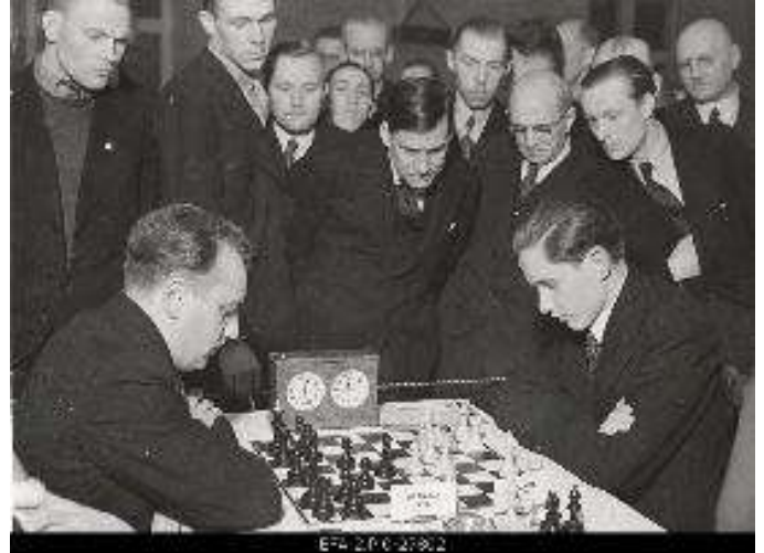
Vladimirs Petrovs (no kreisās puses) pret Igaunijas lielmeistaru Paulu Keresu, draudzības mačs starp Igauniju un Latviju 1938.gadā.

1926. gadā viņš ieguva pirmās vietas 1. Rīgas meistarsacīkstēs un Latvijas Šaha kluba meistarsacīkstēs un pārsvarā nodevās šaha spēlei.