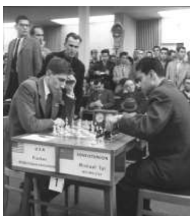
Mihails Tāls un Bobijs Fišers 1960. gada olimpiādē.