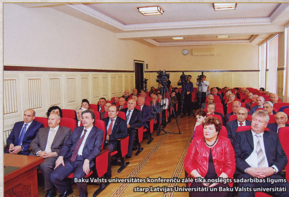
Baku Valsts universitātes konferenču zālē tika noslēgts sadarbības līgums starp Latvijas Universitāti un Baku Valsts universitāti

Divdesmitā gadsimta sākumā ar Azerbaidžānu bija saistīti daudzu izcilu latviešu kultūras un mākslas darbinieku dzīves gājumi. Azerbaidžānā ilgus gadus darbojās rakstnieks Ernests Birznieks – Upītis , rakstīja un gleznoja Jānis Jaunsudrabiņš , uz dzīvi bija apmetušies rakstnieki Pāvils Rozītis , Sudrabu Edžus , Jānis Vainovskis un Augusts Bērce , vairākus mēnešus ciemojās Andrejs Upītis , vietējā Latviešu biedrībā darbojās vēlākais izcilais diplomāts un ārlietu ministrs Antons Balodis , austrumu motīvus Baku ielās tvēra gleznotājs Jāzeps Grosvalds , bet turienes operā diriģēja Jāzeps Mediņš . Baku 1916. gadā ir dzi-