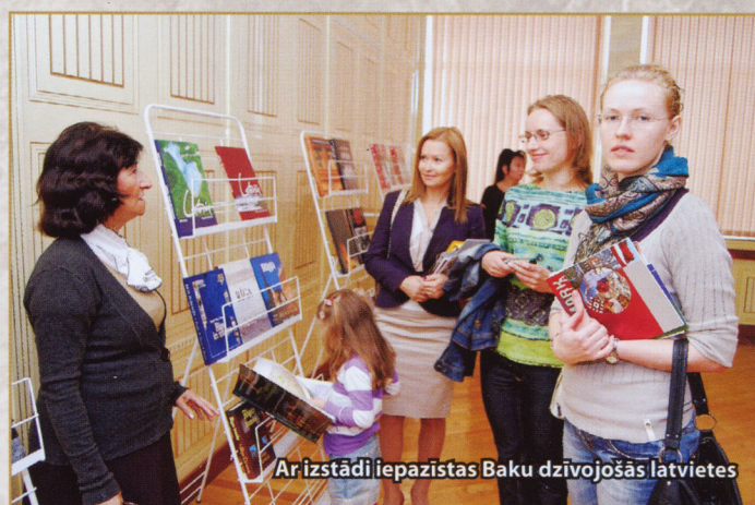
Ar izstādi iepazīstas Baku dzīvojošās latvietes