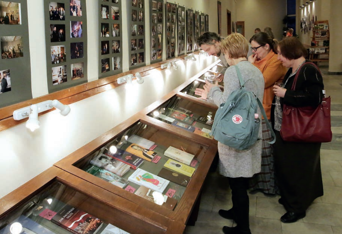
Izstādes "2017. gads Latvijas gramatniecība" atklāšana. 2018. gada 2. martis

laikā, ja viņa darbi glabājas Misiņa bibliotēkā."