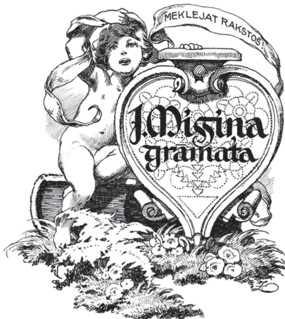
Jana Misiņa grāmatzīme. Mākslinieks: Rihards Zariņš

Latvijas Universitātes pasniedzējiem, darbiniekiem un studentiem mājas abonements ir bez maksas.