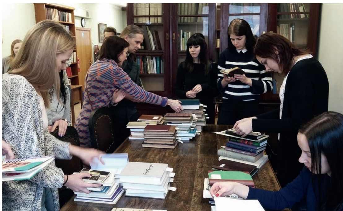
LU Humanitāro zinātņu fakultātes Latvistikas un baltistikas nodaļas studenti iepazīstas ar LU Akadēmiskās bibliotēkas Misiņa bibliotēkas krājumu. 2018. gada 21. marts