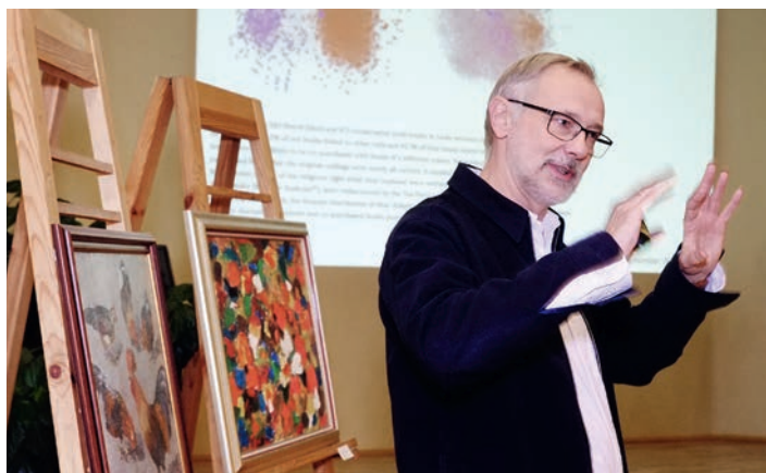
Misiņa kluba lasījuma uzstājas profesors Marcis Auziņš. 2017. gada 26. oktobris

> bibliotēka veido savu Digitālo bibliotēku un piedalās kopprojektā ar Latvijas Nacionālo bibliotēku par Latvijas Nacionālās digitālās bibliotēkas Letonica izveidi.