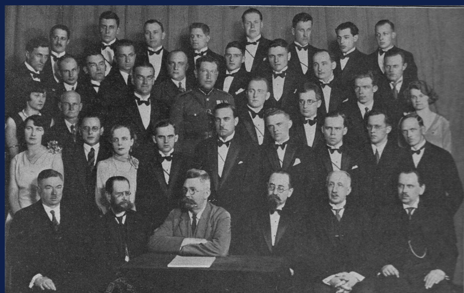
Tiesību zinātņu nodaļas mācībspēki ar absolventiem 1929. gadā.