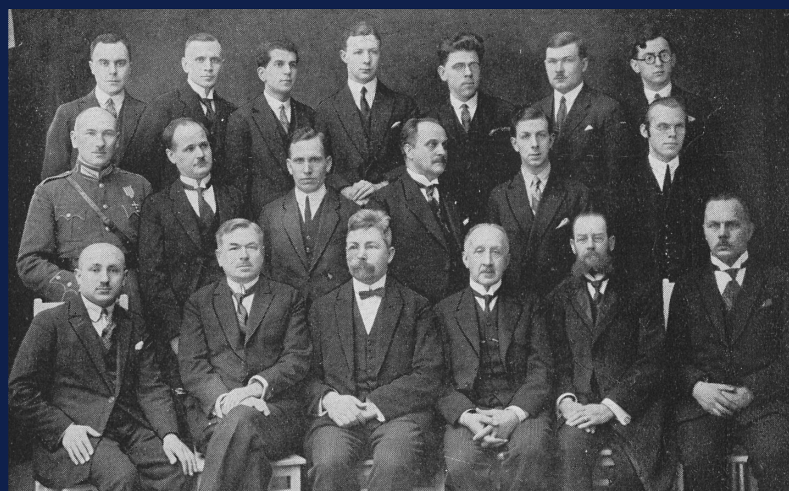
Tiesību zinātņu nodaļas mācībspēki ar absolventiem 1927. gadā.