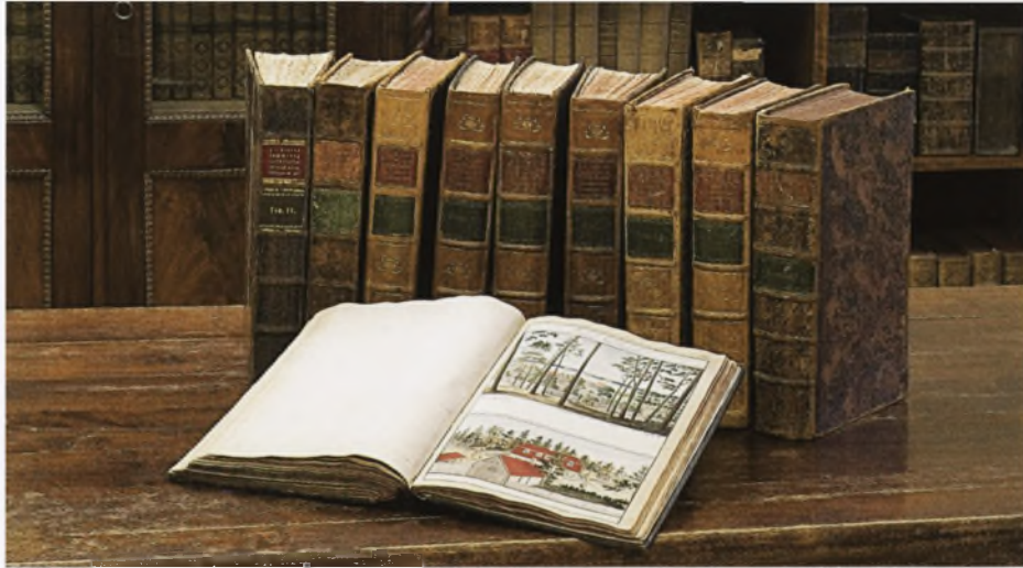
Johann Christops Brotze Monumente című gyűjteménye

a másolatok teljes mértékben egyezzenek az eredeti verziókkal. A gyűjtemény iránt rendkívül nagy érdeklődés mutatkozik. Abból a célból, hogy bárki szabadon hozzáférhessen, 2000-ben létrehozták a Monumente on-line adatbázisát ( http://www3.acadlib.lv/broce ).