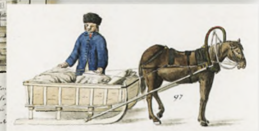
Lettek / Latvians