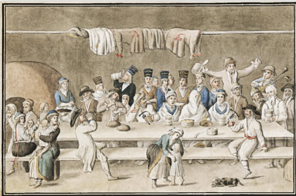
Paraszt lakodalom / The Peasant wedding