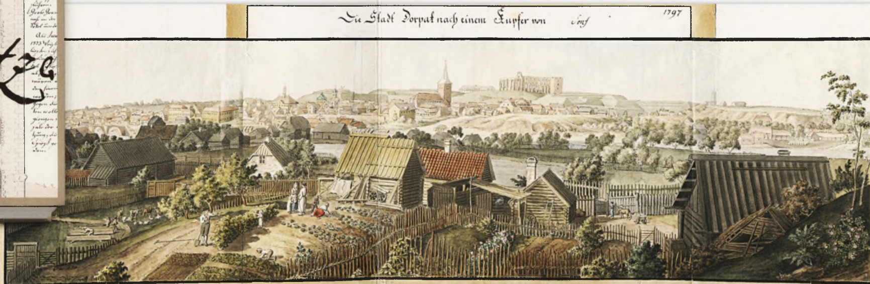
Tartu. 1797 / Tartu. 1797

és kutatók, restaurátorok és építészek éppúgy megtalálhatók, mint múzeumi dolgozók, levéltárok, archívumok és kiadók – mind Lettországból, mind pedig külföldről. A lista folyamatosan újabb és újabb nevekkel bővül, hasonlóan a fotókópiák számához.