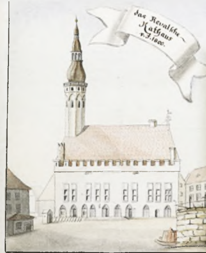
Tallinn. Városháza. 1800 Tallinn. Town Hall. 1800

In 2006 was published Brotze Estonica . The material on Estonia was prepared for publication by the team guided by Professor Raimo Pullat.