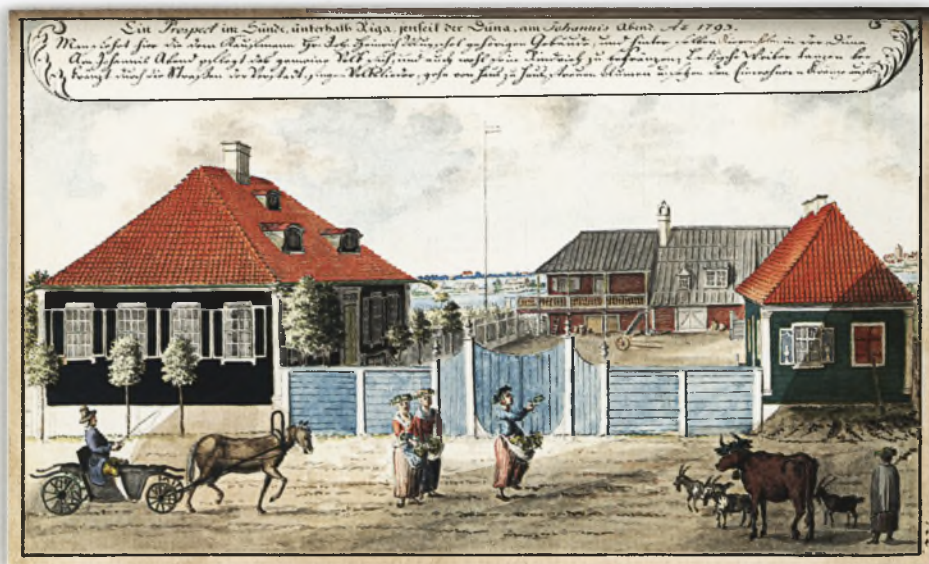
Riga. Midsummer night festival at Zunds. 1793