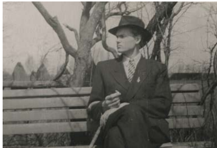
Ar vidusskolas beidzēja žetonu pie žaketes atloka 1956. gada jūnijā Kundziņsalā.