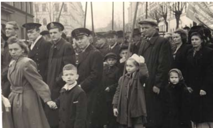
Demonstrācijā no Rīgas Kuģu būvētavas 1955.gada 1. maijā (2. rindā 1. no kreisās).