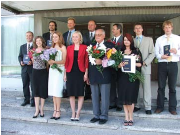
Siltuma, gāzes un ūdens inženiersistēmu maģistru izlaidumā 2005. gada jūlijā.