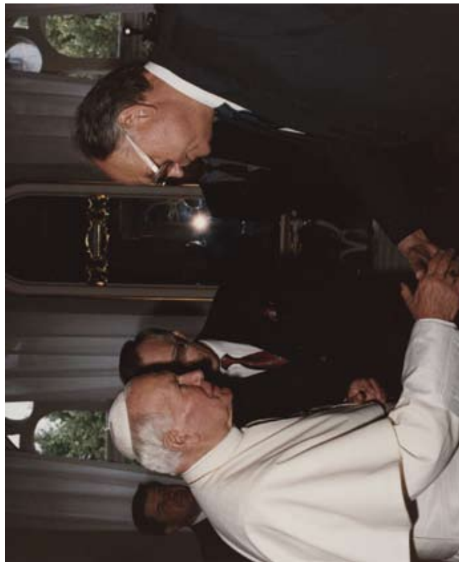
Romas pāvesta Jāņa Pāvila II vizīte Rīgā 1993. gada septembrī. Aiz viņa - A. Gorbunovs un V Birkavs.