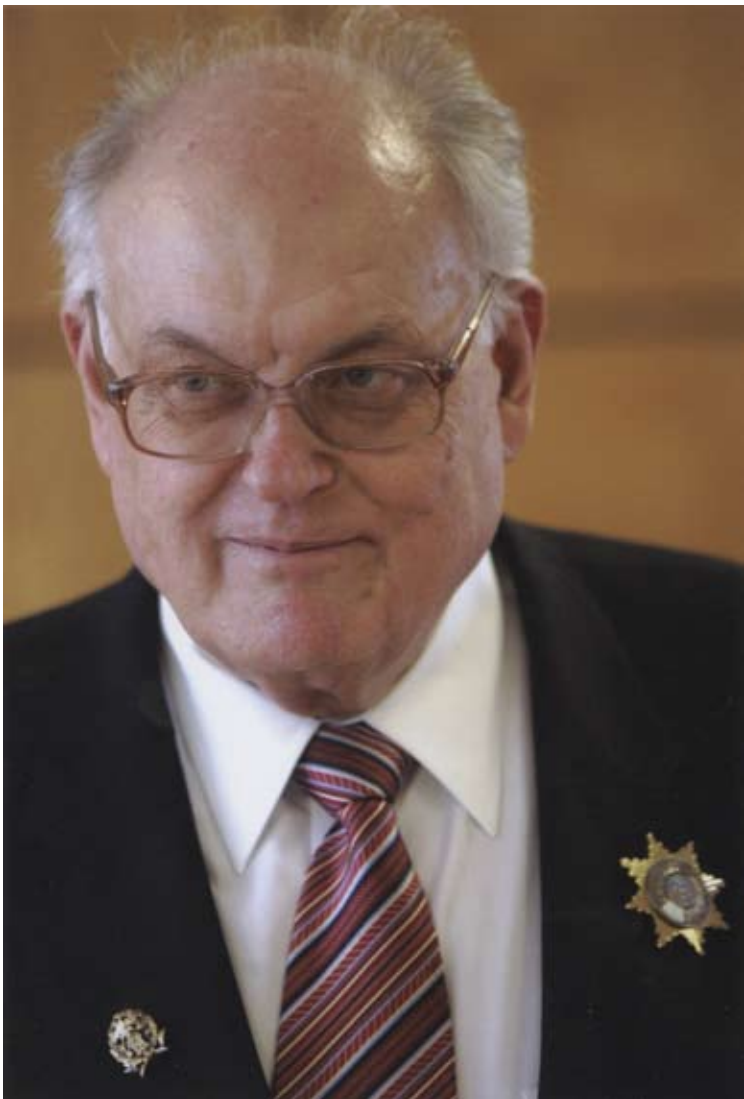
Ar senu RPI absolventa krūšu nozīmi un 70 gadu jubilejā saņemto apbalvojumu "Zinātnieka Zvaigzne".