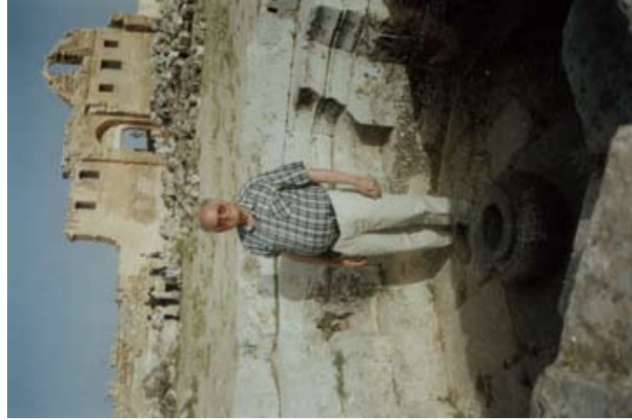
..... Harranā, Turcijas austrumos ...