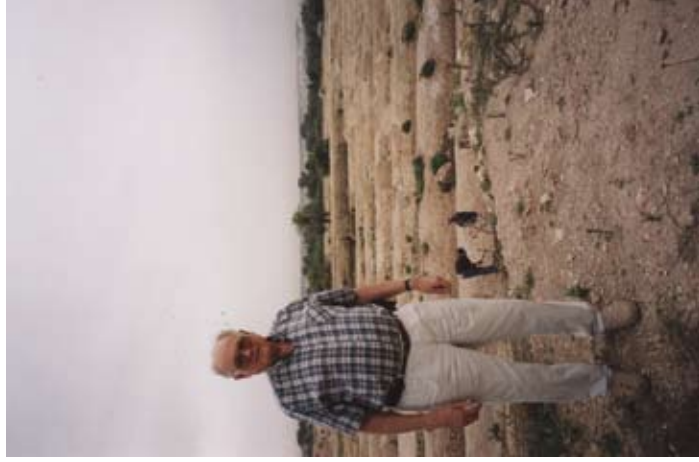
Kartāgas drupu izrakumos ...