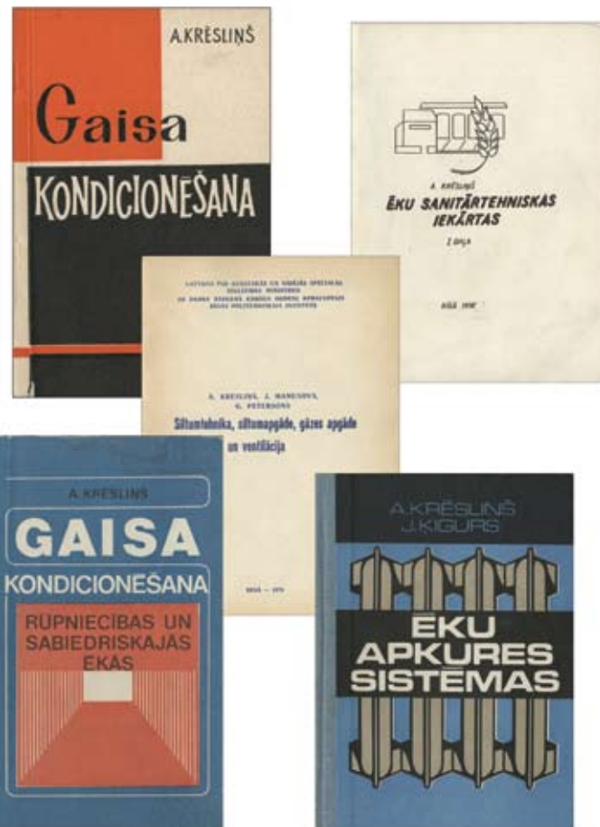
Manas no 1969. līdz 1986. gadam latviski sarakstītās monogrāfijas.