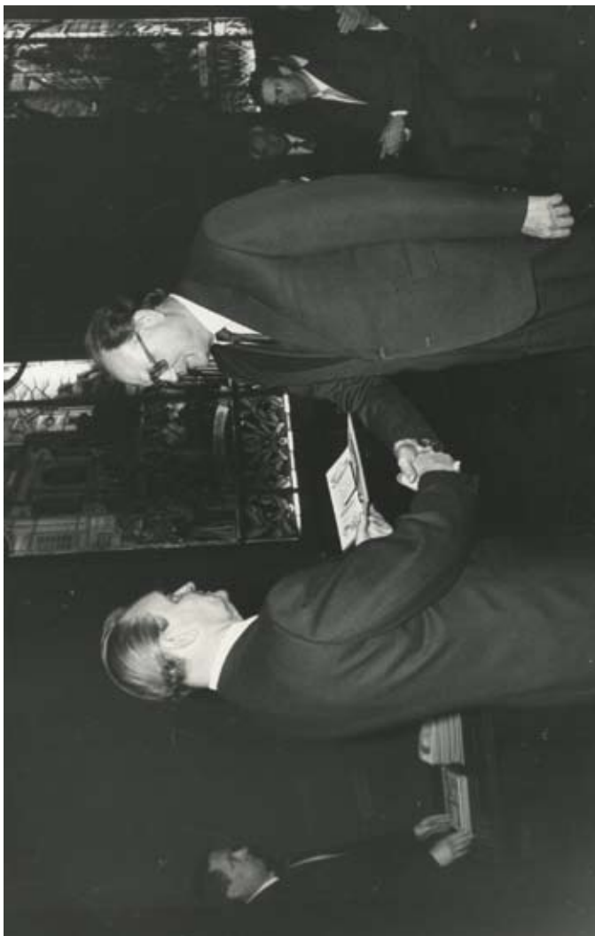
Augstākās Padomes Prezīdijā priekšsēdis J. Vāgris pasniedz medaļu un apliecību "LPSR Nopelniem bagātais zinātnes un tehnikas darbinieks" 1987. gada oktobrī.