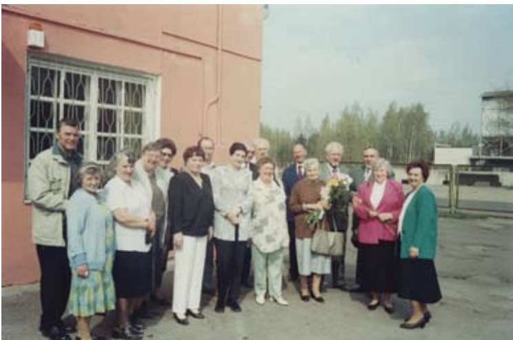
... un pēc 50 gadiem klases salidojumā Vecākos 2000. gada aprīlī.