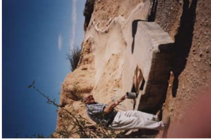
Apsekojot inženierisistēmu vēstures pieminekļus pie berberiem Tunisijā ...