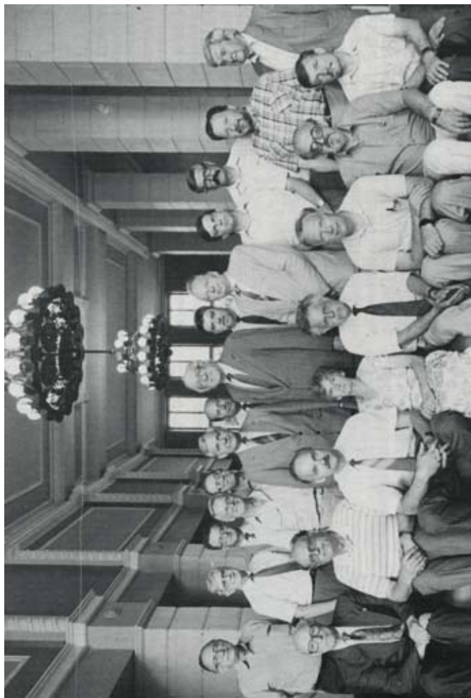
Ar Vispasaules Latviešu Zinātņu kongresa rīcības komitejas sēdes dalībniekiem (1. rindā 2. no kreisās) 1991. gada jūlijā.