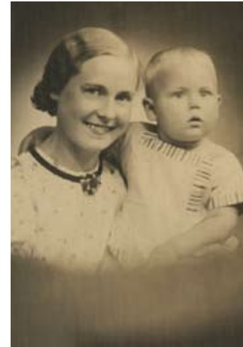
Ar māti 1939. gada jūnijā.