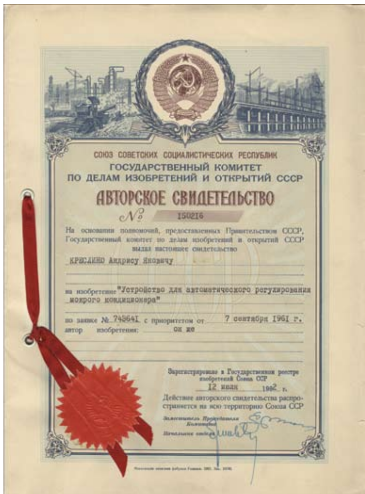
Pirmais izgudrojums, pieteikts 1961. gadā, atzīts par valstij svarīgu, un tādēļ publicēts tikai pēc 10 gadiem.