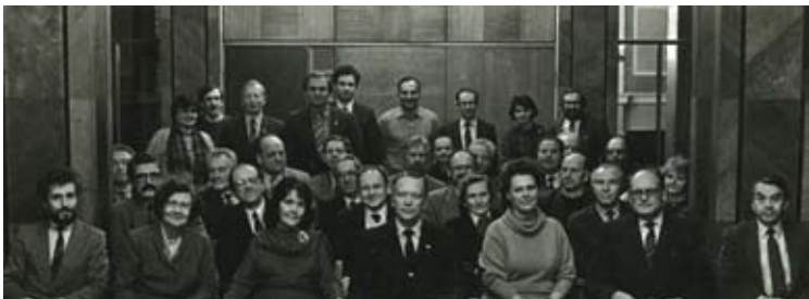
Latvijas Zinātnieku savienības (LZS) Padome 1989. gada novembrī (es - 1. rindā 2. no labās).