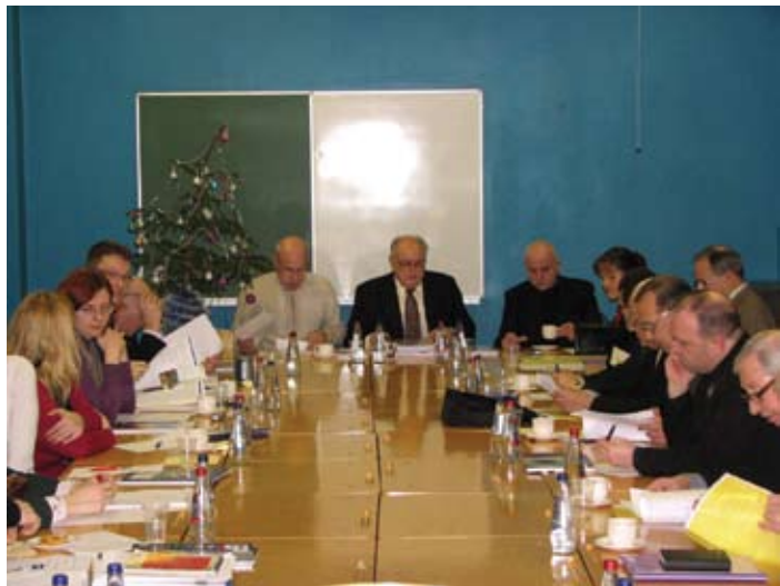
... Siltuma, gāzes un ūdens tehnoloģijas institūts kopsapulcē 2007. gada janvārī.