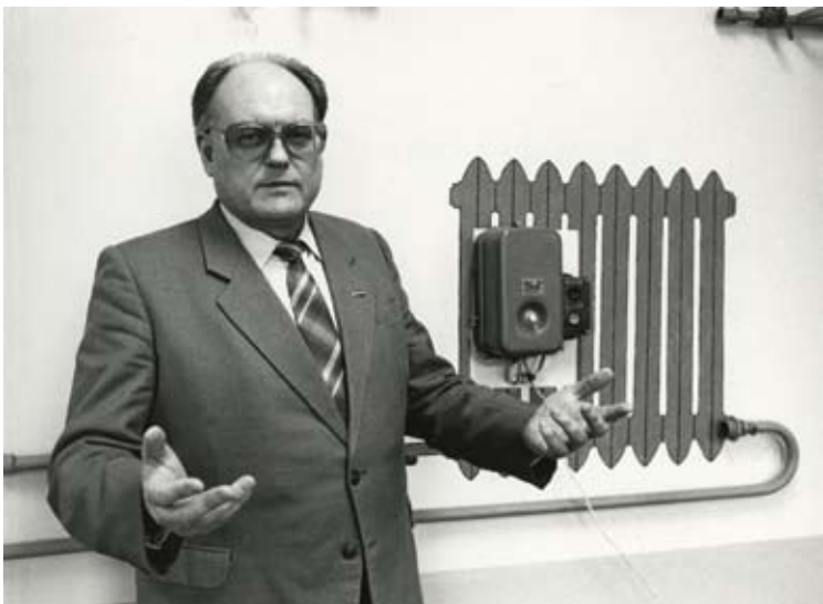
Balotējoties no LZS vēlēšanās uz LPSR Augstāko Padomi 1990. gada februārī.