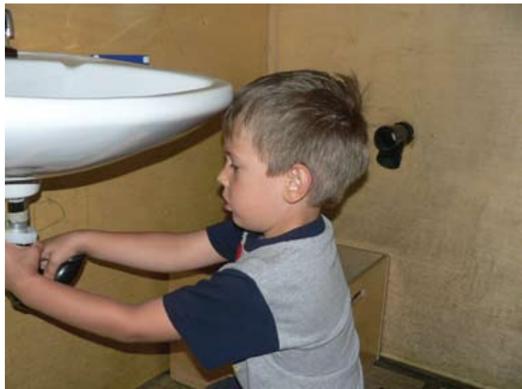
Varbūt kāds no mazbērniem arī interesēsies par ēku inženiersistēmām?