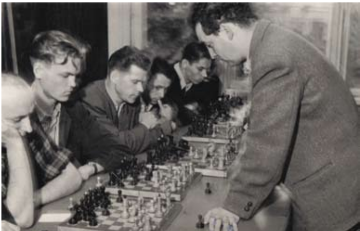
Simultānspēlē (2. no kreisās) ar lielmeistaru M. Taimanovu Rīgas Kuģu būvētavas klubā 1954. gadā.