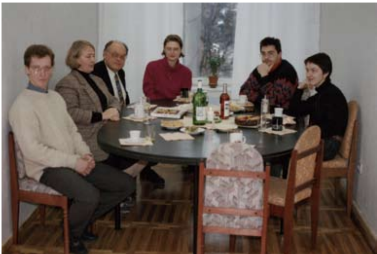
Ar Eiropas Komisijas Enerģētikas centra darbiniekiem (3.no kreisās) 1993. gadā.