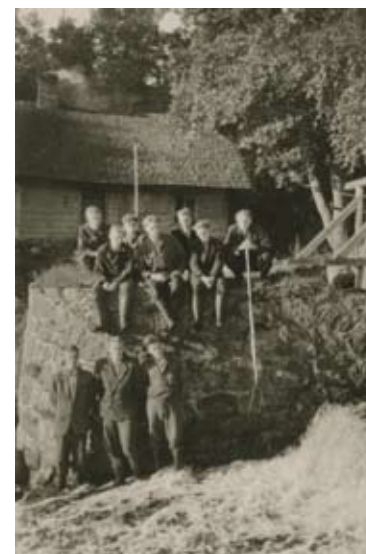
Ražas novākšanas talkā (augšā vidū) Mehānikas fakultātes studenti 1956. gadā septembrī.