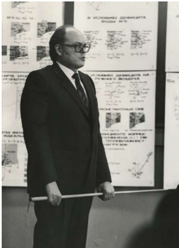
Aizstāvēt zinātņu doktora disertāciju Maskavā 1983. gadā.