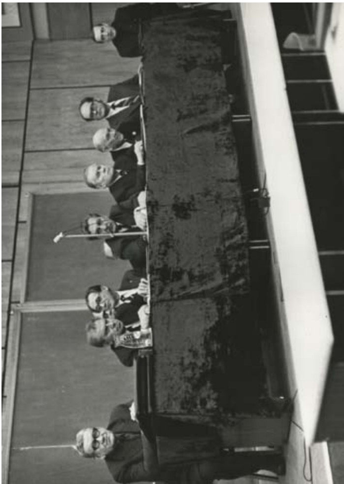
Katedru vadītāju semināra prezidijā (2. no labās) Maskavā 1980. gadā.