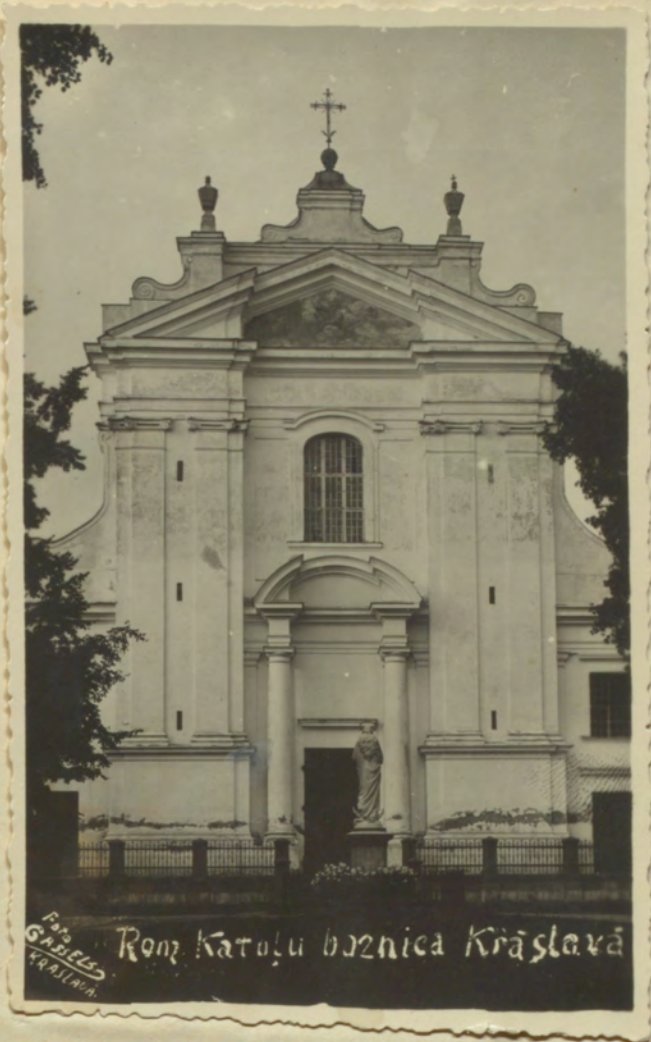
Rom. katolíu božnica Kráslavá