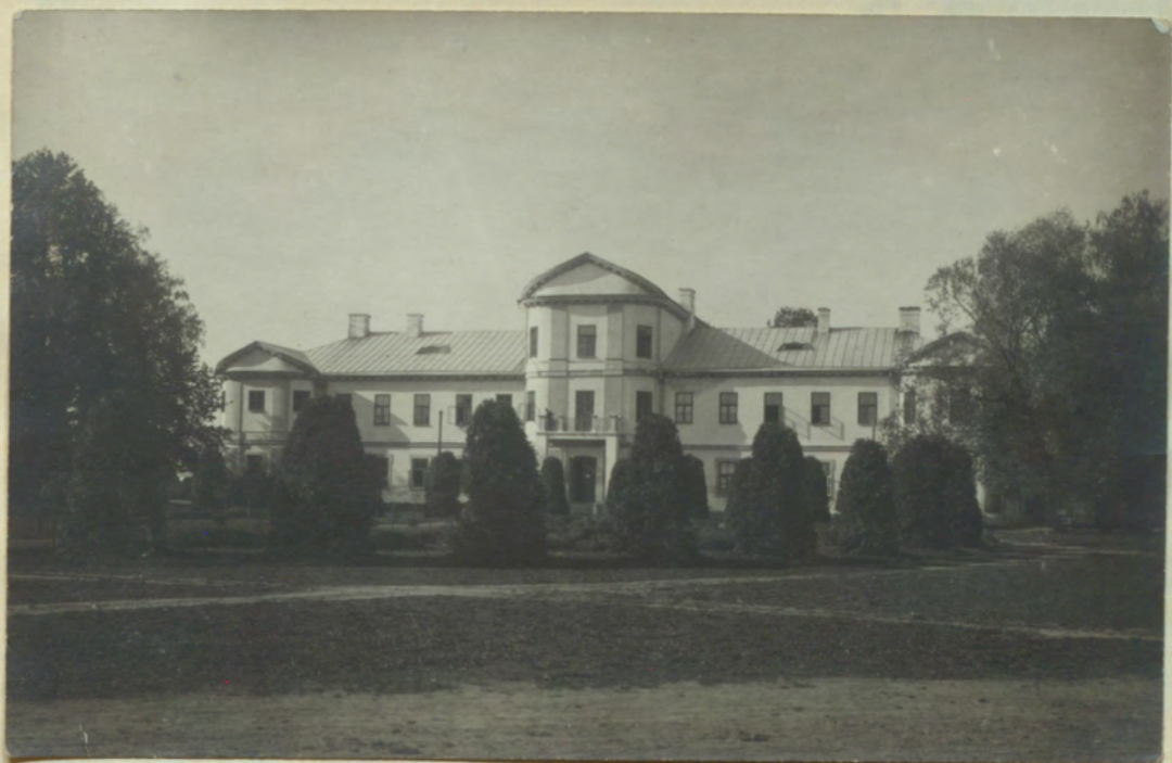
Плытеровскій замокъ ("Палацъ"), здрѣ теперь помѣщается гвударств. школа.