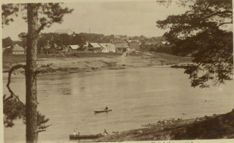
Daugava pie Krāslavas. J. Novoselovs, Krāsl. koop. izd.