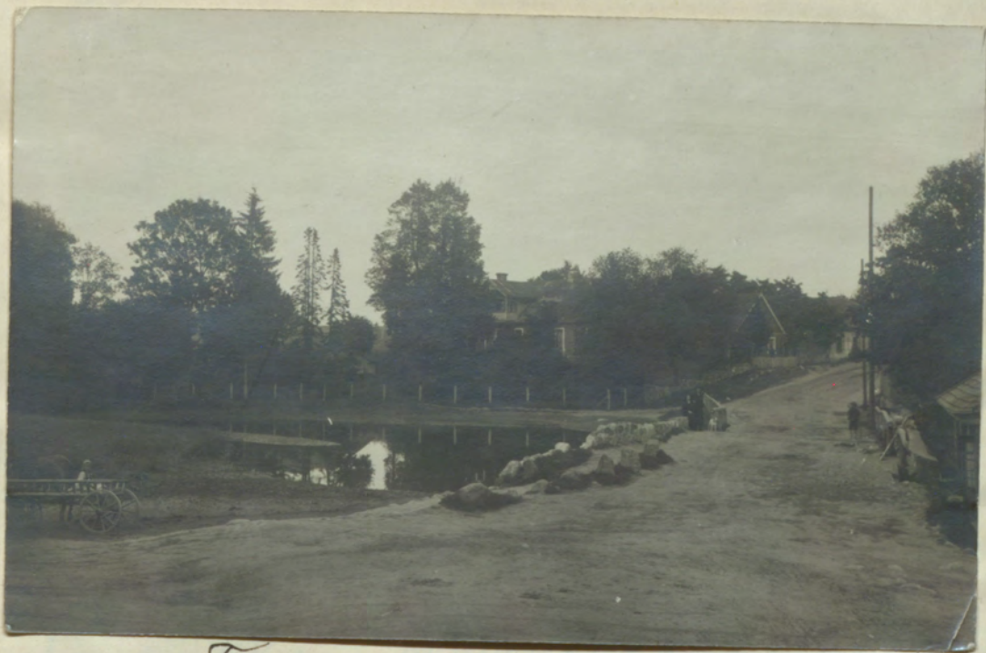
Трудъ въ Краенскъ.