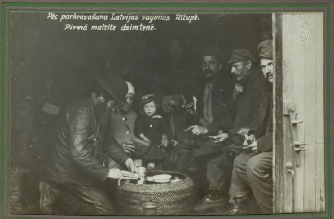
Pēc parkrāvāšana Latvijas vagonos Rītupē. Pirmā maltīte dzimtenē.