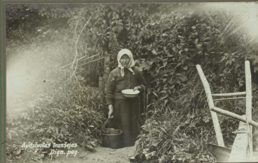
Apdzīvotas tranšejas Dign. pag.