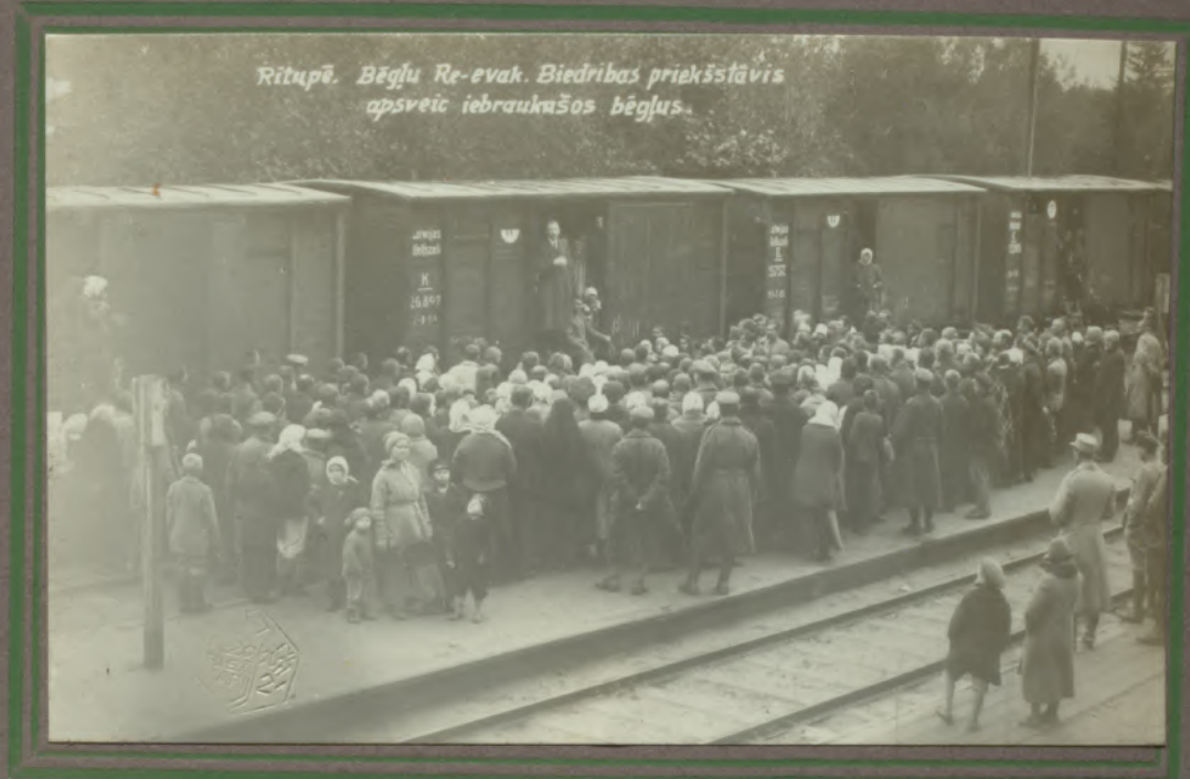
Rītupē. Bēgļu Re-evak. Biedrības priekšstāvis apsveic iebraukušos bēgļus.