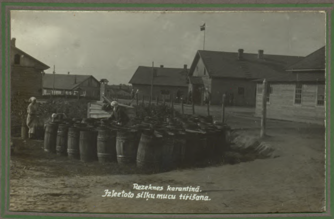
Rezeknes karantīnā. Izleototo silķu mucu tīrīšana.