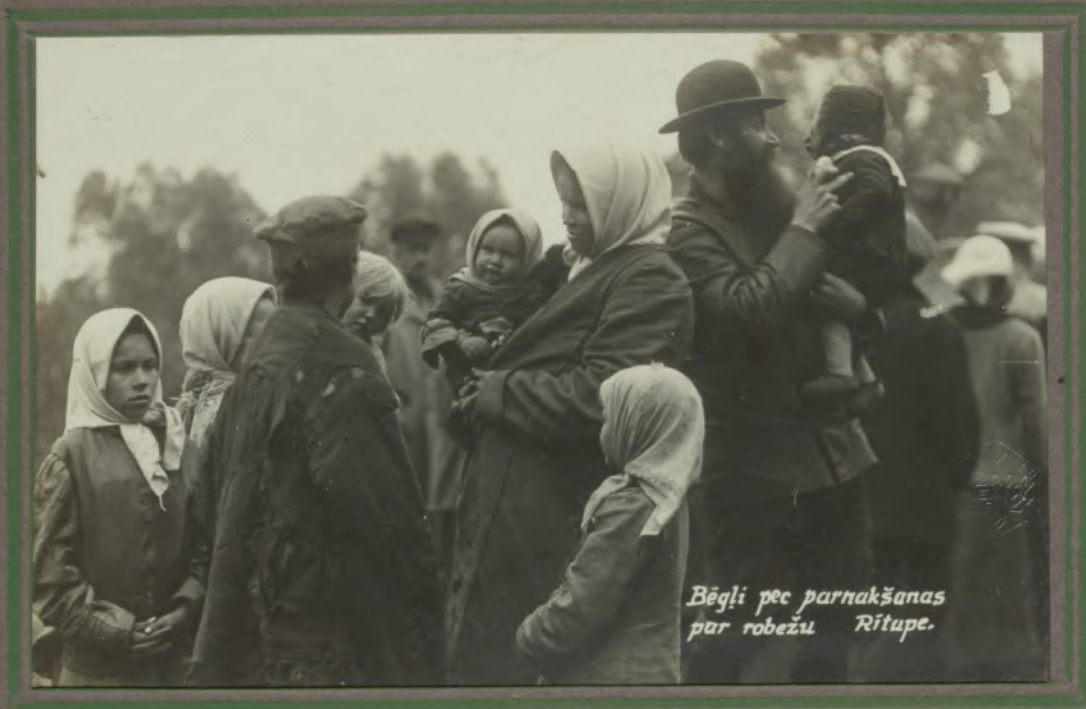
Bēgļi pēc parnakšanas par robežu Rītupē.