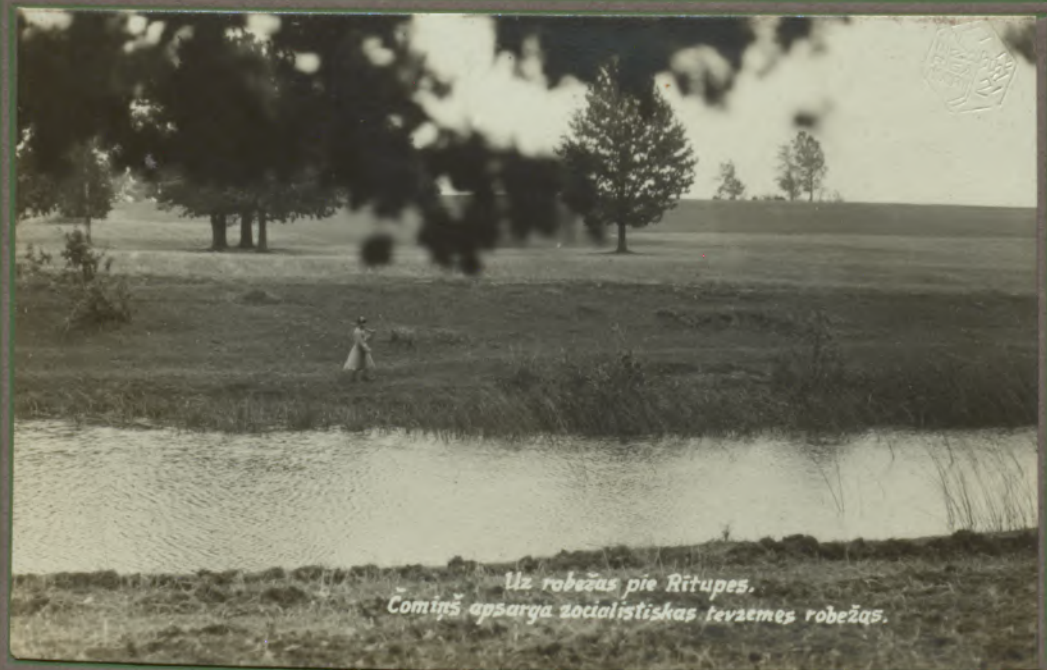
Uz robežas pie Rītupes. Comiņš apsarga socialistiskās tēvzemes robežas.