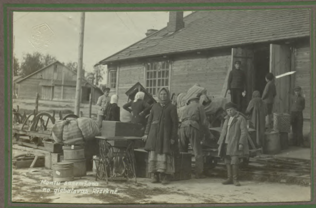
Mantu saņemšana no glabātavas Rzeknē