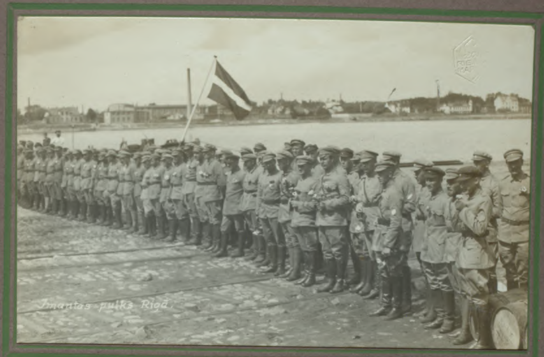
Imantas pulks Rīgā.