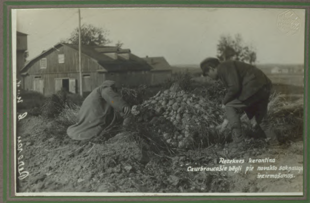
Rzeknes karantīna Caurbraucošie bēgļi pie novakto saknauģu izziemošanas.