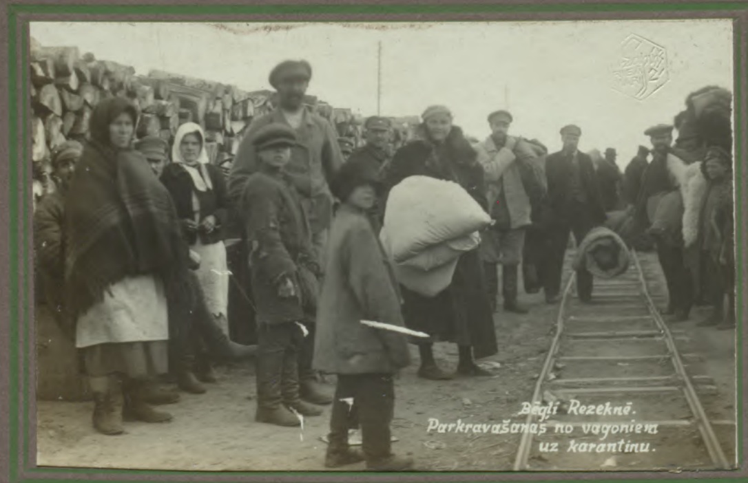
Bēgļi Rzeknē. Parkravašanās no vagoniera uz karantīnu.