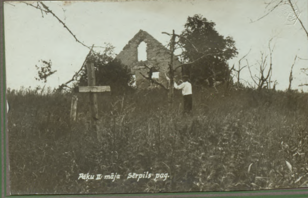
Pēķu II māja Sērpils pag.