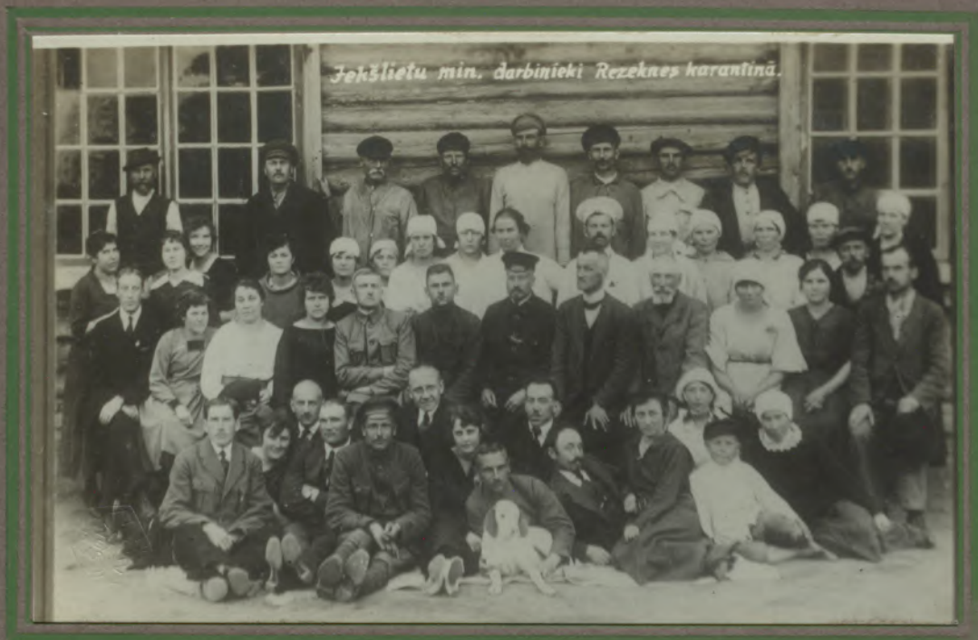
Jekšlietu min. darbinieki Rēzeknes karantinā.