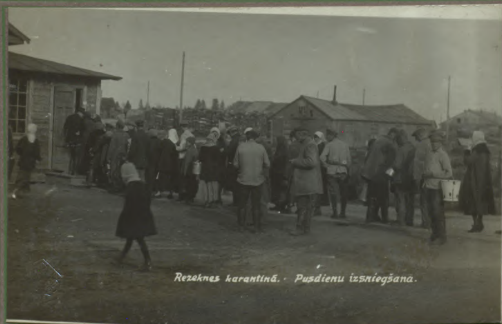
Rezeknes karantīnā. Pusdienu izsniegšana.