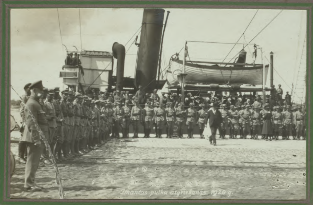
Imantas pulka atgriešanās 1920 g.