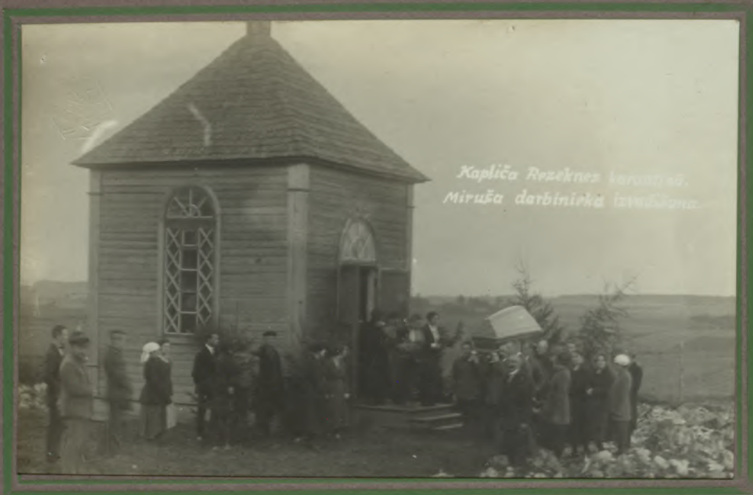
Kapliņa Rzeknes karantīnā. Miruša darbinieku izvadīšana.