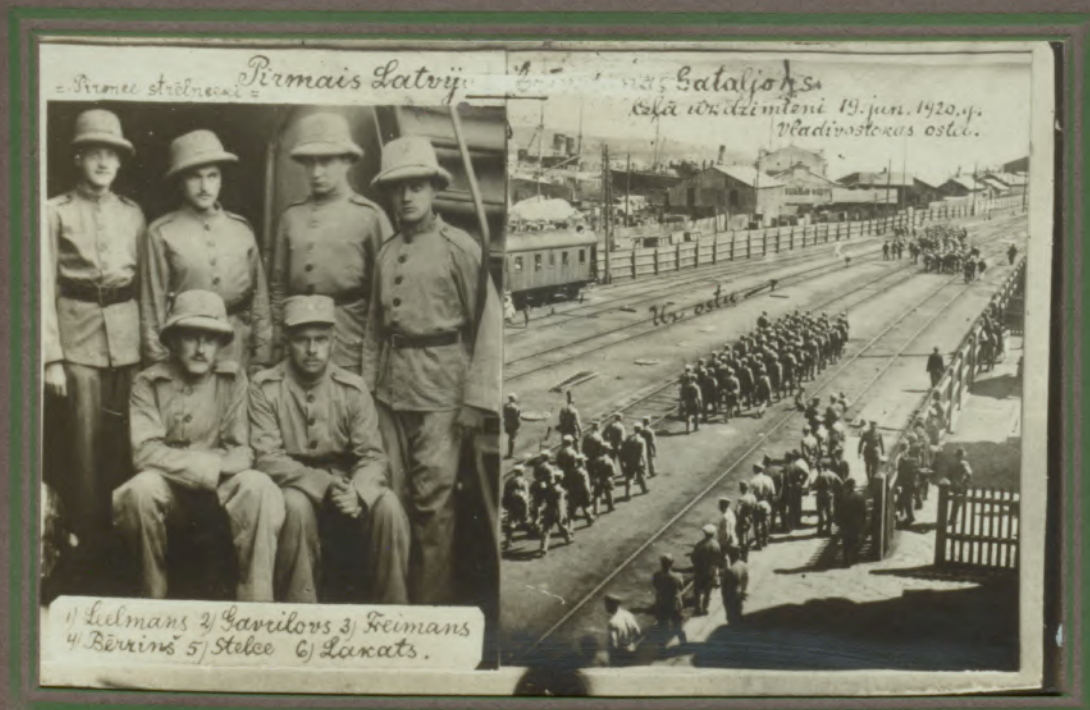
Pirmais Latviju Kasā W. dzimtoni 19. jun. 1920. g. Vladivostokas ostā.