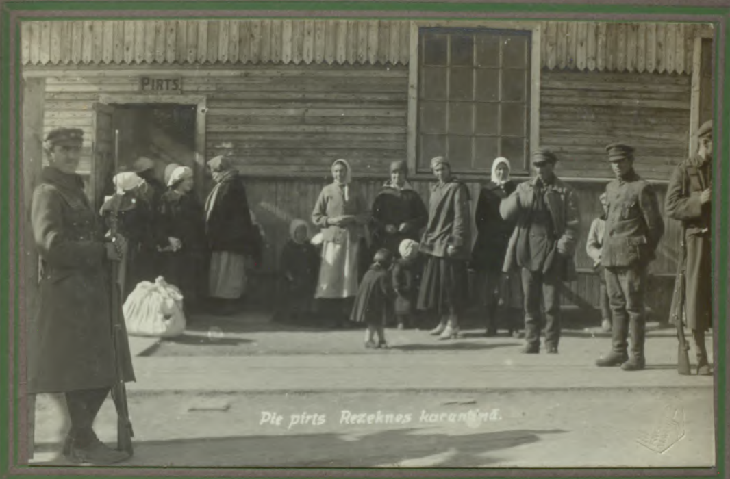
Pie pirts Rezeknes karantīnā.