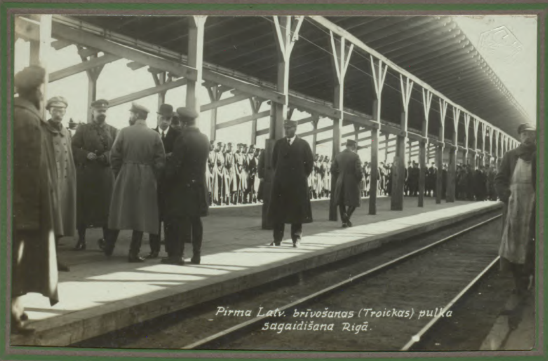
Pirma Latv. brīvības (Troickas) pulka sagaidīšana Rīgā.