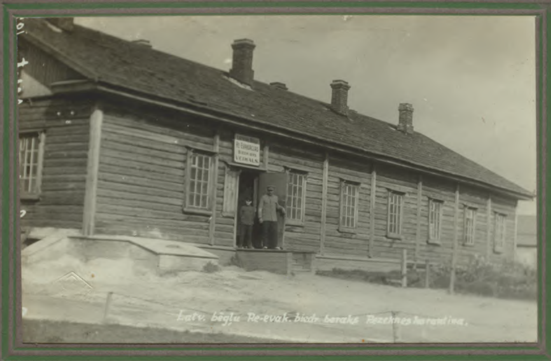
Latv. bēgļu Re-evak. bēdri baraks Rezeknes karantīnā.