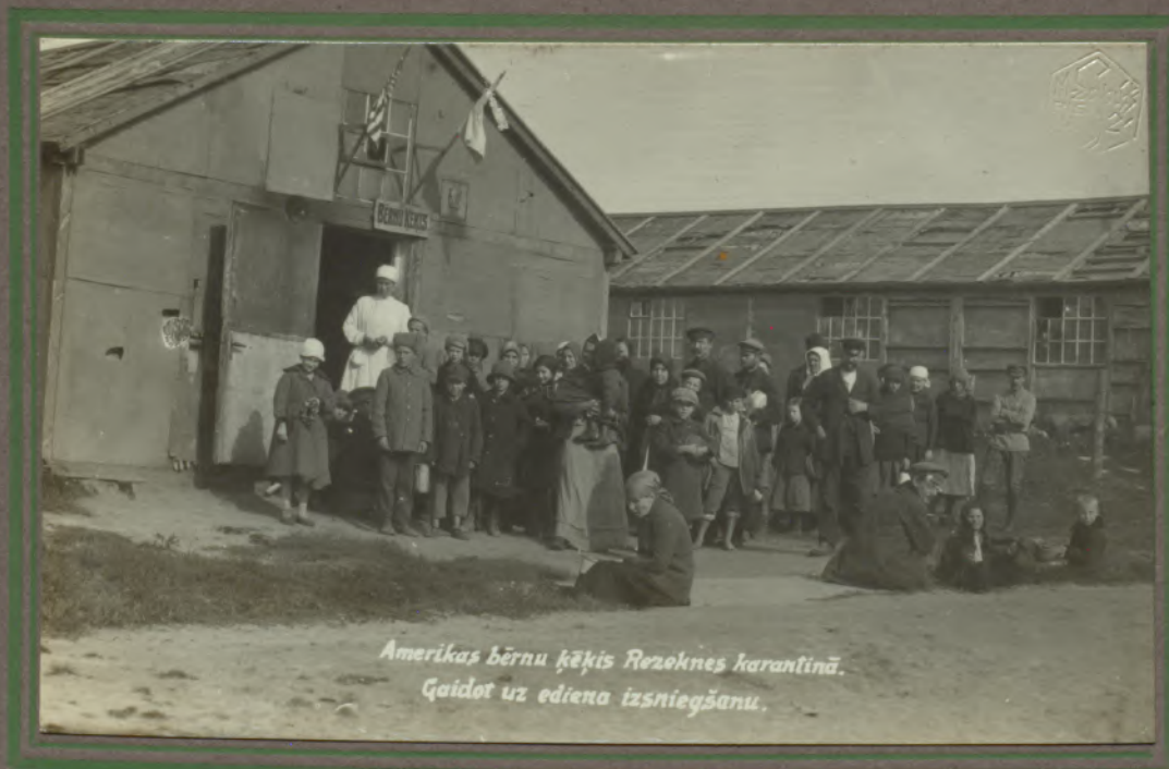
Amerikas bērnu ķēķis Rezoknes karantinā. Gaidot uz ēdiena izsniegšanu.