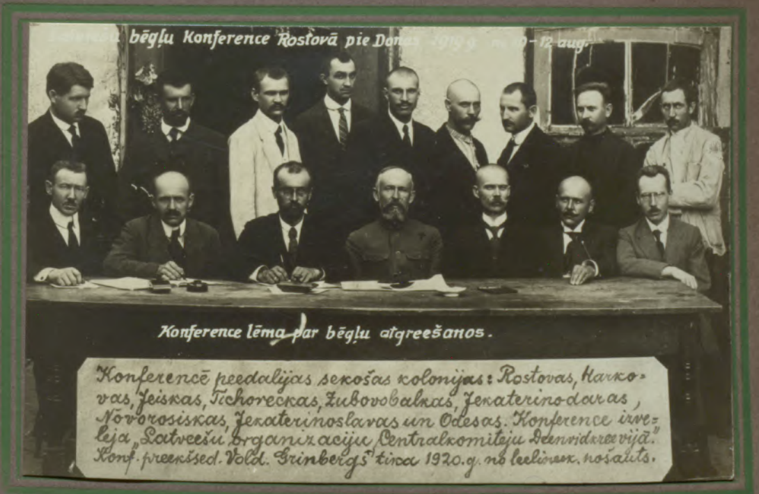
bēgļu Konference Rostovā pie Donas 1920. g. 9-12. aug.