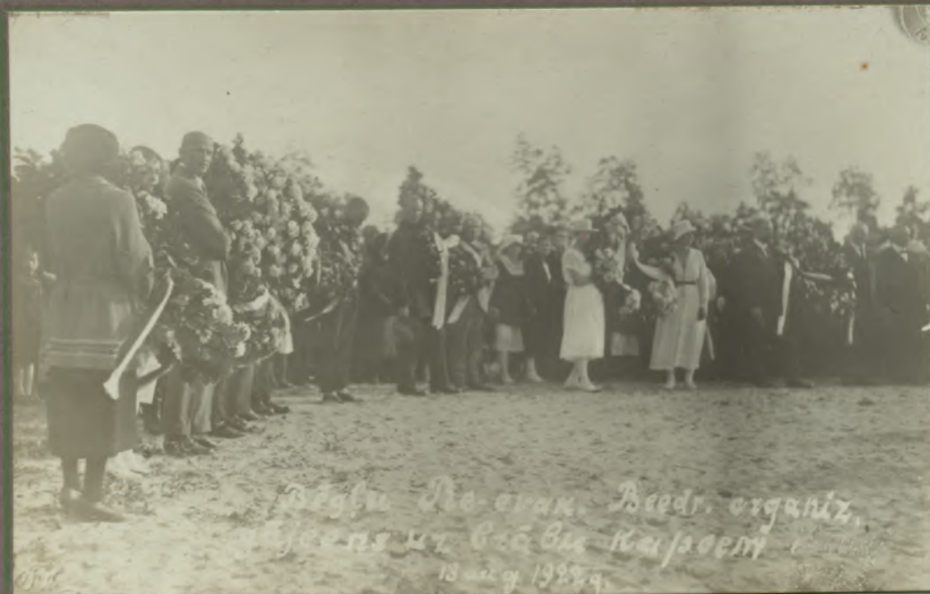
Rēglu Rēv. Biedr. organiz. gājeens uz Brāļu kapiem 13 aug. 1922 g.