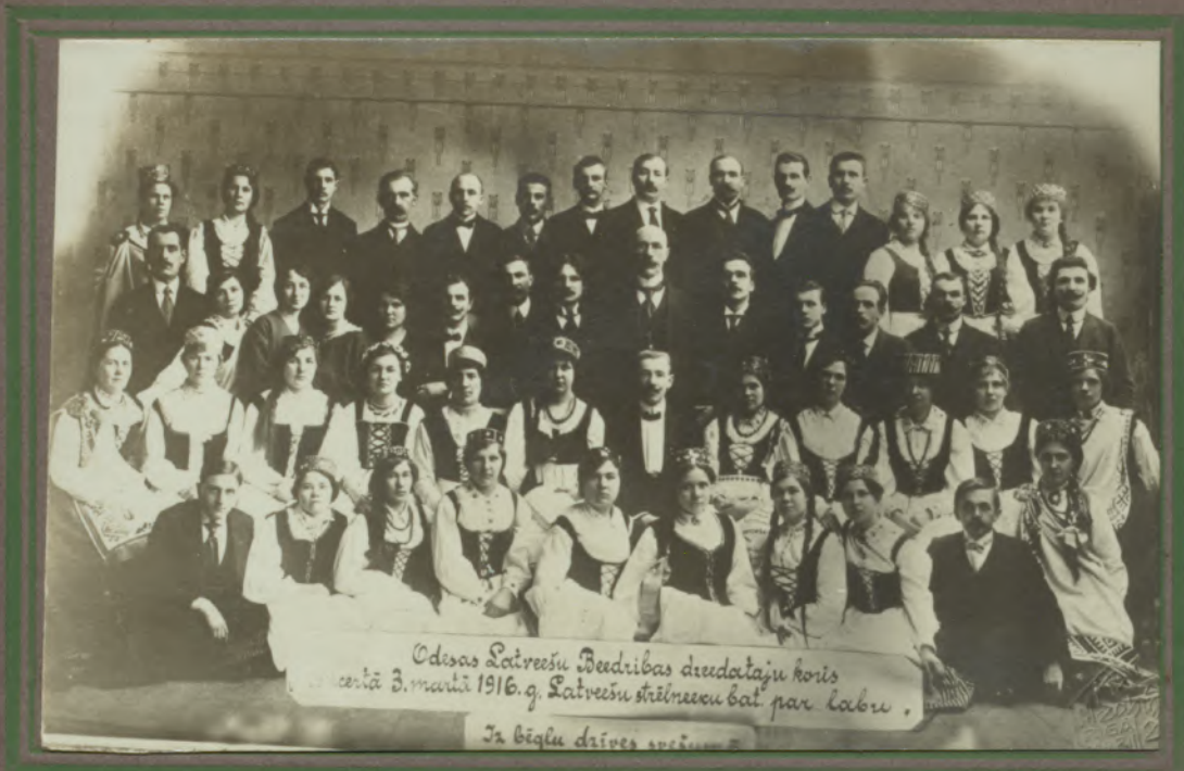
Odesas Latviešu Biedrības dziedātāju koris centā 3. martī 1916. g. Latviešu strēlnieku bat. par labu. Ja bēgļu dzīves apstākļos.