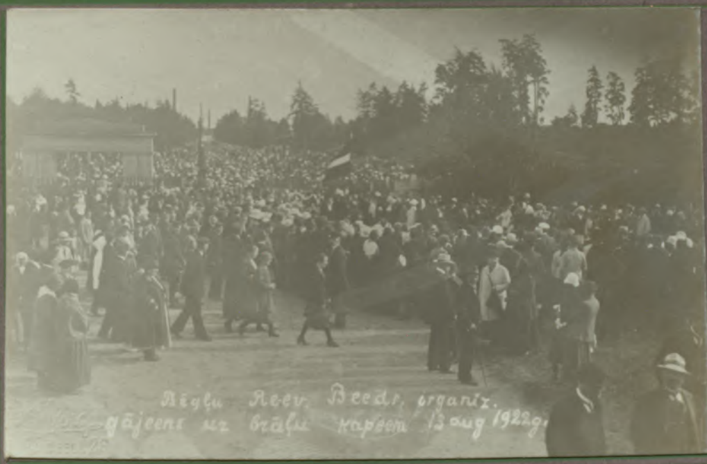
Rēglu Rēv. Biedr. organiz. gājeens uz brāļu kapiem 13 aug 1922 g.