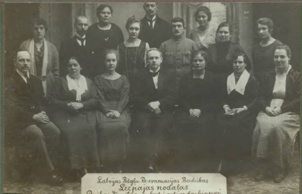
Latvijas Bēgļu Re-evakuācijas Biedrības Secināšanas nodaļas Pārvaldes Komiteja un biedri aktīvos darbinieki.