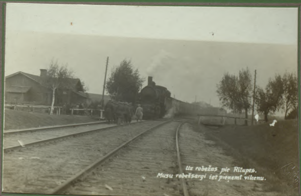
Uz robežas pie Rītupes. Mūsu robežsargi iet pieņemt vilcenu.