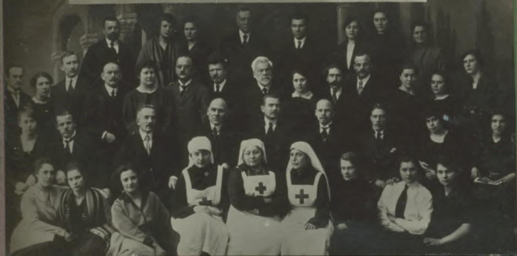
Jekšlietu Ministrijas kara gūstekņu un Bēgļu Nodaļas ierēdņi 1922 g.