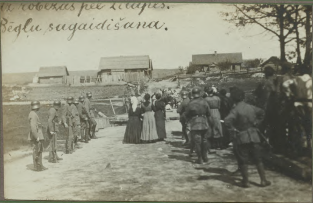
Uz robežas pie Lielupes. Bēglu sagaidīšana.