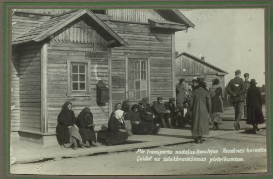
Pie transporta nodaļas končļes Rzeknes karantīnā Ģaidot uz tālākbraukšanas pieteikumiem.