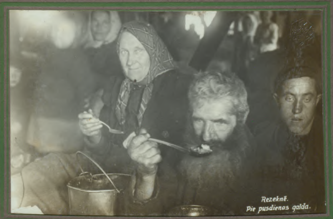
Rezeknē. Pie pusdienas galda.