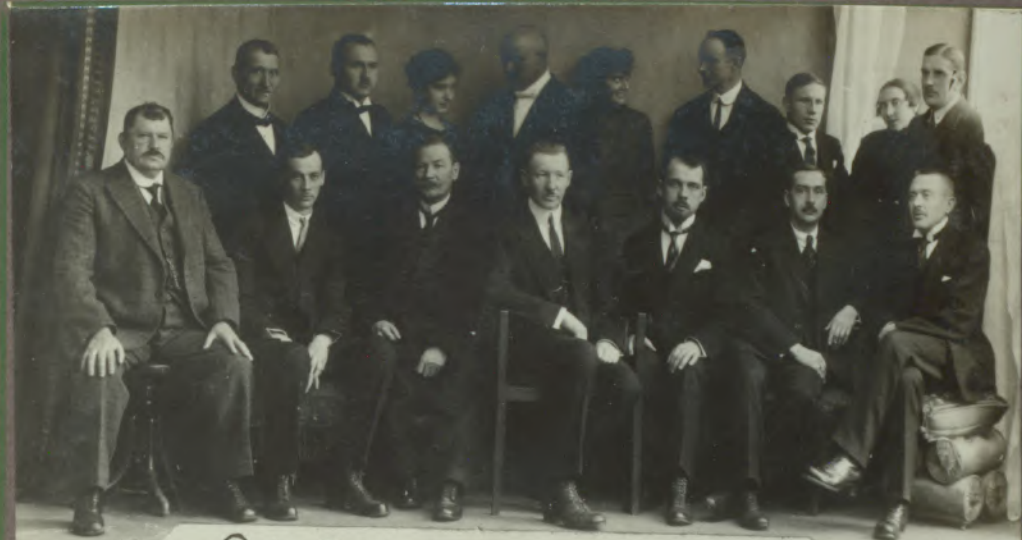
Latv. Bēgļu Re-evakuācijas Biedrības Padomes locekļi 1921. g.