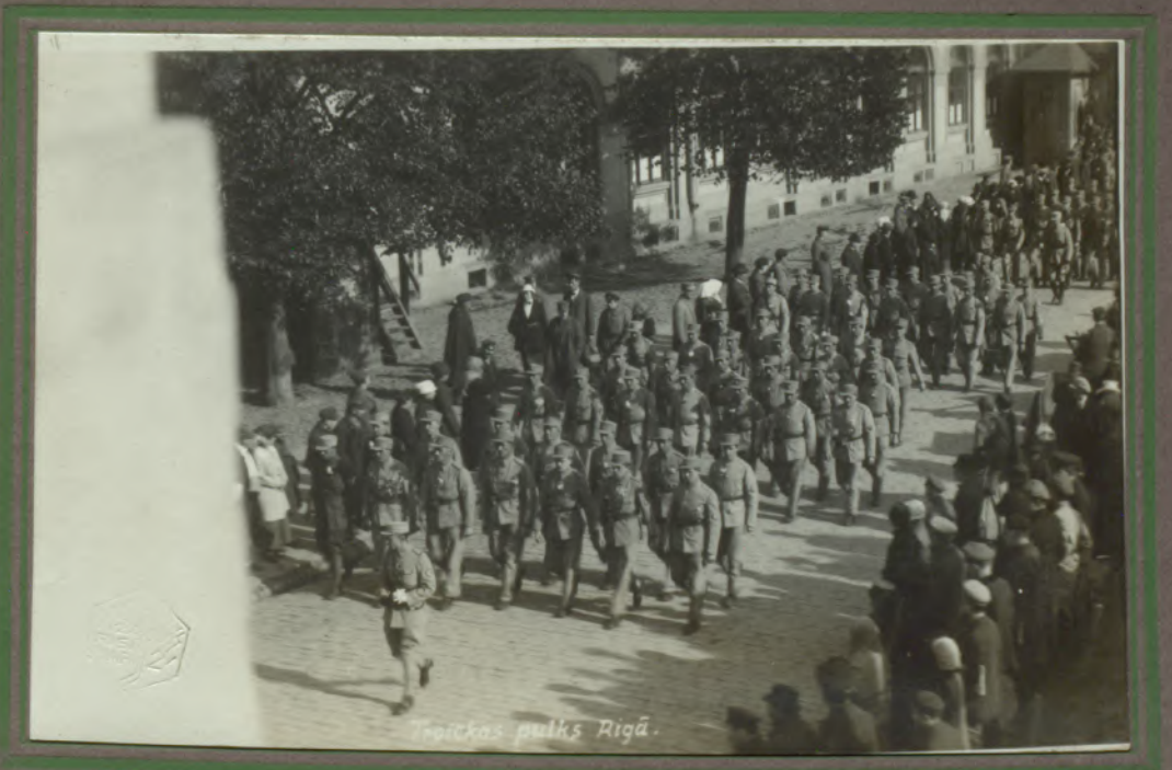
Troickas pulks Rīgā.