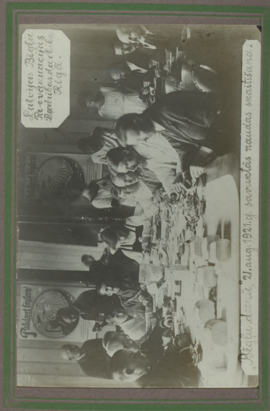
Latvijas Bēgļu Re-evakuācijas Biedrības darība Rīgā.