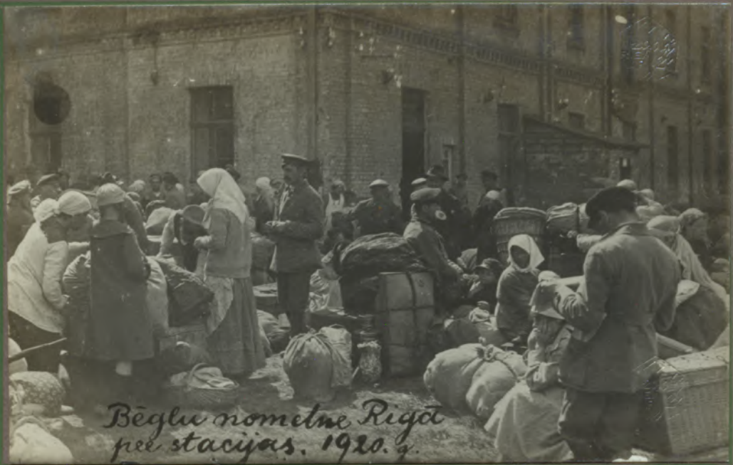
Bēglu nometne Rīgā pie stacijas. 1920. g.