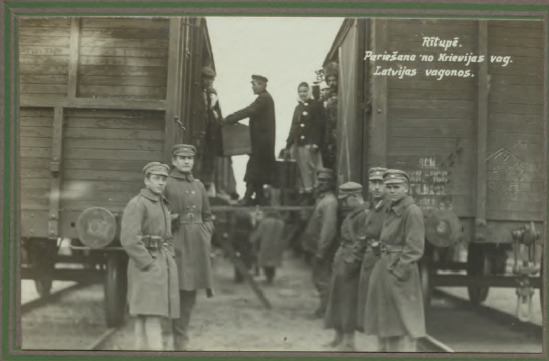
Rītupē. Pariēšana no Krievijas vag. Latvijas vagonos.