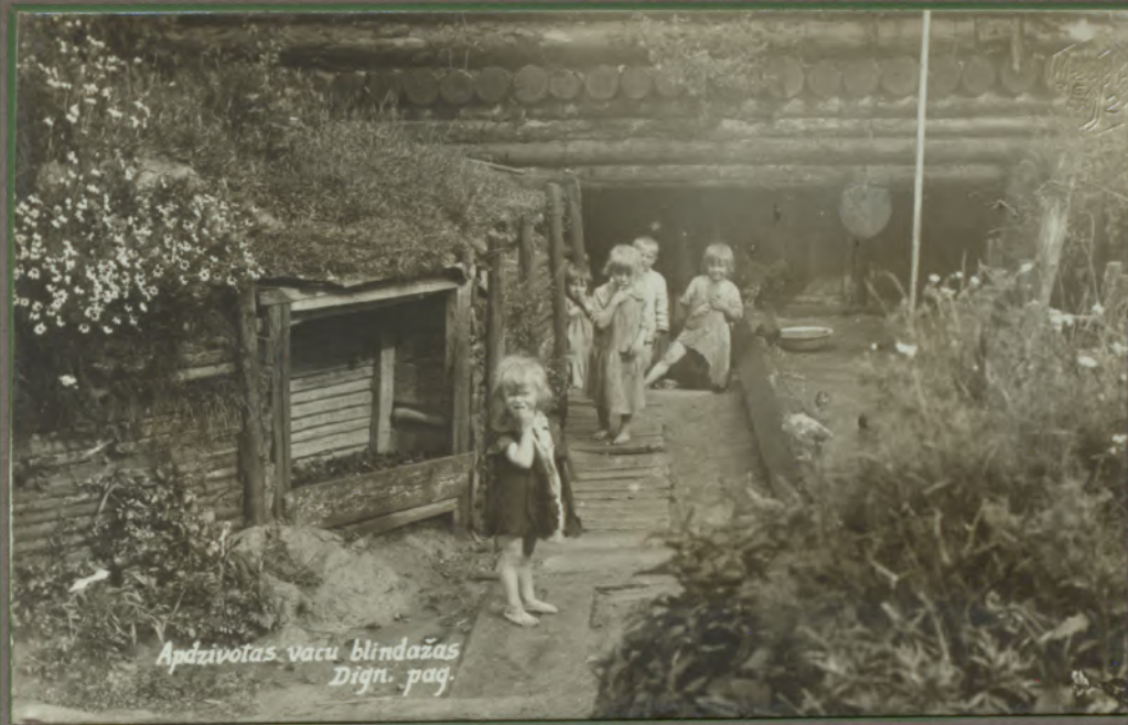
Apdzīvotas vacu blidožas Dign. pag.