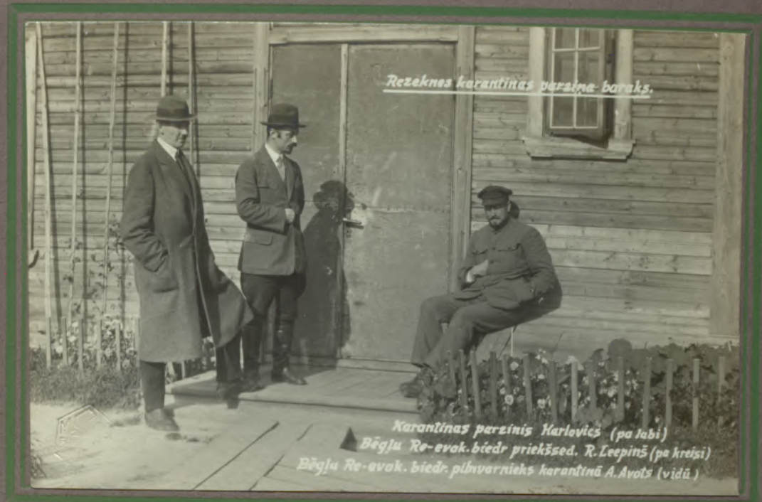
Rēzeknes karantīnas paralne baraks.