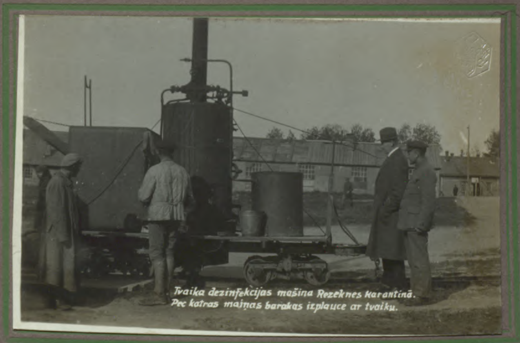
Tvaika dezinfekcijas mašīna Rēzeknes Karantīnā. Pēc katras maiņas barakas izplauce ar tvaiku.