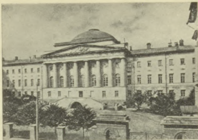
Maskavas universitāte, (vecais nams), dibināta 1755. g. 12. februārī.