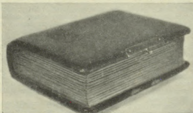
Albums, kuŗu dāvināja latvieŗu studenti Brīvzemniekam, atstājot Maskavu.