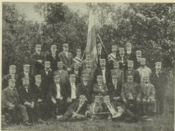
Korporācijas „Fraternitas Moscoviensis” komerss Rīgā 1913. g. 15. jūnijā.