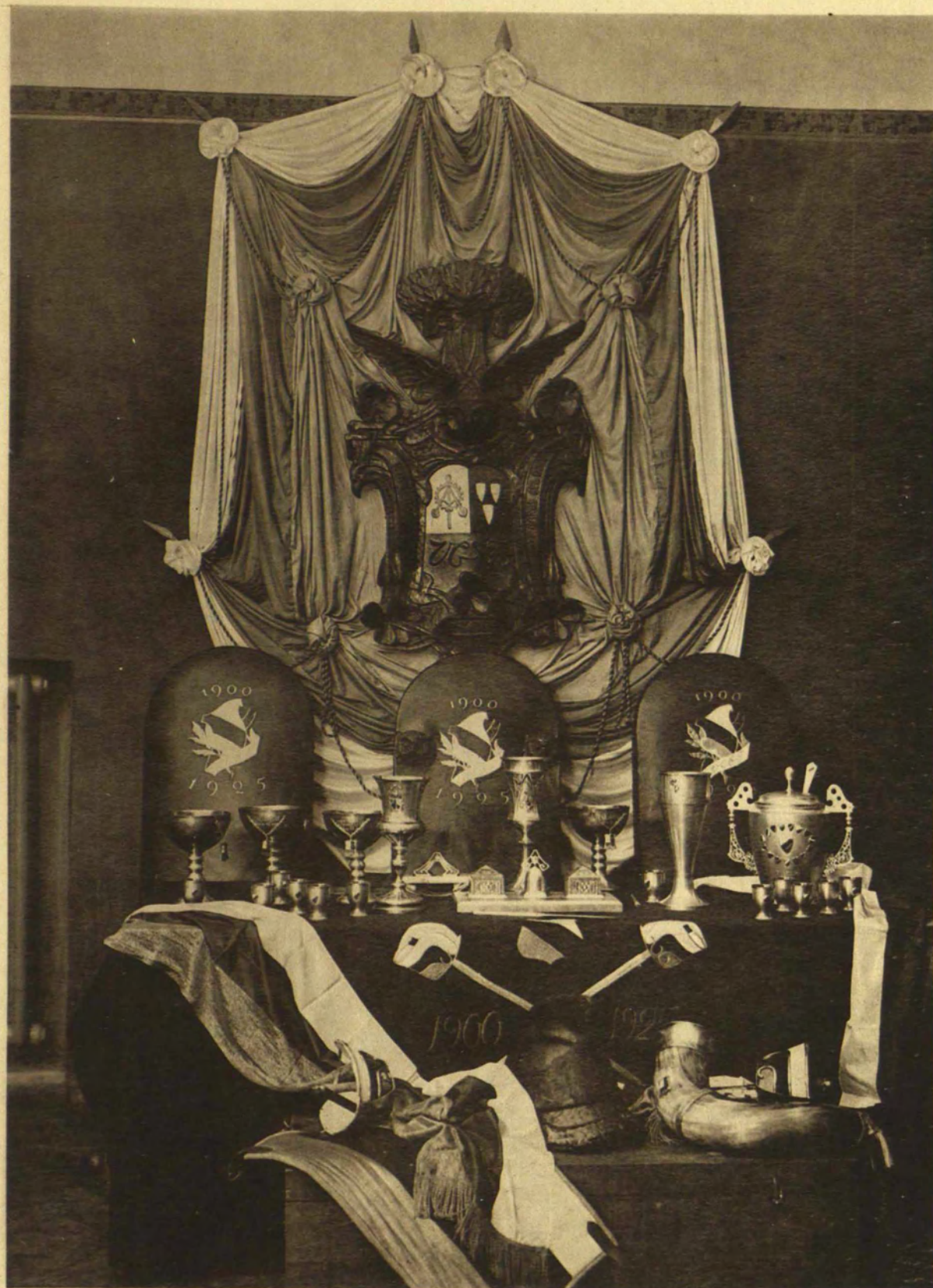
T! 25 gadu jubilejas dāvanas.