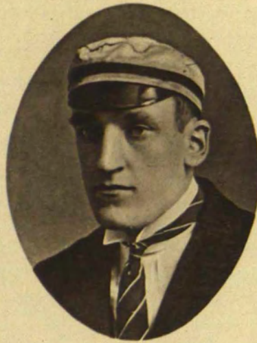
370. Jānis Balodis.