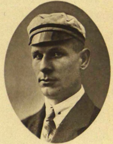
392. Voldemārs Jākobsons.