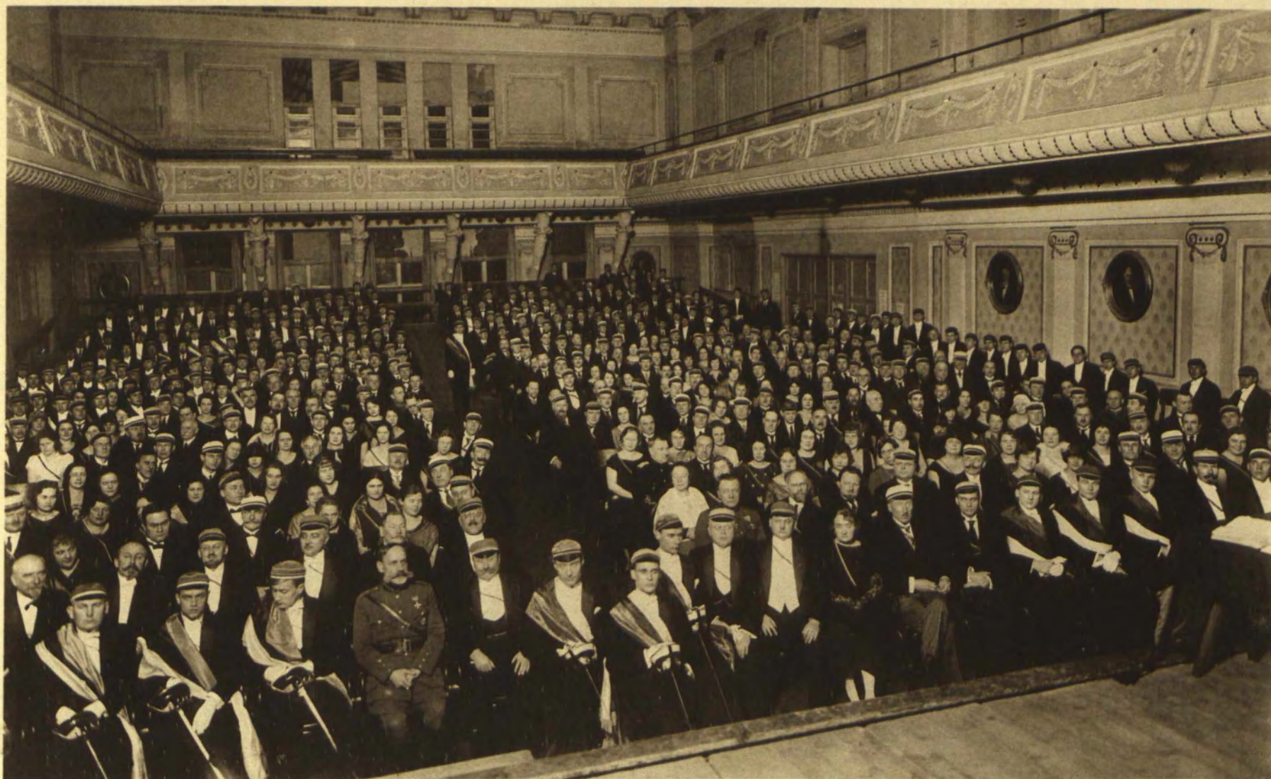
Jubilejas akta viesi R. L. B. zālē.