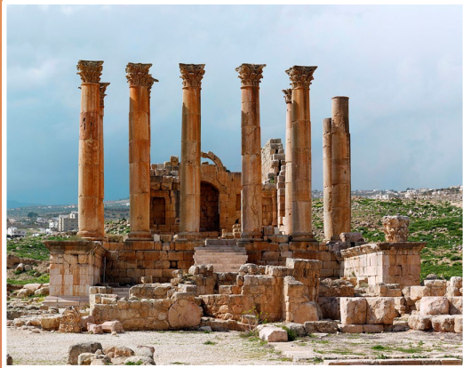
6. gs. pr. Kr.