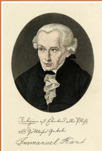
Imanuels Kants (1724—1804)