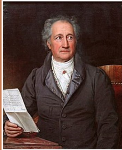
Johans Volfgangs Gēte (1749—1832)