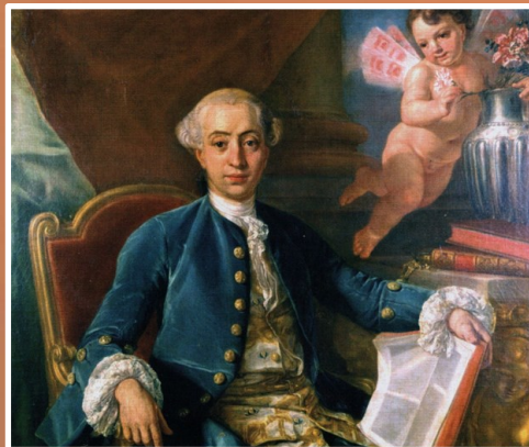
Džakomo Kazanova (1725—1798)