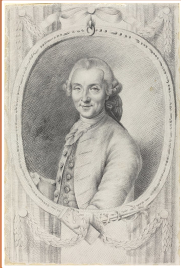
Johans Gotfrīds Herders (1744—1803)