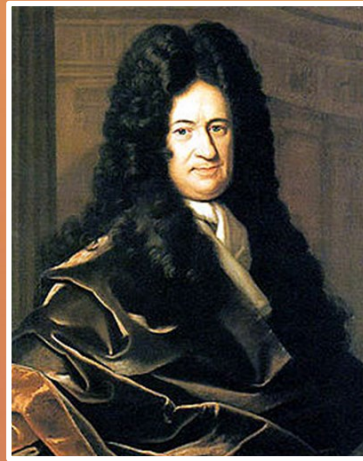
Gotfrīds Vilhelms Leibnics (1646—1716)