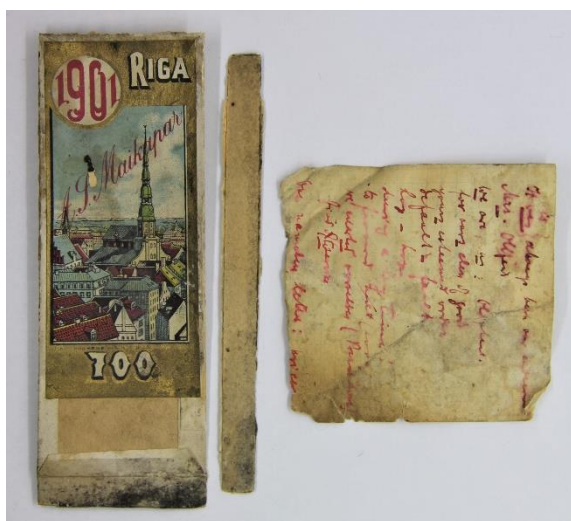
A. S. Maikapars rūpnīcas papīrosu kastītes "Riga 1901. 700" vāks. LU Muzeja krājums.