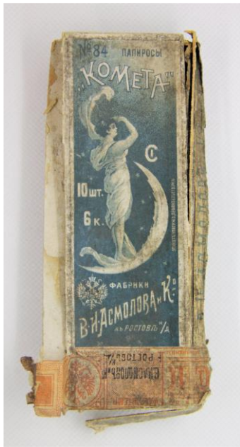
V. I. Asmolov rūpnīcas papirosu kastīte "Komet". LU Muzeja krājums.

Iepakojuma kastīte ir sānos saplīsusi un notraipīta, taču vāka dizains ir saglabājies – uz tā ir augošs mēness, uz kura stāv baltā palagā ietīta tumšmataina sieviete. Tas potenciāli varētu saistīties ar kādu mitoloģisku tēlu, iespējams, mēness mūzu, vai romiešu dievību Lunu – mēness dievieti, kas antīkajos darbos attēlota līdzīgos motīvos. 16 Iemesls šādam atainojumam nav skaidrs, bet tas potenciāli varētu saistīties ar tā laika tendenci Krievijas impērijas valdošajai elitei Krieviju traktēt kā Romas impērijas tiesisko mantinieci. Līdzās tam, krievu valodā uz kārbīņas aprakstīts ražotājs, izcelsmes vieta un cena – 6 kapeikas par 10 gabaliem, kā arī uzlīmēta virsū tāda pati akcijas uzlīme kā iepriekš apskatītajai Maikapar kastītei. Tas varētu liecināt par to, ka kastītes iepirktas vienā