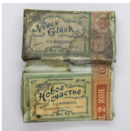
A. S. Maikapar rūpnīcas papirosu kastīte “ Novoje sčastje/ Neues Glück ”. LU Muzeja krājums.

Nākamā Maikapar papirosu kastīte ir saglabājusies krietni pilnvērtīgāk – gan vāks, gan kastīte pilnā apjomā turas kopā. 10 To rotā dekoratīvi florālie elementi, kas raksturīgi baroka stilam un uz vāka virspusē rakstīts teksts krievu valodā “ Новое счастье ” – Jaunā laime. Pārējais teksts arī ir krievu valodā, aprakstīta ražotāja rūpnīca un produkta nosaukums. Otrā pusē, kas ir krietni vairāk noputējusi, redzams tāds pats dizains un apraksts vācu valodā “ Neues Glück ”, kas iezīmē laikmeta valodu dualitāti Latvijas teritorijā. Uz iepakojumu kastītēm nebija teksta latviešu valodā – toreiz pilsētnieku sarunvaloda bija vācu un