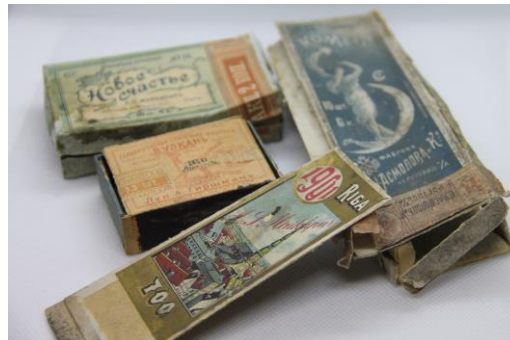
Studentu karcerī atrastās sērkokociņu un papirosu kastītes. LU Muzeja krājums.

1875.g. Rīgas Politehnikumā tika pabeigta studentu disciplinēšanas telpas jeb Studentu karcera izbūve. Par karcerī pavadīto laiku, liecina ne tikai uz sienām atstātie studentu zīmējumi, bet arī papirosu un sērkokociņu iepakojumu kastītes. Tas apstiprina to, ka Studenti karcerī arī smēķējuši, taču kur izmantotie papirosi un sērkokociņi ražoti un kādus stāstus tie ‘glabā’?