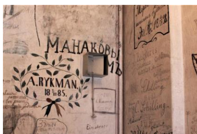
Ventilācijas šahta Studentu karcerī, kur atrastas sērkokociņu un papirosu kastītes.

Studentu karceris ir valsts aizsardzībā esošs kultūras piemineklis, kurā laika periodā 1875.-1905.g. ieslēdza studentus par disciplīnas normu pārkāpumiem, kas bija - lekciju kavēšana, skolas priekšmetu un ierīču bojāšana, pasniedzēju neklausīšana, menzūras ciršana (divkauja ar uzasinātiem rapieriem) u.c. Par šiem pārkāpumiem studentus varēja ieslēgt karcerī uz laika periodu no 12 stundām, līdz 5 pilnām dienām. 1 Karcerī studentiem nebija nodarbjū, tāpēc viņi izdomāja radošus veidus kā pavadīt laiku, tai skaitā apzīmēt sienas. Cita nodarbe bija smēķēšana. Gluži kā sērkokociņu vai cigarešu iepakojumi mūsdienās, arī toreiz tie bija produktu lietošanas pārpalikumi, kurus nebija nepieciešamība uzglabāt, tāpēc tie tika izmesti. 2000. gadu sākumā, kad Latvijas Universitātes (LU) galvenajā ēkā tika veikti remontdarbi, strādnieki karcera ventilācijas šahtā atrada kastītes un tās tika nodotas LU Muzejam. Mūsdienās Studentu karceris ir LU Muzeja pārziņā, un tajā notiek muzeja speciālistu darbs pie vēstures pieminekļa pētniecības.