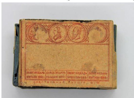
“Luijs A. Hiršmans” apakšpuse, ar medaļām. LU Muzeja krājums.

Kastītes otrā pusē redzami četri aplī. Tās ir starptautiskos konkursos iegūtās