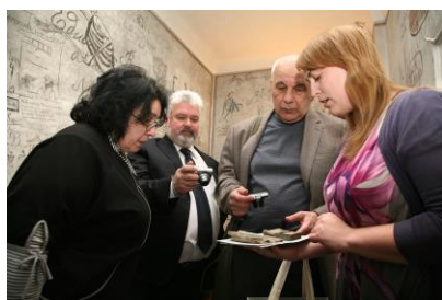
Maskavas delegācijas viesošanās Studentu karcerī un sērkokociņu un papirosu kastīšu apskate.