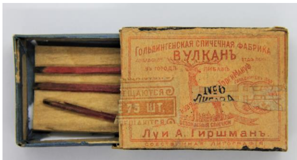
Kuldīgas rūpnīcas "Vulkāns" sērskociņu kastītes "Luijs A. Hiršmans" virspuse ar sērskociņiem. LU Muzeja krājums.

Lai tabaku varētu smēķēt, bija nepieciešami sērskociņi, ar ko smēķi aizdedzināt. Vienīgā Studentu karcerī atrastā sērskociņu kastīte ir ražota A/S "Vulkāns", 17 kas ir viena no zināmākajām sērskociņu rūpnīcām Latvijas vēsturē, tāpēc tās atrašana nav sevišķi pārsteidzoša. Sērskociņu rūpnīcu "Vulkāns" 1878.g. Kuldīgā