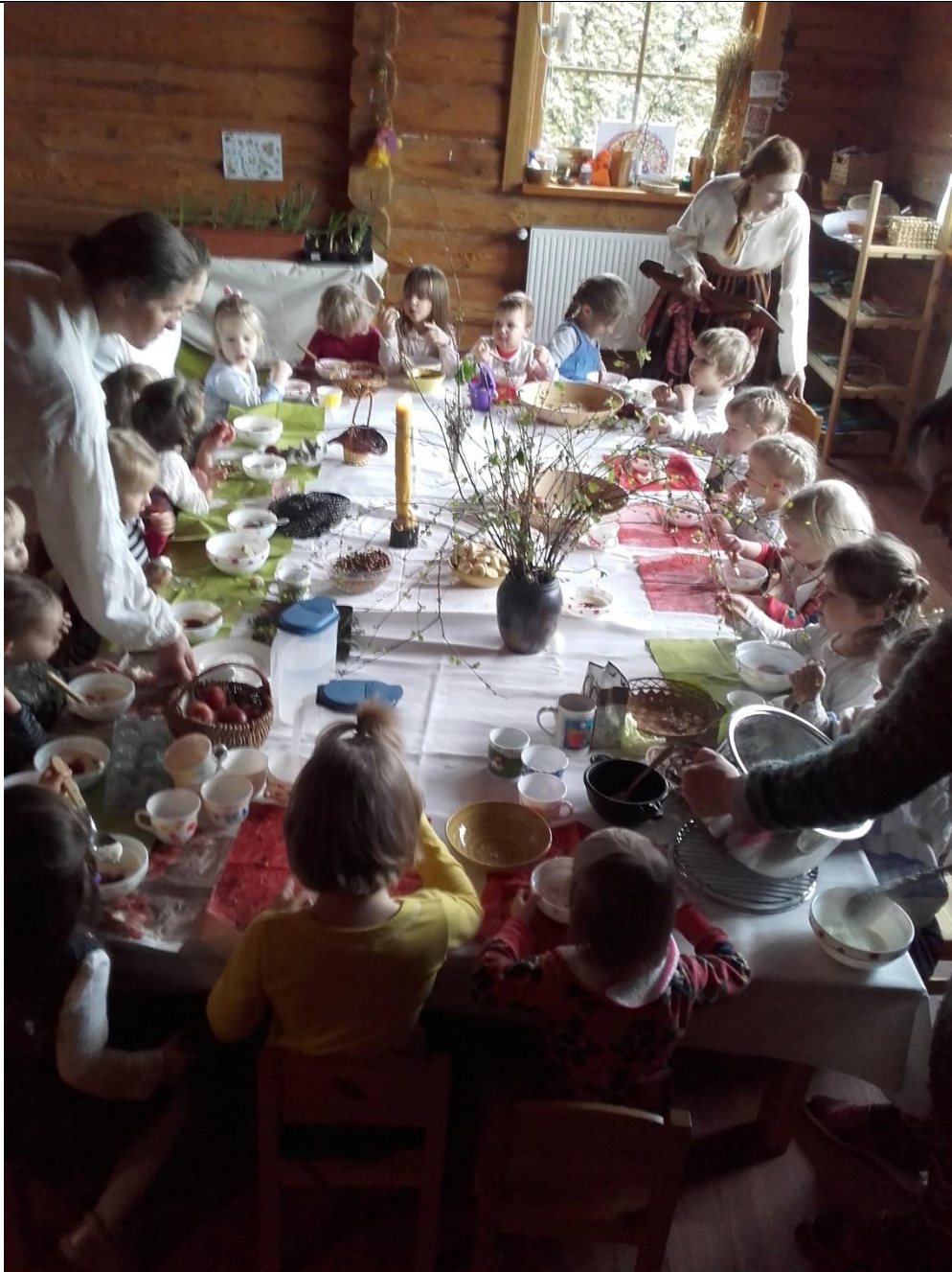
1.Attēls. Svētku brokastis.