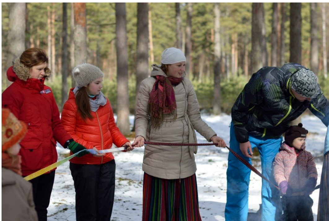
1.Attēls. Saules sveikšana.