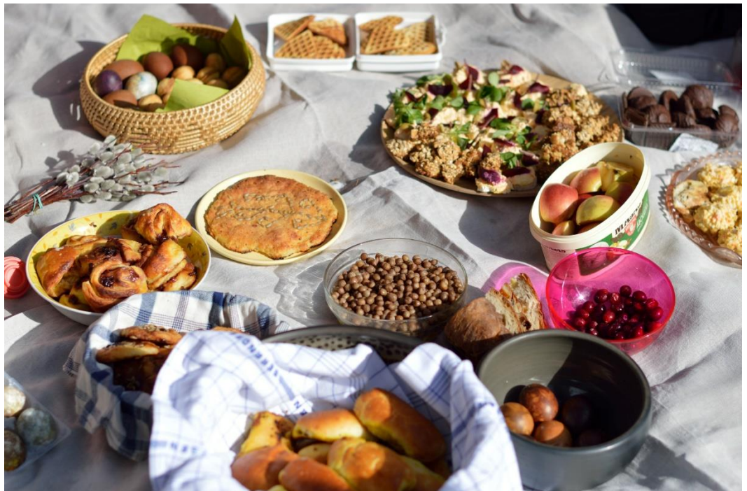
10.Attēls. Svētku mielasts.