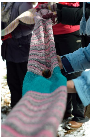
2.Attēls. Olas ripināšana, simbolizējot saules ceļu.