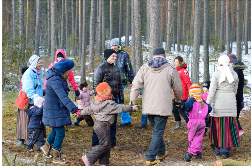
5.Attēls. Rotaļa “Bagātais un nabadziņš”