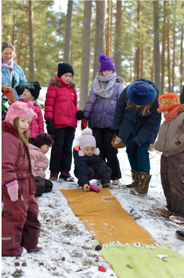
9.Attēls. Olu ripināšana.