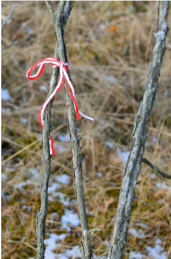
4.Attēls. Aizsardzības rituāls.