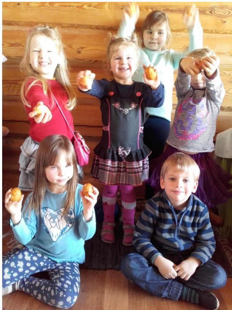
5.Attēls. Olas pirms svētkiem nokrāsotas!