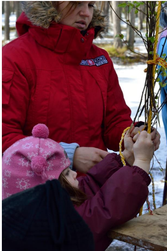
6.Attēls. Šūpoļu rotāšana ar bērzu zariem un pīnītēm.