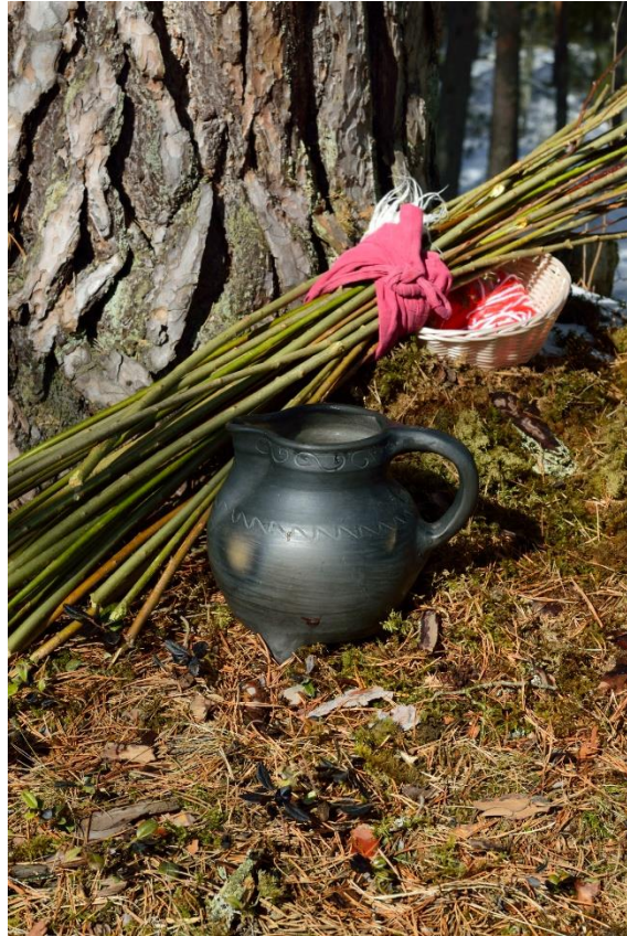
3.Attēls. Rituālu atribūti. Avota ūdens, šautras, dzijas pavedieni.