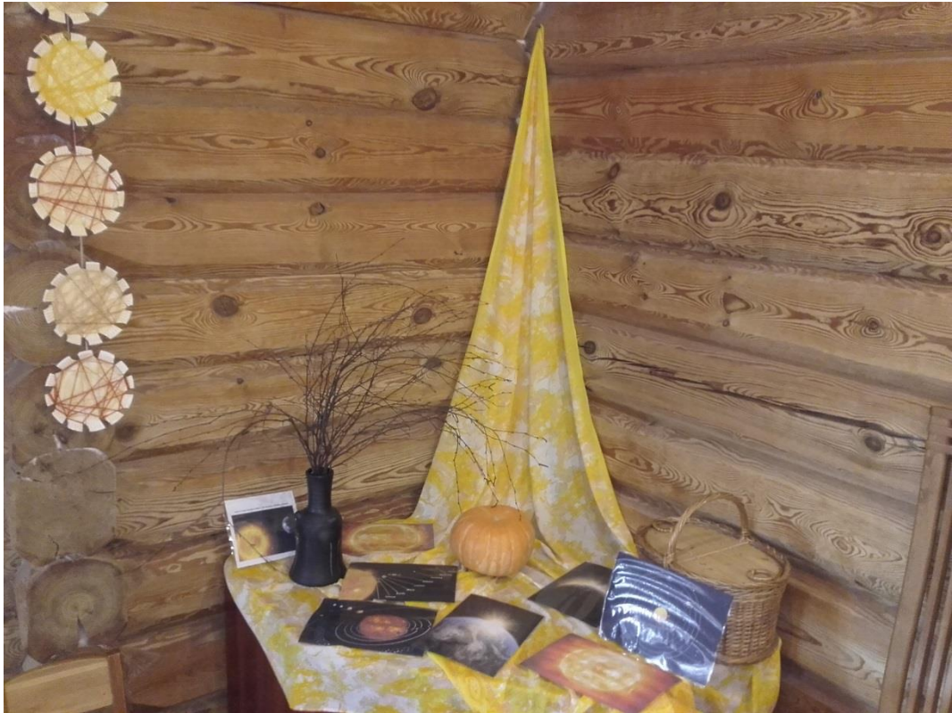
3.Attēls. Saule, svētku laika noteikšana..