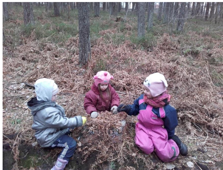
2. Attēls. Spēļu laiks, kad šautras mežā atrastas.