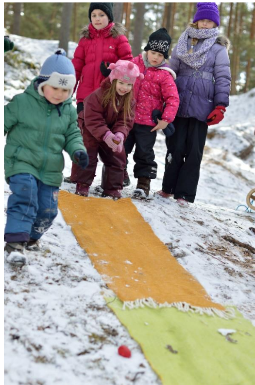
8.Attēls. Olu ripināšana