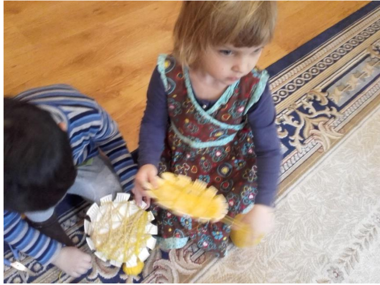
5.Attēls. Saulīšu tīšana.