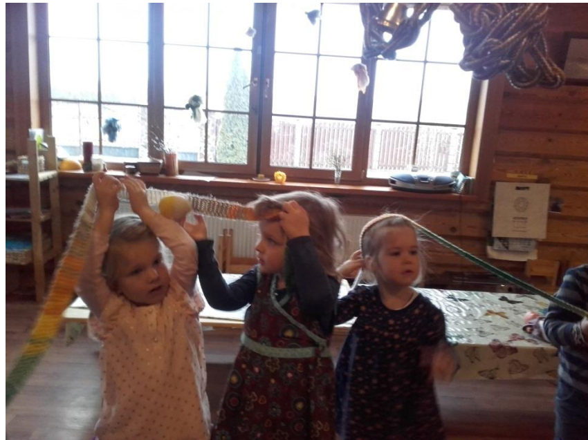
1. Attēls. Bērni dzied "Riti, riti saulīte" un rīpina "saulīti".