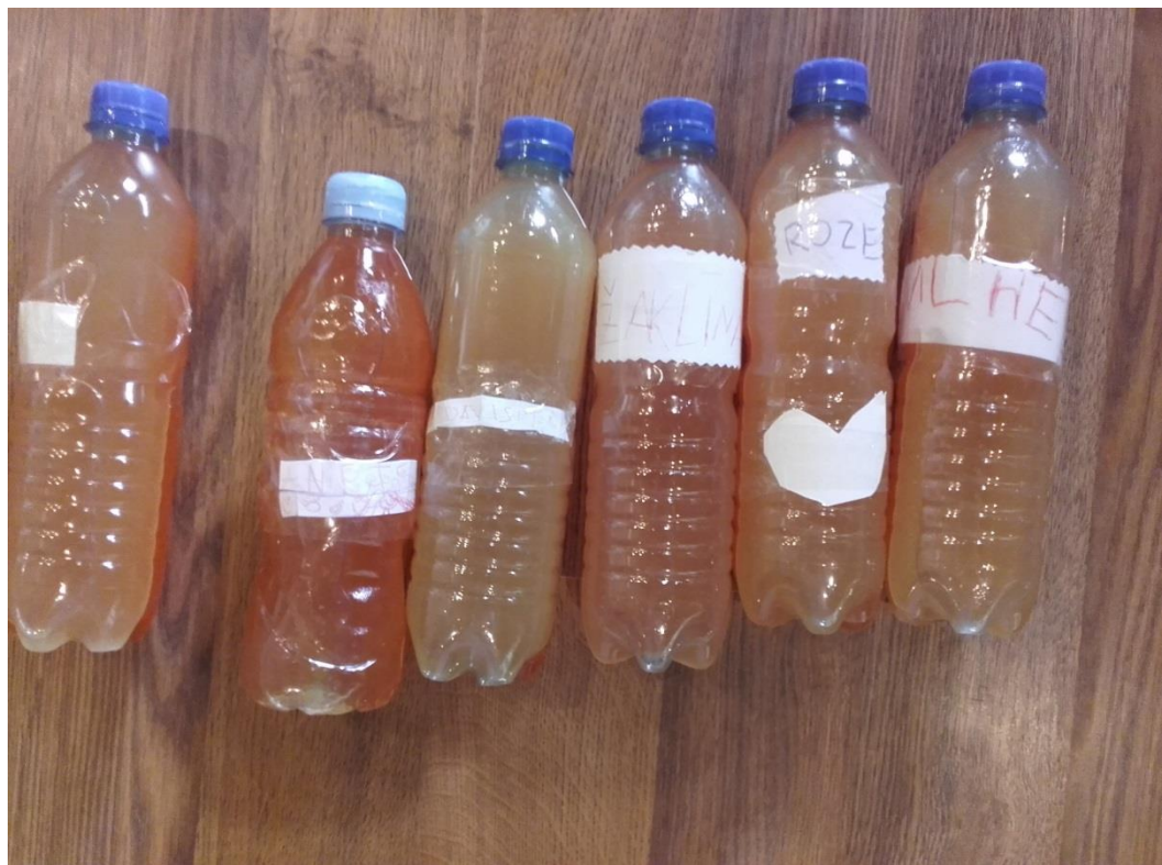
4.Attēls. Eksperiments saules nedēļā.