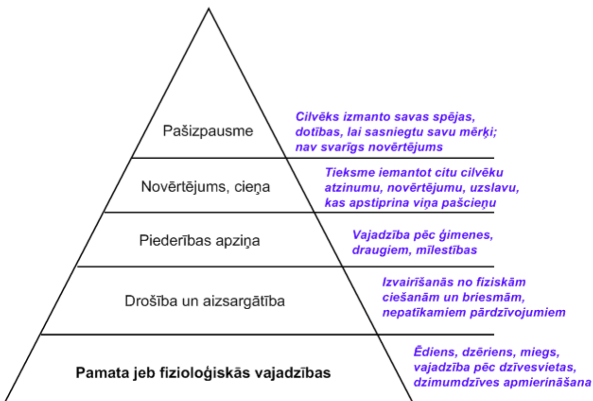
Abrahama Maslova vajadzību piramīda

1.attēls A. Maslova vajadzību hierarhijas piramīda . (Puškarevs, Golubeva, 1999,118).