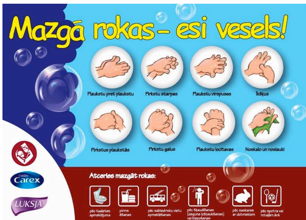
1.attēls. Mazgā rokas – esi vesels!

Vannas istabas telpā darba autore, pie sienas ir piestiprinājusi attēlu, kur bērni var redzēt kā pareizi mazgāt rokas un kāda ir pareiza roku mazgāšanas secība. Attēls ir krāsains, labi pārredzams, bērnus tas piesaista (sk. 1. attēlu).