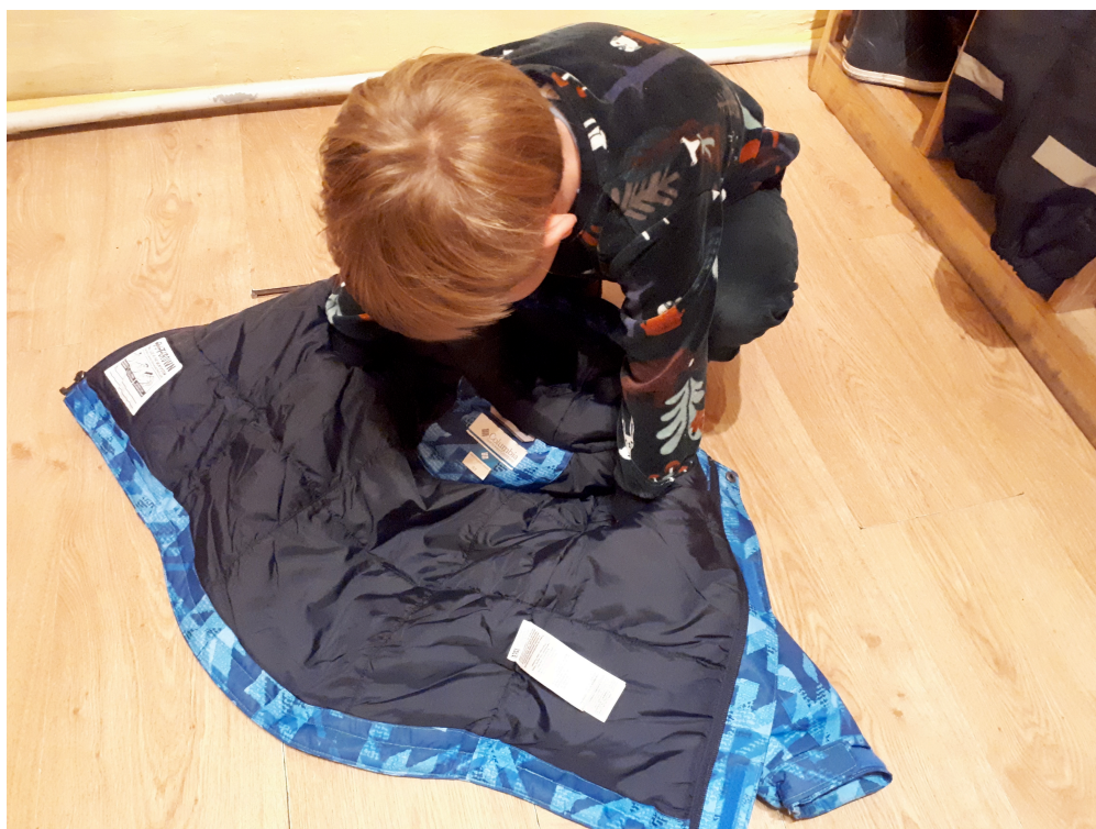
3.attēls. Virsjakas uzvilšana.

Darba autore novēroja, ka bērni, kuriem bija pirkstainieki, kļuva gražīgi, emocionāli, tāpēc pedagogs mudināja vecākus iegādāties dūraiņus, kas ir vieglāk uzvelkami. Tika novērots, ka virsjaku uzvilšana bērniem šķita ļoti sarežģīta un tāpēc bērni nemaz necentās tās uzvilkt. Līdz ar to, pedagogs virsjaku uzvilšanu mēģināja padarīt mazliet interesantāku un piedāvāja bērniem jaku uzvilkt to noliekot uz grīdas sev priekšā ar kapuci pie kājām, pēc tam ieliekot rokas piedurknēs un metot jaku pāri galvai (sk. 3. Attēlu).