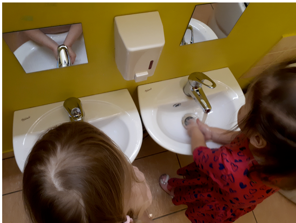
2.attēls. Roku mazgāšana.

Bērni noklausījušies tautasdziesmu, cenšas patstāvīgi mazgāt rokas, un darba autore vēlreiz skaita tautasdziesmu. Bērni to atveido. Ņemot vērā, ka vannas istabas telpā ir trīs izlietnes, autore liek bērnus tādā secībā – vienu, kurš prot patstāvīgi mazgāt rokas un divus, kuriem nepieciešama palīdzība. Tā tiek kontrolēta kārtība vannas istabā un ir iespēja palīdzēt tiem, kuri patstāvīgi nemazgā rokas. Ir novērots, ka tie bērni, kuri neprot patstāvīgi mazgāt rokas, pievērš uzmanību blakusstāvošajam bērnam, kuram tas izdodas pareizi, veikli un kurš tiek uzslavēts, un cenšas to atdarināt (sk. 2. attēlu).