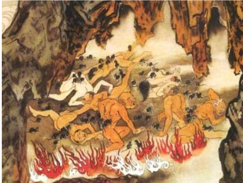
7. elles līmenis. Nieres izraušana (autors Dzian i-dzi , 江逸子) 185