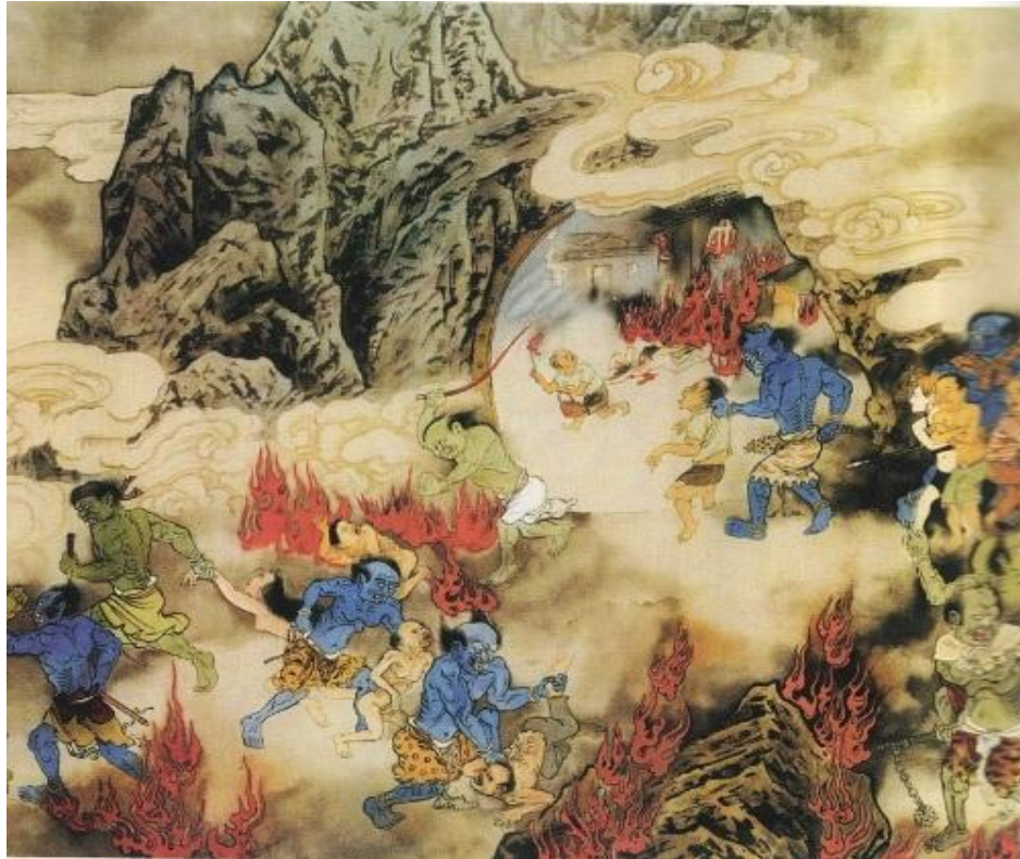
1. elles līmenis. Grēku spogulis (autors Dzian i-dzi , 江逸子) 177