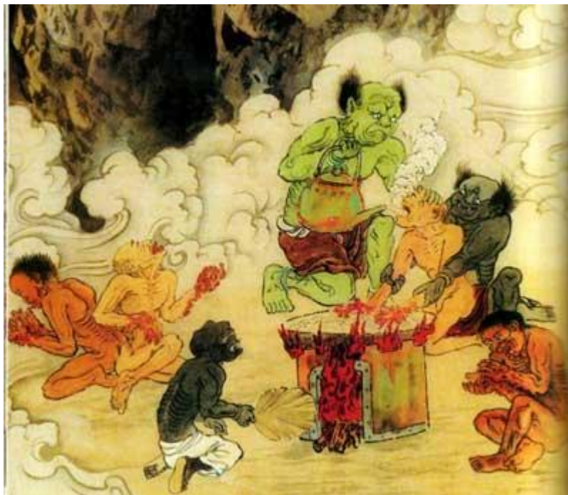
5. elles līmenis. Ieliešana mutē vardošo ūdeni (autors Dzian i-dzi , 江逸子) 182