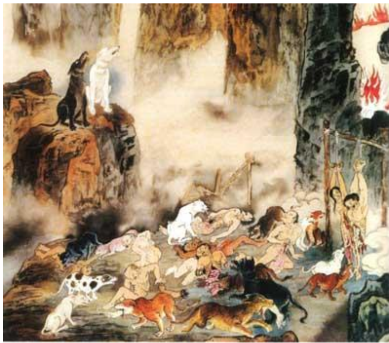
7.elles līmenis. Kāpnes ar nažiem (autors Dzian i-dzi , 江逸子) 186