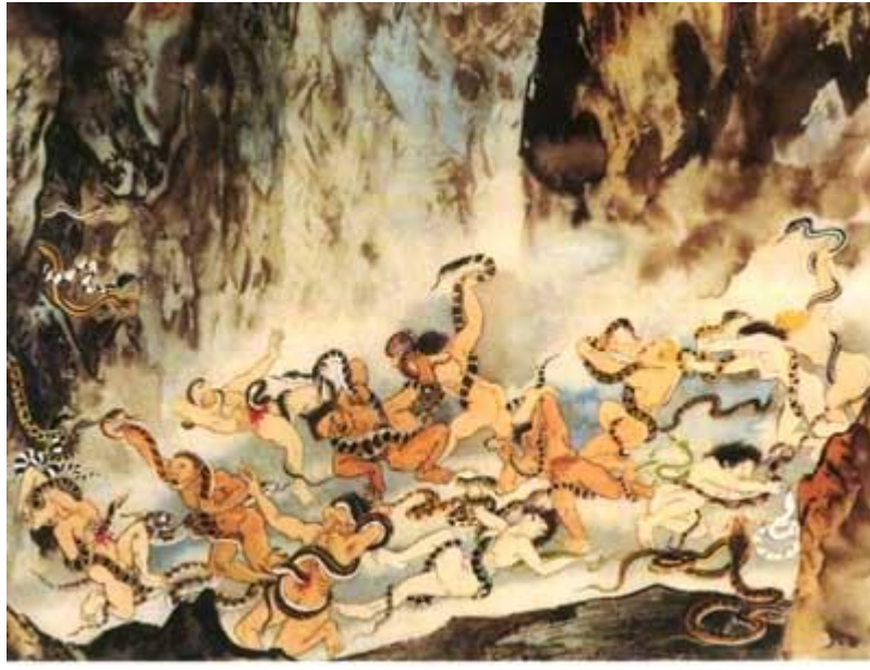
9.elles līmenis. Vieta ar indīgām čūskām (autors Dzian i-dzi , 江逸子) 188