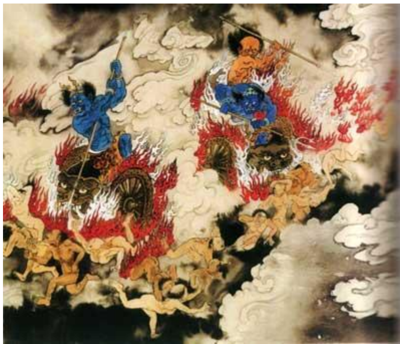
4. elles līmenis. Ugunīgi rati (autors Dzian i-dzi , 江逸子) 183