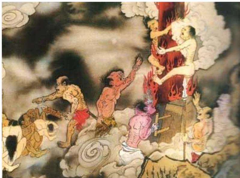
4. elles līmenis. Elles kolonna (autors Dzian i-dzi , 江逸子) 181