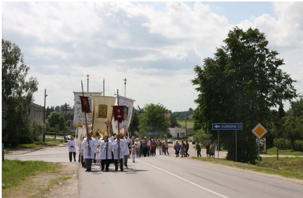
6.4. attēls. Kristus Vissvētākās Miesas un Asins svētki ar procesiju pa Skaistkalni (Žeimunde, 2010)

Dievs Dēls, Dievs Svētais Gars. Pēc šiem svētkiem seko Vissvētākās Jaunavas Marijas apmeklēšanas svētki, kurus atzīmē 31. maijā. Tad seko Kristus Vissvētākās Miesas un Asins svētki un arī šīs svinības ir obligātas („Liturģiskais kalendārs”, 2014). Kristus Vissvētākās Miesas un Asins svētki tiek svinēti ceturdienā pēc Svētās Trīsvienības svētkiem. Šajos svētkos notiek procesija (sk. 6.4. att.).