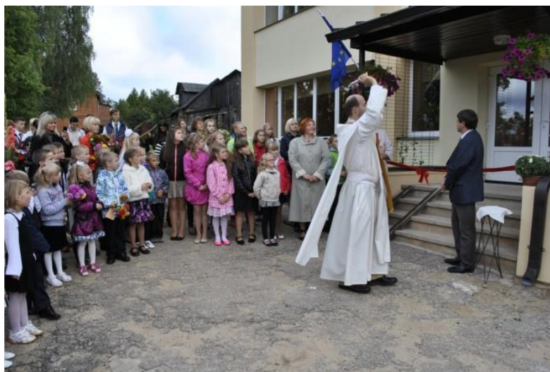
6.1.1. attēls. Skaistkalnē svinīgi atklāj sākumskolas korpusu (Ušča, 2014)

Arī katrā izlaidumā un pēdējā zvanā (sk .6.1.2. att.).