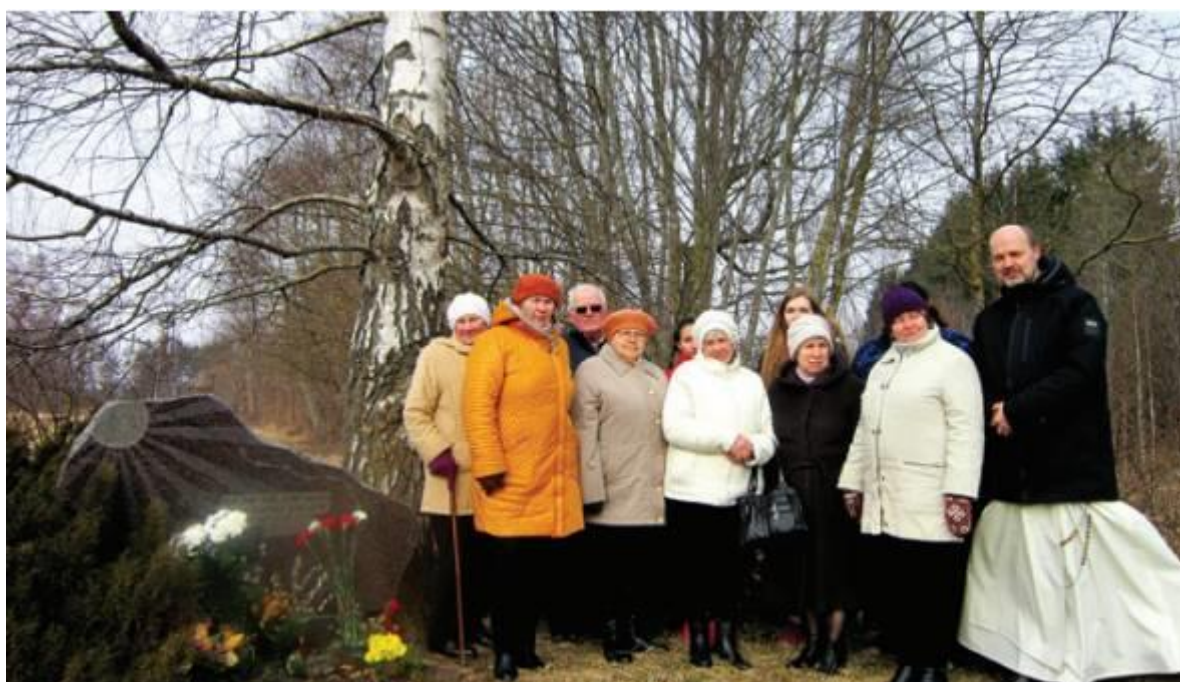
6.6. attēls. Piemiņas brīdis pie Kamnisku akmens