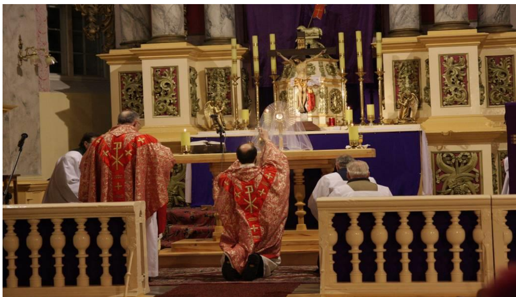
6.2. attēls. Lielā piektdiena Skaistkalnes baznīcā (Žeimunde, 2008)

Viņš ir visas Baznīcas – Kristus Mistiskās Miesas – aizstāvis. Pēc šiem svētkiem seko 25. marts, kurā atzīmē Kunga pasludināšanu. Šie svētki aicina pildīt Dieva gribu. Tad seko Palmu svētdiena jeb Kunga ciešanu svētdiena, pazīstama arī kā pūpolu svētdiena. Šajā dienā notiek gājiens, un tiek veikta procesija, kur priesteris iesvētī pūpolu vai palmu zarus. Svētā Mise klātesošos cilvēkus iepazīstina ar Kristus ciešanu aprakstu. Pēc Pūpolu svētdienas seko Lielā nedēļa, kas ir pēdējā gavēņa nedēļa, šajā nedēļā svarīgākās dienas ir Palmu svētdiena, Zaļā ceturtdiena, Lielā piektdiena (sk. 6.2. att) un Lielā sestdiena.