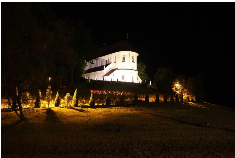
6.2.3. attēls. Svecītes baznīckalnā (Žeimunde, 2014)