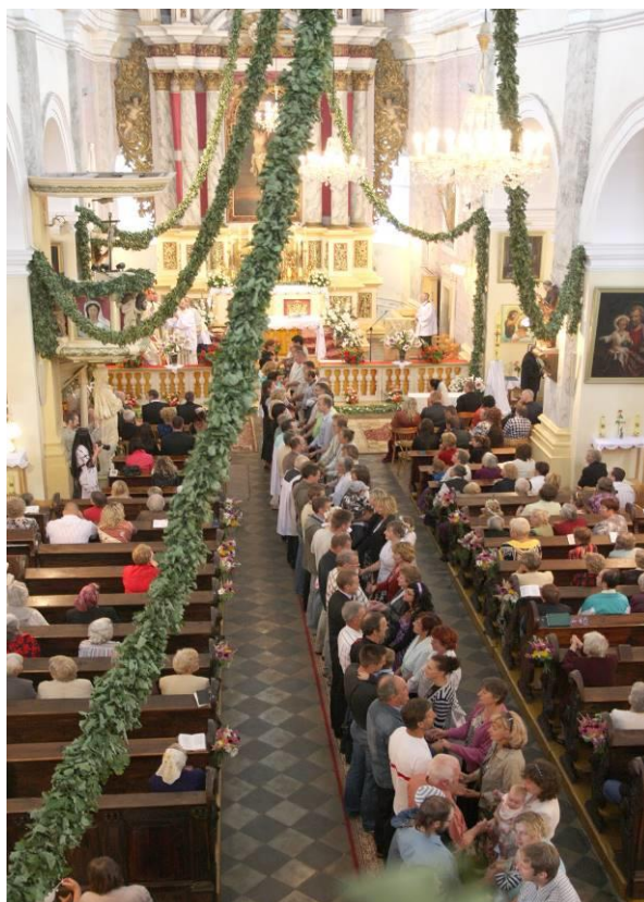
6.2.4. attēls. Laulāto svinīgā solījuma atjaunošana (Žeimunde, 2014)