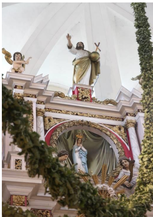
6.2.2. attēls. Kanepenes svētki. Vītņu piestirpināšana pie baznīcas griestiem (Žeimunde, 2009)