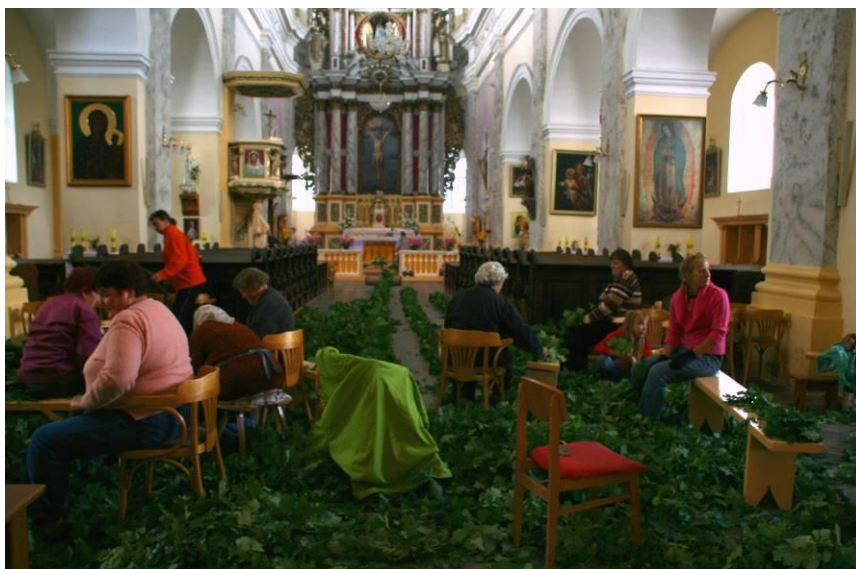
6.2.1. attēls. Vītņu pīšana pirms Kanepenes svētkiem (Žeimunde, 2007)

iepriekšējā vakara atvestajiem ozolzariem. Sievietes, kuras ir Skaistkalnes baznīcas draudzē, no ozollapām pina lielas virtenes (sk. 6.2.1. att.).