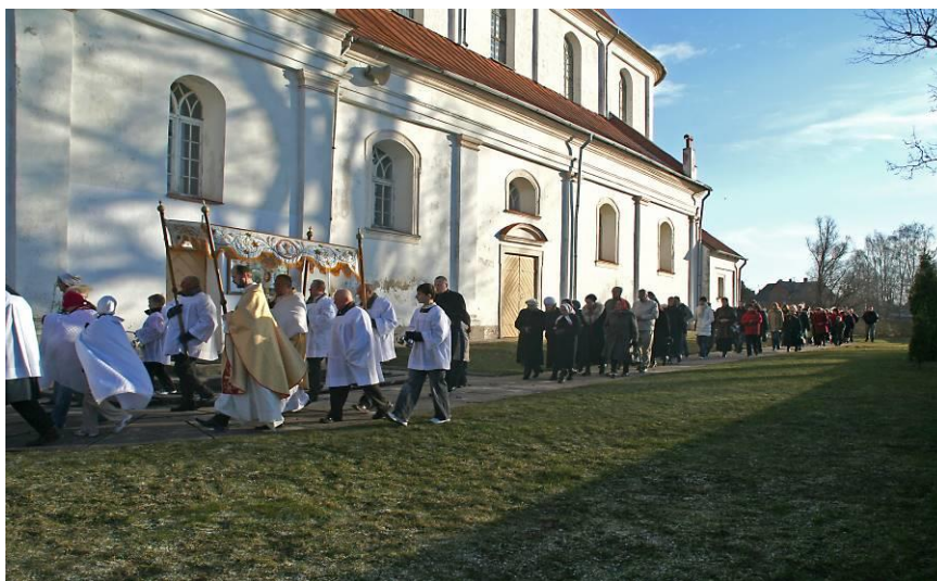
6.3. attēls. Liieldienas Skaistkalnes baznīcā (Žeimunde, 2007)

Sestdienā ir pirmais dievkalpojums Kristus augšāmcelšanās piemiņai. Kristus simbols ir Liieldienu svece, tāpēc vispirms tiek svētīta uguns, kur tiek aizdedzināta svece. Tiek vadīta procesija, kur šī svece tiek nestā, tad visi dodas baznīcā un iedez arī savas sveces. Tas ir kā ticības simbols Dieva žēlastībai. Notiek īpašs Liieldienu dziedājums, tiek lasīti izvilkumi no Svētajiem rakstiem. Šis ir ievads Misei. Savukārt Svētās Mises laikā notiek „Gloria” dziedājums, kuru intonē priesteris, tad ieskanas visi baznīcu zvani un ērģeles. Misē tiek svētīts ūdens un ticīgie atjauno kristības solījumus („Liturģiskais kalendārs”, 2014).