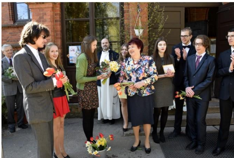
6.1.2. attēls. Absolventiem skan pēdējais zvans (Varnevičš, 2017)

Arī katrā izlaidumā un pēdējā zvanā (sk .6.1.2. att.).