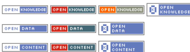
3.1. att. Informatīvas atvērto datu birkas

Apskatītie Latvijas datu avoti atklāj vairākas nepilnības, kas nākotnē noteikti būtu jānovērš. Tā piemēram, lai arī iestāde uztur datus bieži tos ir ļoti sarežģīti atrast. Dažās vietās bija nepieciešams sazināties arī ar iestādes darbiniekiem, kas palīdzēja atrast pieejamos datus. Šo problēmu noteikti būtu jāatrisina attīstot atvērto datu servisu. Kā vienkāršāks risinājums, ko jau piedāvā “OpenDefinition” organizācija ir informatīvas birkas 20 jeb pogas pievienošana tīmekļa vietnes kājēnē, kur pēc klikšķa uz pogas, lietotājs nonāk konkrētās iestādes atvērto datu publicēšanas vietā. Šādā veidā iespējams panākt ieinteresēto personu pietiekoši ātru informēšanu par saturā pieejamajiem atvērtajiem datiem. Pogas dizains ir standartizēts un tāpēc visās vietās tam būtu jābūt vizuāli vienādam. Pieejami arī dažādi citi birku veidi (skatīt 3.1 attēlu), kas informē lietotāju par atvērto datu saturu, kas iespējams nav tieši dati, bet gan kāds cita veida noderīgs saturs.