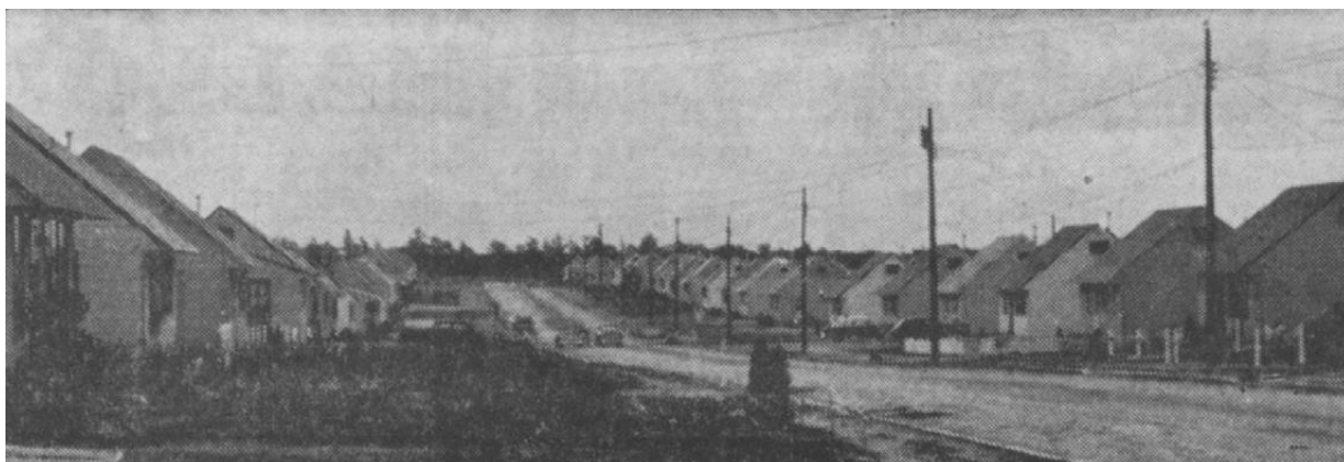
3.1. att. J. Rīsberga celto sērijveida ģimenes māju skats Aislipē, Longailendā 547