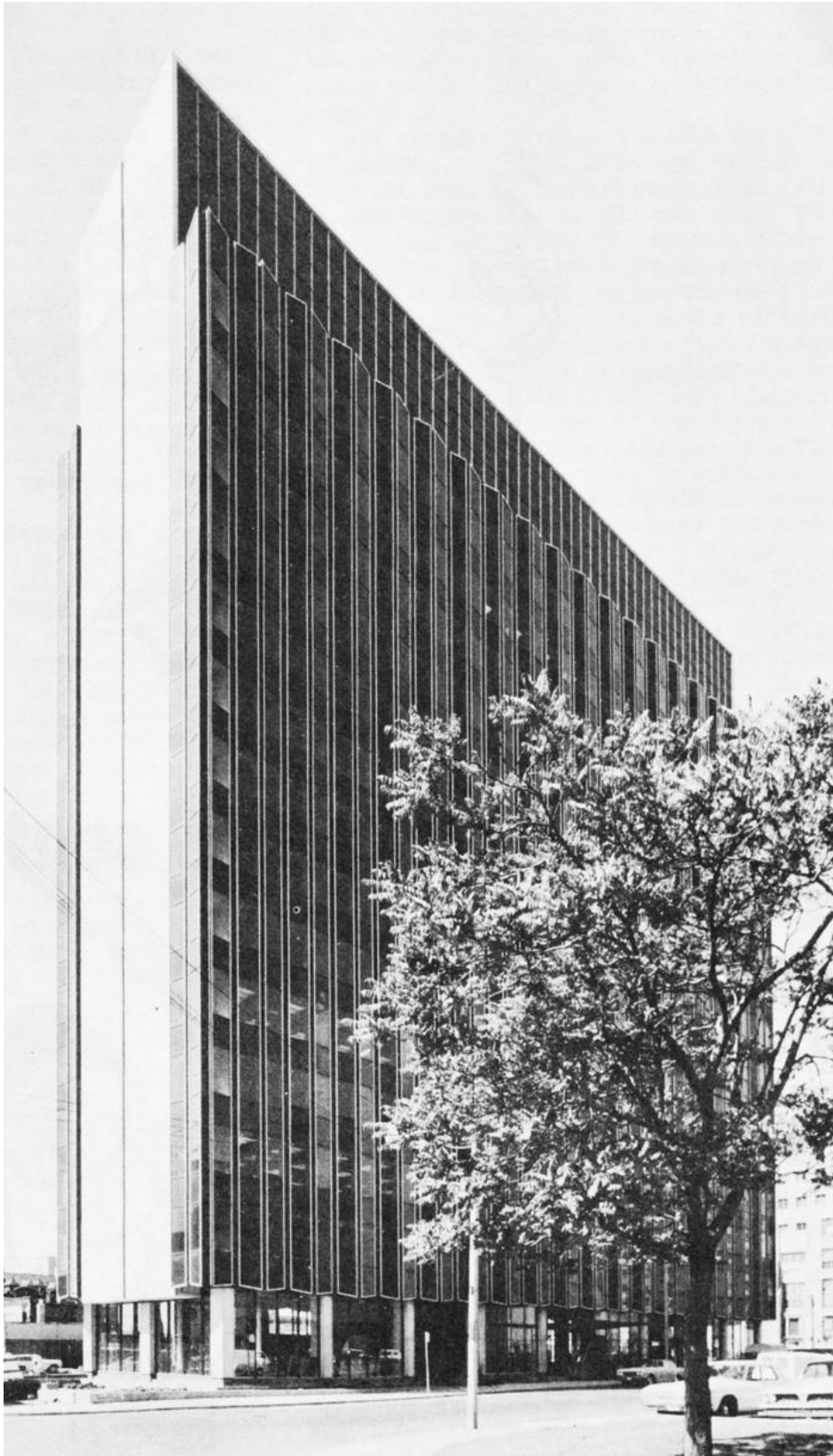
4.3.1. att. Pēc arhitekta E. Janiša projekta celtais Toronto Profesiju nams 549