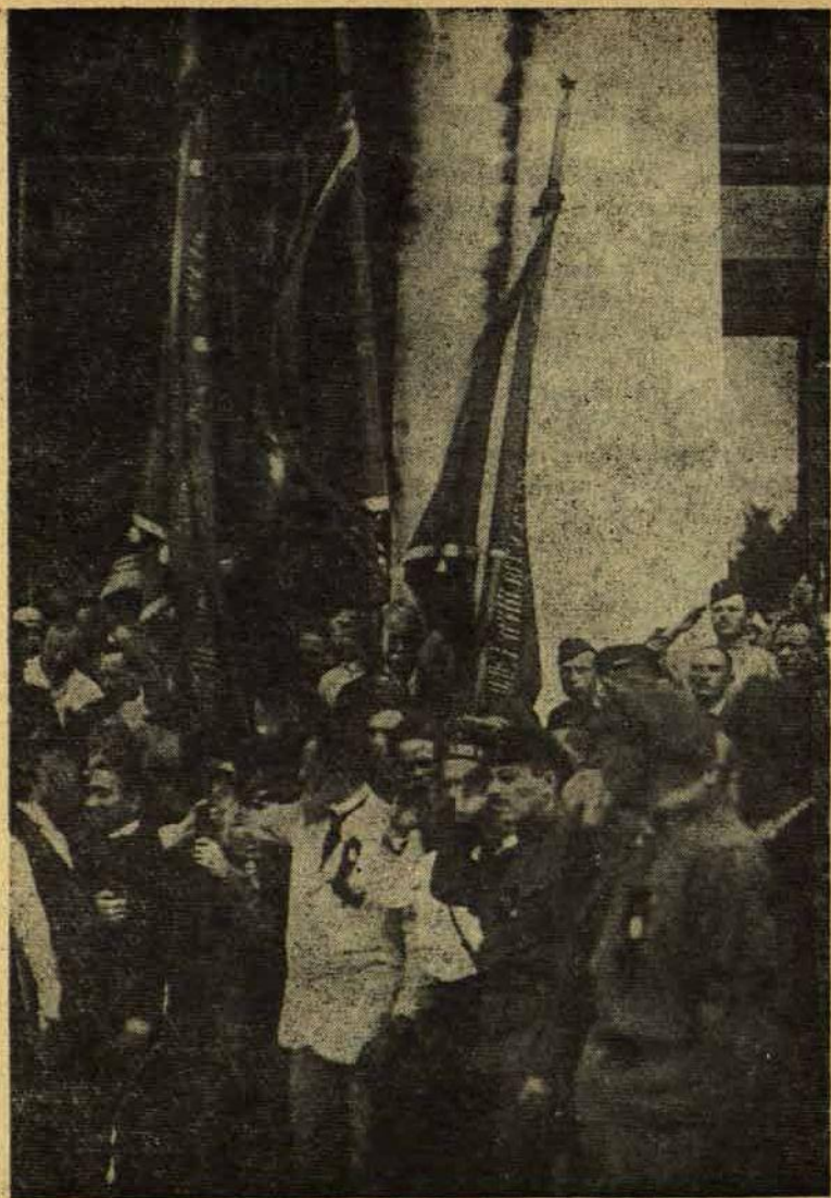
П. И. Стучка среди слушателей Коммунистического университета национальных меньшинств Запада им. Мархлевского.

Из фондов Государственного музея революции Латвийской ССР