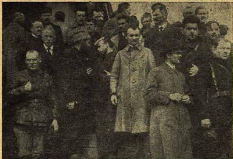
П. И. Стучка с группой членов Советского правительства Латвии в 1919 году.

Из фондов Государственного музея революции Латвийской ССР