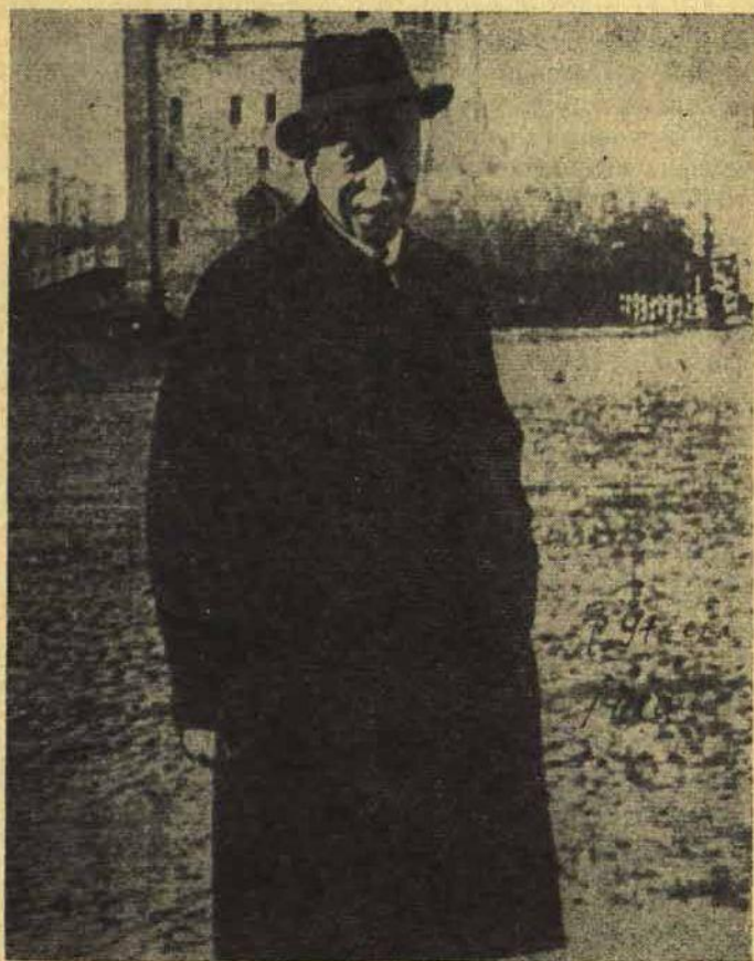
П. И. Стучка в 1918 году.

Из фондов Государственного музея революции Латвийской ССР