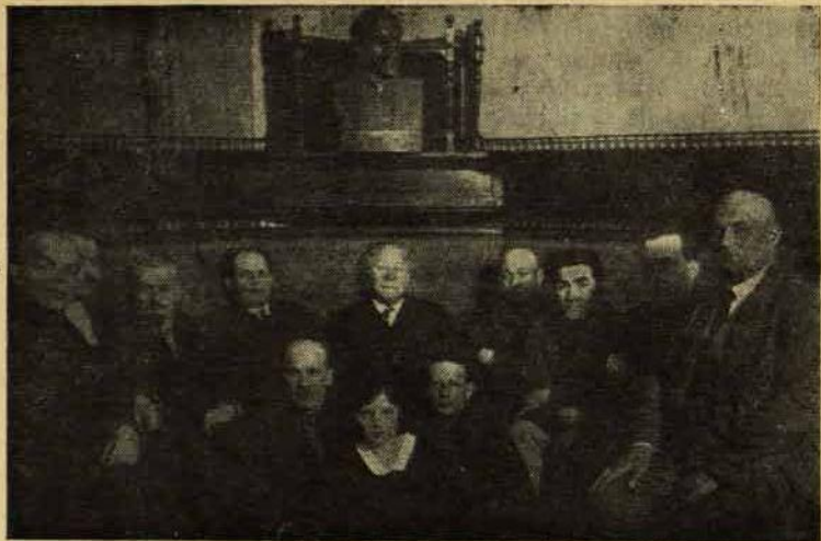
П. И. Стучка среди работников Верховного Суда РСФСР.

Из фондов Государственного музея революции Латвийской ССР