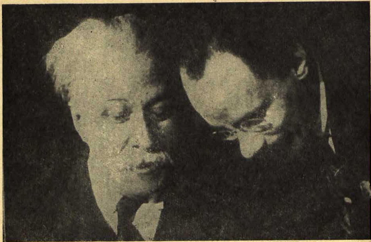
П. И. Стучка и В. П. Милютин.