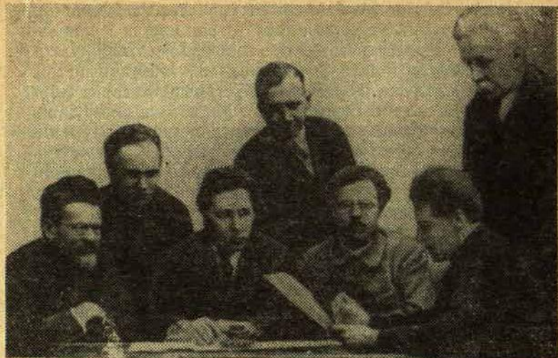
М. И. Калинин и П. И. Стучка среди членов временного Петроградского комитета РСДРП(б) в 1917 году.

24 мая 1917 года в газете «Правда» была опубликована статья «На почве закона или на почве революции?» , которую П. И. Стучка охарактеризовал как свою единственную революционную статью по правовым вопросам за весь период буржуазной революции 1917 года 3 . В этой статье П. И. Стучка выступил против