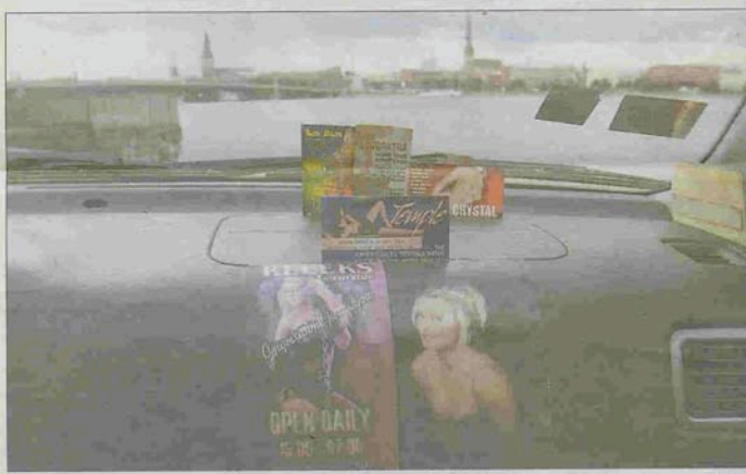
Taksometru vadītāji bieži pamanās no tūristiem „noplēst” krietni lielāku maksu par braucienu un piedāvā arī iegriezties kādā striptīzbārā. Un to nu Rīgā netrūkst!