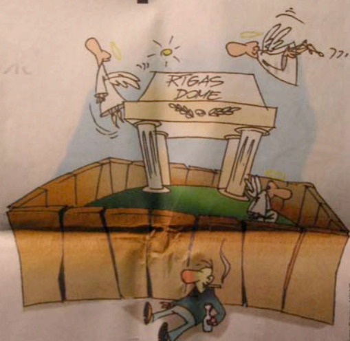
Ilustrācija: Dima V. 2006.

No nosauktās – var jau būt, ka nav slikti nedaudz piegriezt skābekli Vecrīgā pieaugošajai striptīzklubu invīzijai, taču kā tas izdarāms? Lai tikai definētu šādu lietu, domniekiem nāktos smagi papildēties. Kas ir erotiska vai pornogrāfiska rakstu-