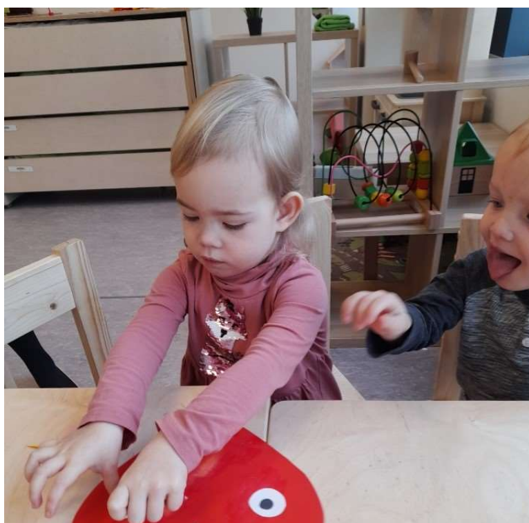
2.attēls. Bērns līmē masku.