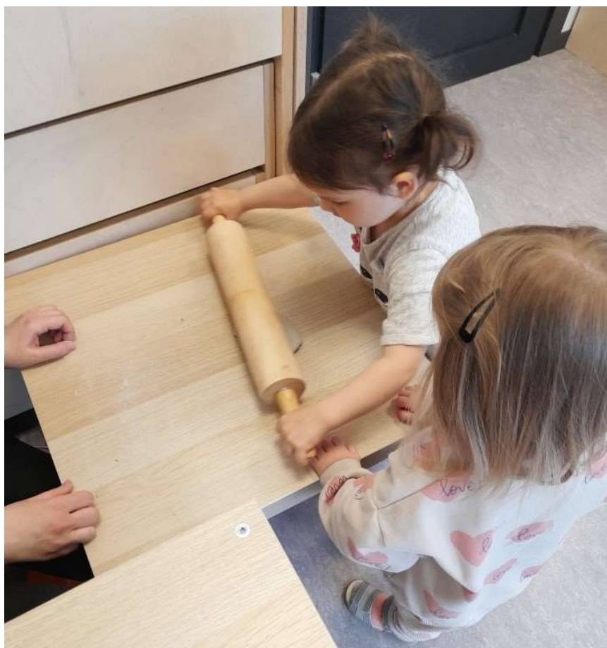
1.attēls. Bērns veltnē sāls mīklu.

neņem nost otram izvēlētos materiālus, tādā veidā parādot augsta līmeņa pazīmi visos kritērijos. Otra grupa tiek aicināta uz mākslas darbnīcu pagatavot sāls mīklu un ar interesi vēro notiekošo, tikai šajā grupā viens bērns sākumā nenāk klāt galdam ar sāls mīklu un sēž uz grīdas, tuvojoties audzinātājam sāk skriet pa telpu, tādā veidā bēgot no pieaugušā. Skolotāja piedāvā izvēlēties dabas materiālu, viņš to paņem un izlaiž no rokām. Pēc aicinājuma pacelt čiekuru, bērns nereaģē un skolotāja dodas pie pārējiem bērniem rullēt mīklu un izvēlēties dabas materiālu, kura nospiedumu atstāsim sāls mīklā. Ar bērniņu, kurš nevēlējās piedalīties nodarbībā pedagoga palīgs aprunājās un piedāvāja kopā ar viņu nākt pie galda un kopīgi izpildīt interesanto darbiņu un viņš piekrita. Arī šajā grupā bērni rāda augsta līmeņa pazīmi darboties grupā un labvēlīgi izturēties pret apkārtējiem. Tādejādi 9 bērni rāda augsta līmeņa pazīmi un vienmēr lieto kopīgu darba vietu un materiālus, kā arī labvēlīgi izturas pret citiem un 1 bērns rāda zema līmeņa pazīmi dažreiz labvēlīgi izturēties pret citiem un reti gaida savu kārtu un reti lieto kopīgu darba vietu un materiālus.