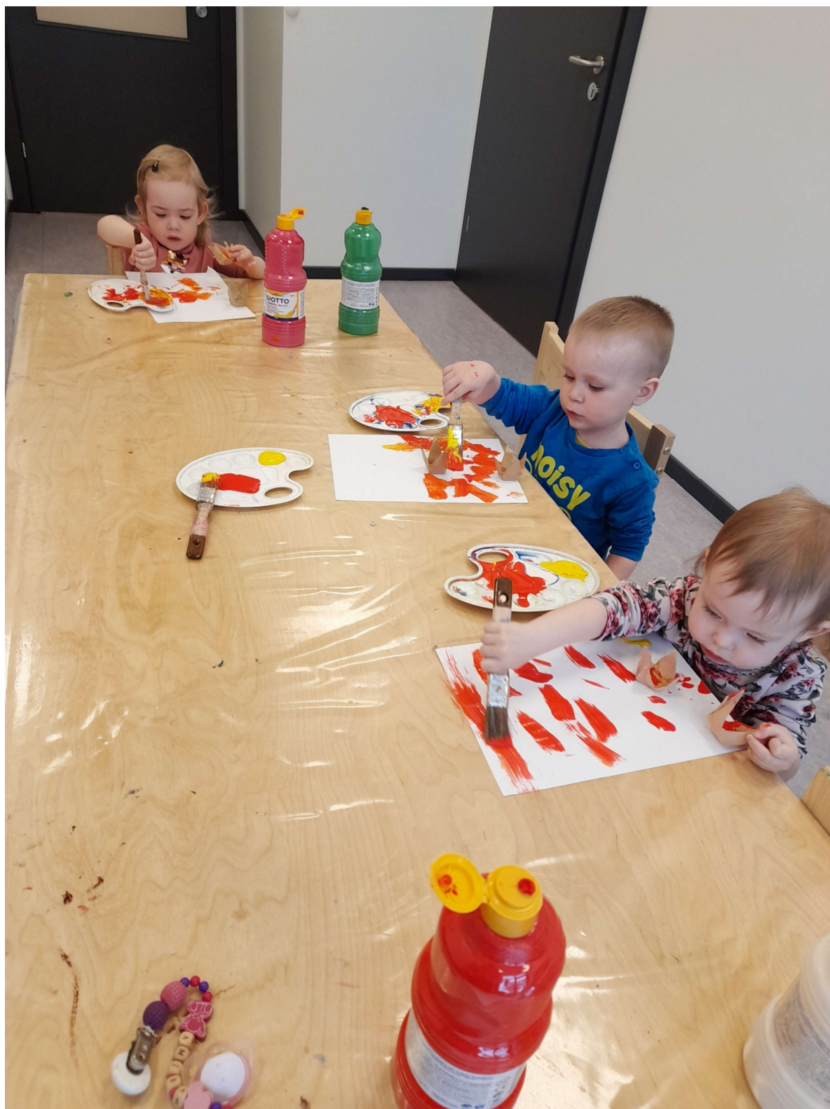
3.attēls. Bērni zīmē ar otām.

traktors kā redzamais aiz loga. Bērni nevēlas beigt darbu un tikai pēc aicinājuma doties ārā, bērni ir gatavi atstāt krāsas. Pēc šīs nodarbības varam secināt, ka 11 bērni rāda augsta līmeņa pazīmi lietot kopīgu darba vietu un materiālus, vienmēr gaida savu kārtu un labvēlīgi izturas pret citiem un 1 bērns parādīja zema līmeņa pazīmi, jo nevēlējās dalīties ar kopīgiem materiāliem un parādīja zema līmeņa pazīmi - reti labvēlīgi izturēties pret citiem.