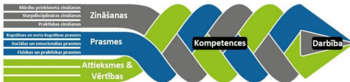
2.attēls OECD "Izglītība 2030" kompetenču ietvars (Oliņa, Namsone, France)

Lai labāk izprastu lietpratības pieejas un tai pakārtotās mācību vides maiņas nepieciešamību, darba autore aplūko OECD izstrādāto kompetenču ietvaru. Uzskaitītās mācību jomas, caurviju prasmes un tikumi jeb attieksmes savijas, tā veidojot nedalāmību, papildinot viens otru. Mācību procesā uzkrājot zināšanas, pilnveidojot caurviju prasmes gadu no gada, skolēnam tiek sekmēta lietpratība.