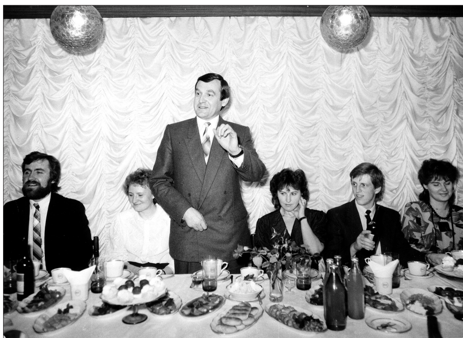
Informātikas pamatu un tehnisko mācīblīdzekļu katedras 5 gadu jubilejas svinībās 1991. gadā