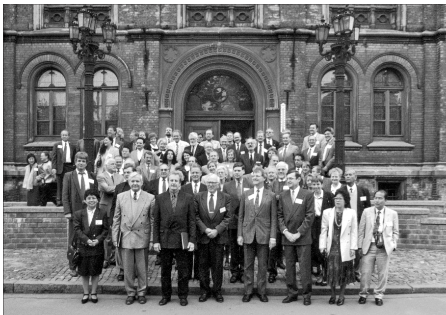
Kopā ar vairāk nekā 40 valstu pārstāvjiem Starptautiskās izglītības sasniegumu novērtēšanas asociācijas (IEA) 36. Ģenerālajā Asamblejā Rīgā 1995. gadā