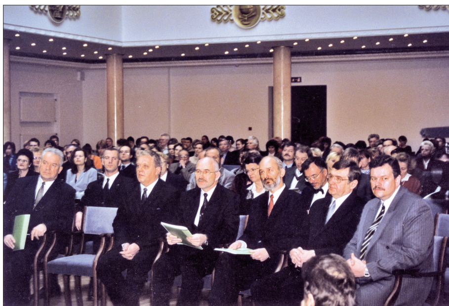
Kopā ar premjerministru A. Bērziņu, rektoru I. Lāci un kolēģiem IEA matemātikas un dabaszinātņu izglītības kvalitātes pētījuma (TIMSS) rezultātu paziņošanā 2000. gadā