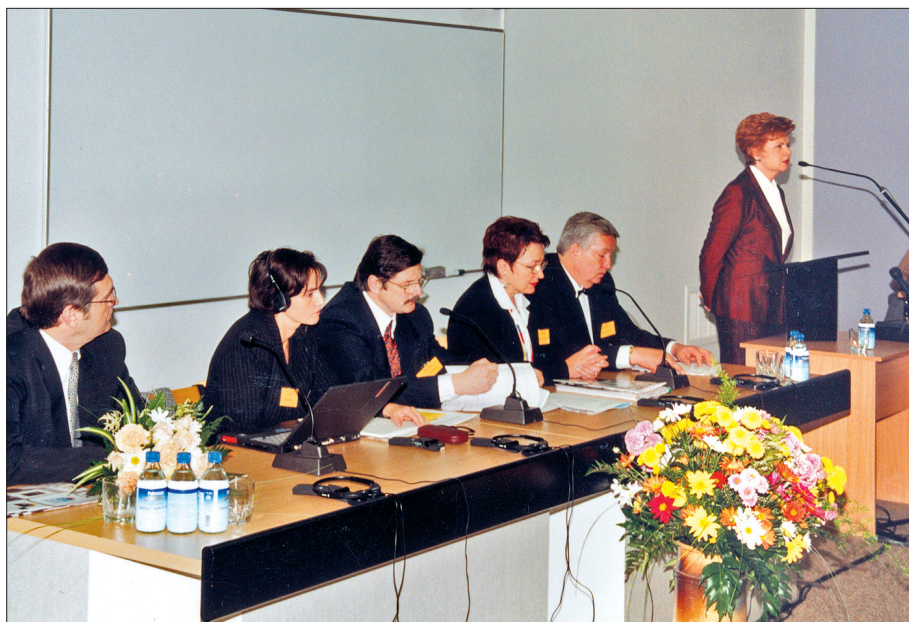
Valsts prezidente V. Vīķe-Freiberga konferences atklāšanā Pedagoģijas un psiholoģijas fakultātē