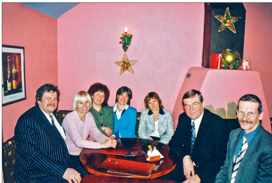
Kopā ar pētnieku grupu un ekspertiem pēc OECD Starptautiskās skolēnu sasniegumu novērtēšanas programmas rezultātu paziņošanas 2004. gadā