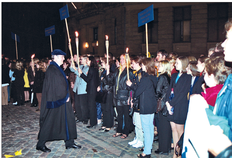
Aristoteļa svētkos ar fakultātes jaunajiem studentiem