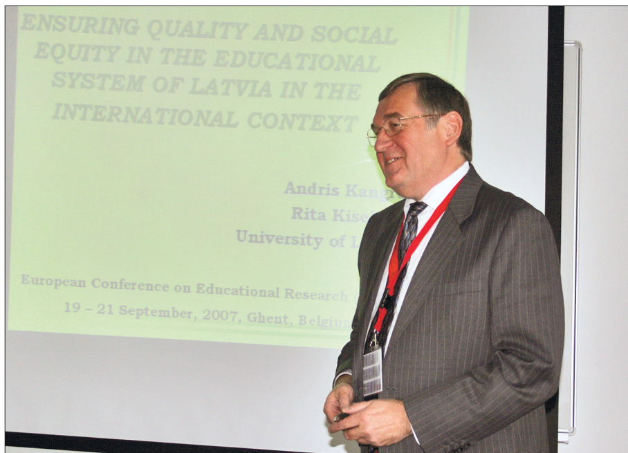
Uzstāšanās ar referātu Eiropas izglītības pētniecības asociācijas gadskārtējā konferencē Gentes universitātē Beļģijā, 2007. gadā