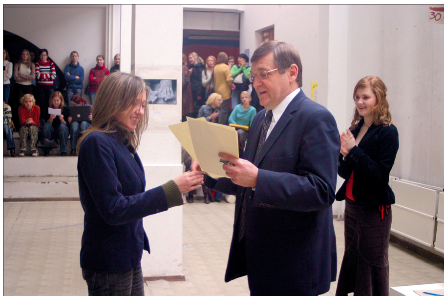
Sveicot studentu pašpārvaldes dalībniekus 2006. gadā