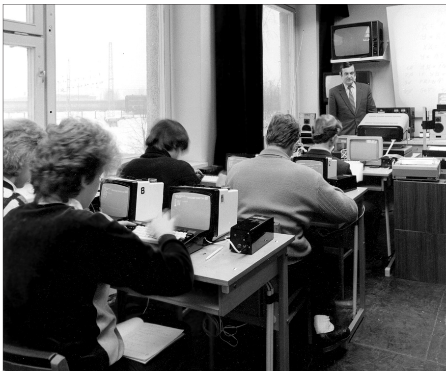
Nodarbībā ar studentiem 80. gados