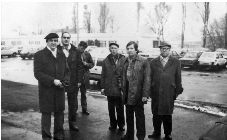
Kopā ar Latvijas Universitātes kolēģiem no delegācijas sadarbības līguma parakstīšanai ar Ščecinas universitāti Polijā 80. gados