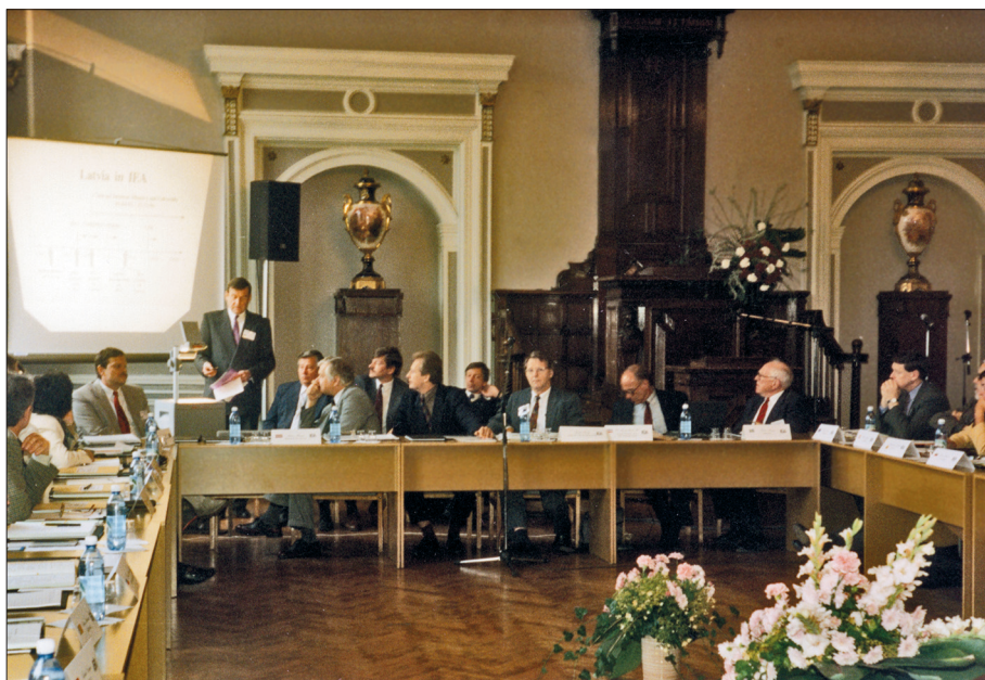
Uzstājoties Starptautiskās izglītības sasniegumu novērtēšanas asociācijas (IEA) 36. Ģenerālajā Asamblejā Rīgā 1995. gadā