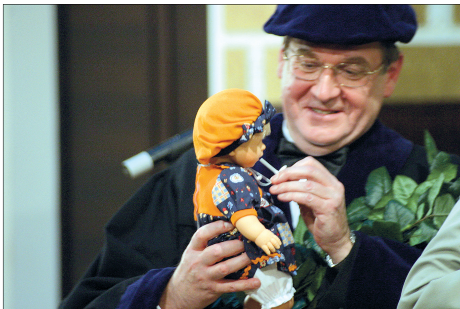
Prieks par dāvanu fakultātes jubilejā 2003. gadā