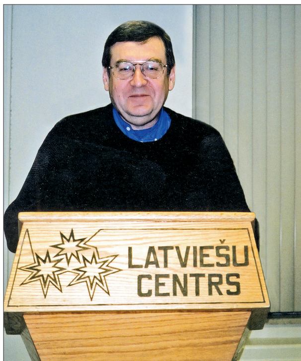
Uzstājoties Latviešu centrā Toronto 2001. gadā