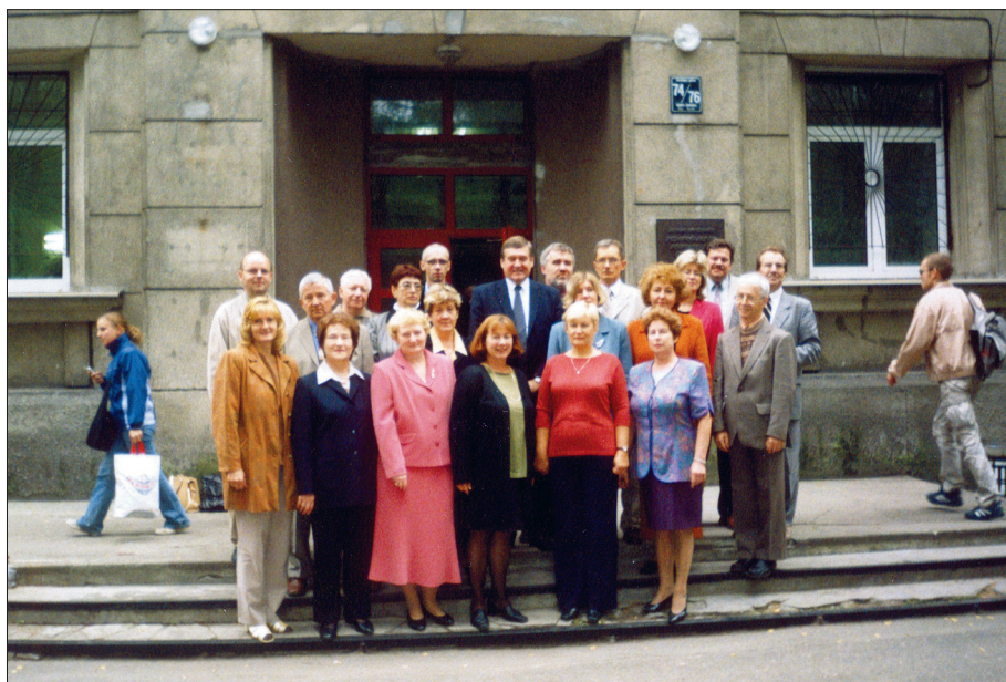
Kopā ar Pedagoģijas un psiholoģijas fakultātes profesoriem un asociētajiem profesoriem 2003. gadā