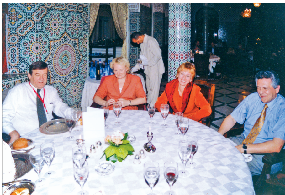
Kopā ar Slovērijas un Ungārijas pārstāvjiem Starptautiskās skolēnu sasniegumu novērtēšanas asociācijas (IEA) 43. Ģenerālajā Asamblejā Marakešā Marokā