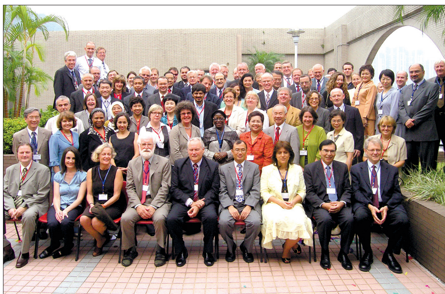
Kopā ar Starptautiskās skolēnu sasniegumu novērtēšanas asociācijas (IEA) 48. Ģenerālās Asamblejas dalībniekiem Honkongas universitātē 2007. gadā