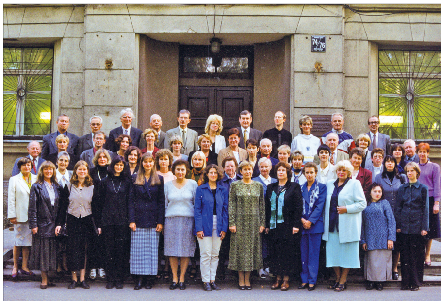
Kopā ar Pedagoģijas un psiholoģijas fakultātes kolēģiem