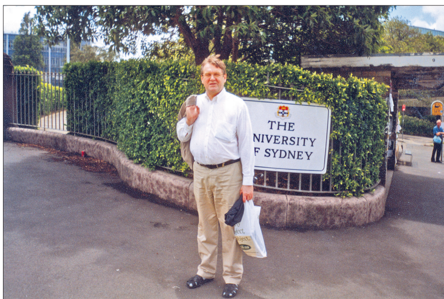
Ar tikko iegādātām grāmatām Sidnejas universitātē 2003. gadā