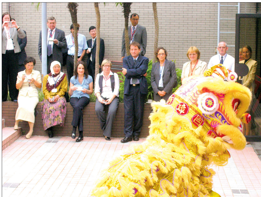
Vērojot Lauvas deju Starptautiskās skolēnu sasniegumu novērtēšanas asociācijas (IEA) 48. Ģenerālās Asamblejas sēžu starpbrīdī Honkongas universitātē 2007. gadā