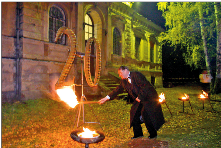
Zīmes aizdegšana fakultātes 20 gadu jubilejas svinībās 2003. gadā