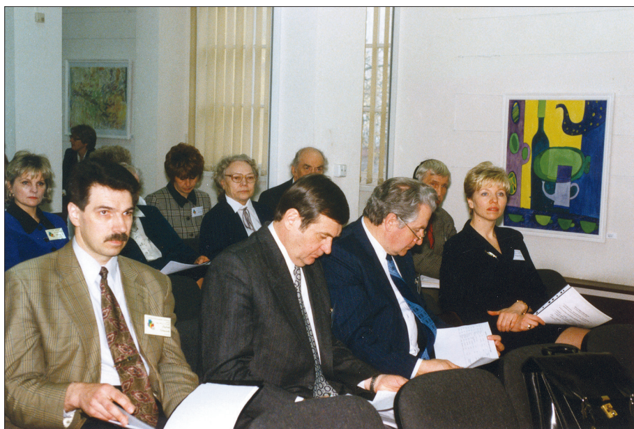
Darbs konferencē Rīgā