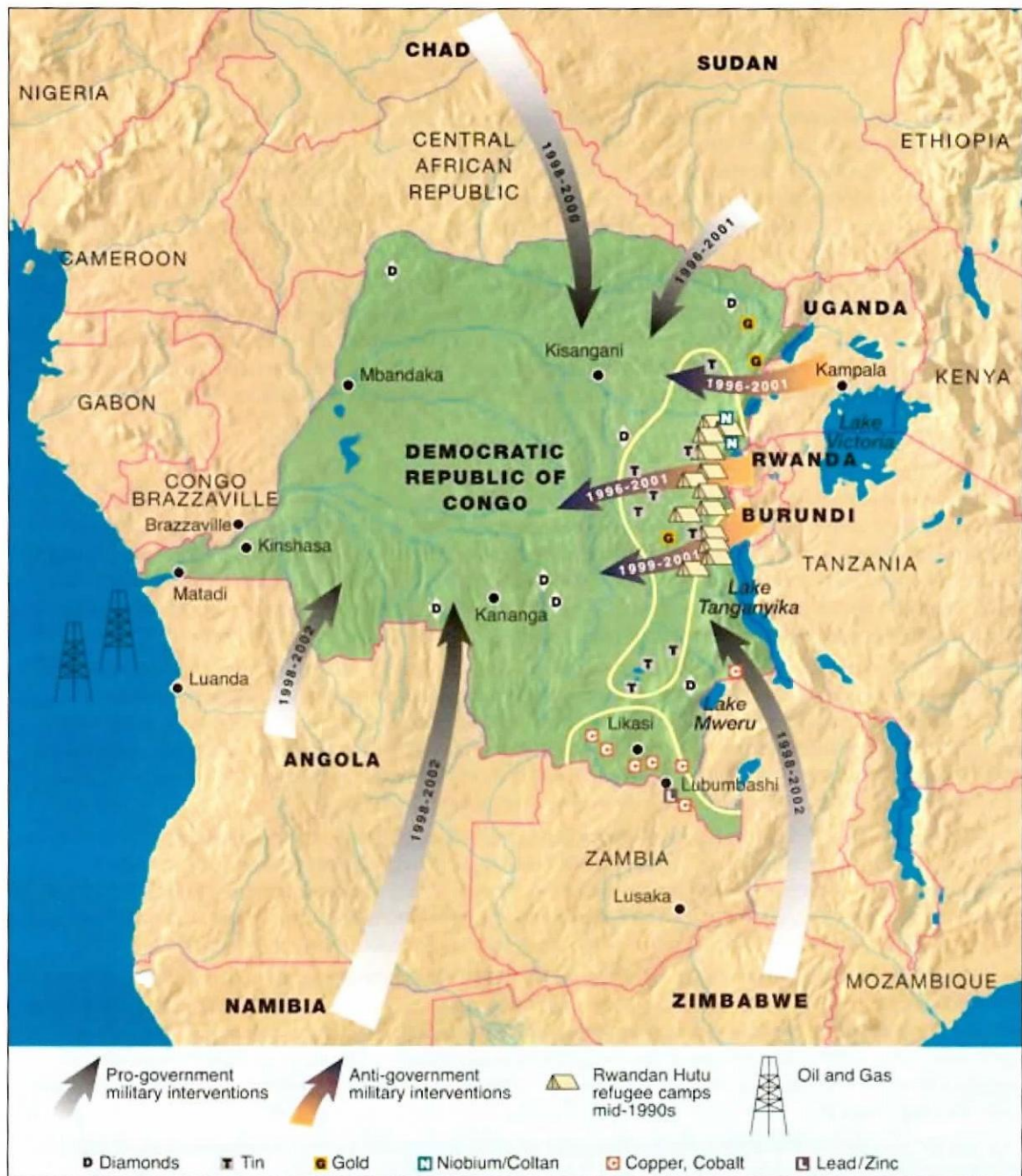
Map 3: Regional actors in the Second Congo War