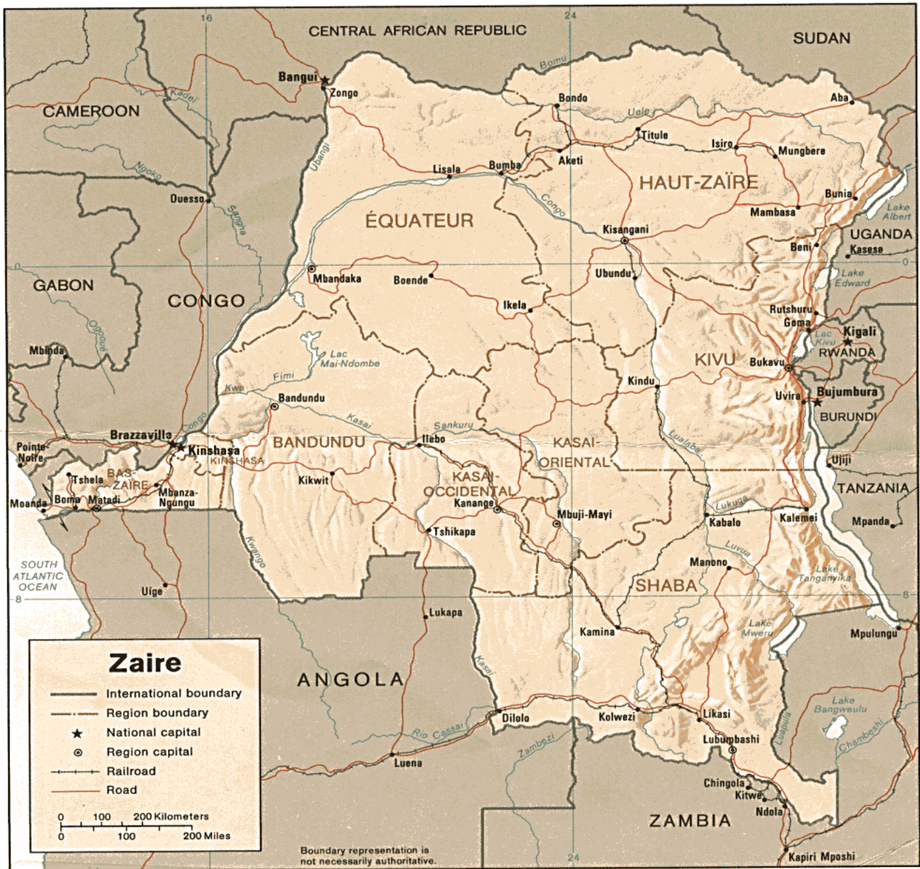
Base 505276 (A00820) 1-83