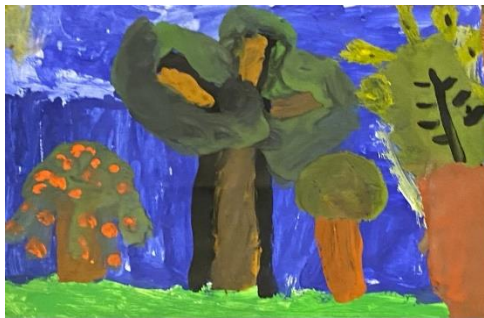
9. Attēls. Katrīna, 5 gadi