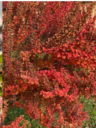
5. un 6. Attēls. Elīza. 5 gadi. Bārbele.