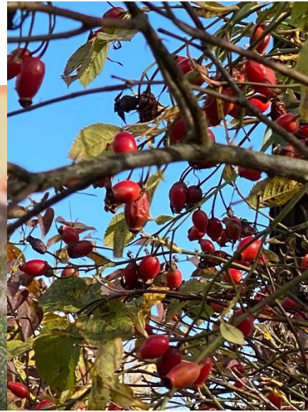
3. un 4. Attēls. Artūrs. 5 gadi. Mežrozīšu krūms