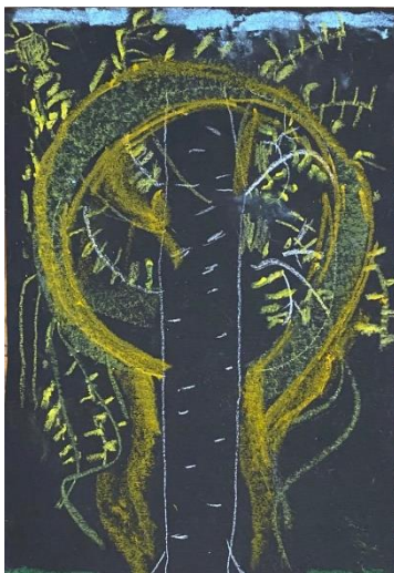
7. Attēls. Uvis, 5 gadi

Darba atmosfēra bija iedvesmojoša un pacilājoša. Pēc tam rīkojām darba izstādi, un katrs bērns pastāstīja par savu darbu, mēģinot stāstījumā iekļaut jaunus vārdus.