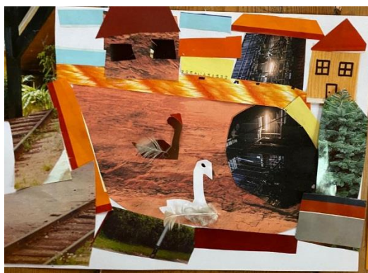
3. Attēls. Artūrs, 5 gadi