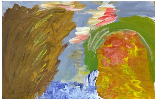
10. Attēls. Marta, 5 gadi