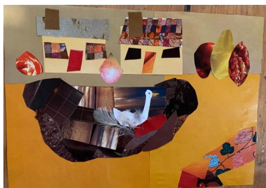
2. Attēls. Karlīna, 5 gadi

Šis darbs sagādāja bērniem grūtības, visiem gandrīz bija vajadzīgs papildus laiks, lai varētu pabeigt darbu. Visvairāk viņiem patika veidot putnus. Beigās klausījāmie dziesmu ‘ Astoņi kustoņi ’ un nolēmām šo dziesmu iemācīties. Pedagoģs apsollīja bērniem parādīt multfilmu ‘ Astoņi kustoņi ’.