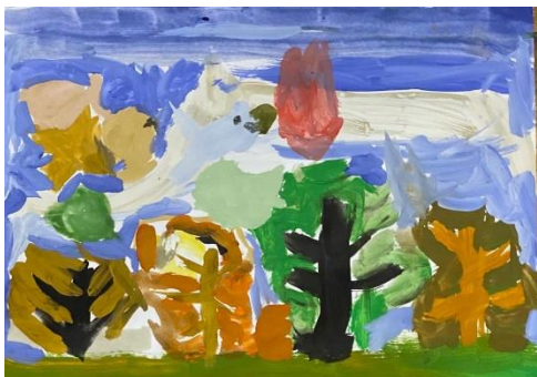
11. Attēls. Markuss, 5 gadi