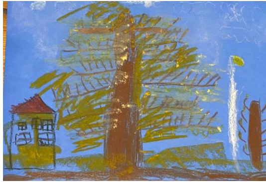
8. Attēls. Tomass, 5 gadi