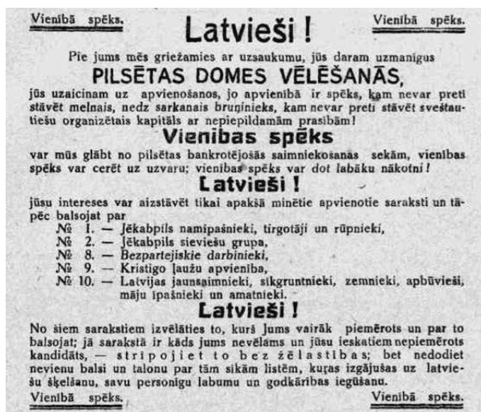
3.2.2. att. Uzsaukums latviešu vēlētājiem 1931.gada Jēkabpils pilsētas domes vēlēšanās 864