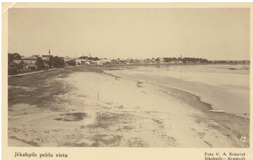
4.1.11.att. Jēkabpils pilsētas peldvieta 20. gs. 30. gadi (Pieejams: http://www.zudusilatvija.lv/objects/object/35316/ )