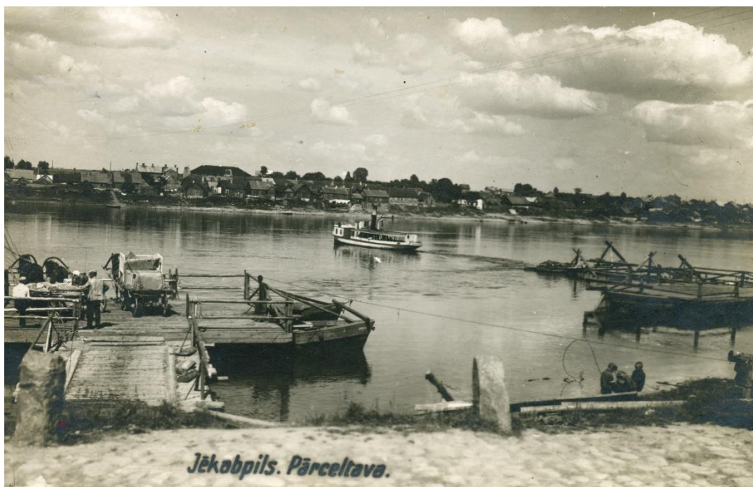
4.2.2. att. Jēkabpils pārceltuve un tvaikonis „Gulbis”