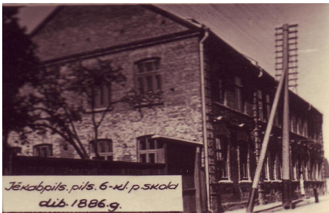
4.1.4.att. Jēkabpils pilsētas 6.klašu pamatskola (Jēkabpils Vēstures muzeja arhīvs)