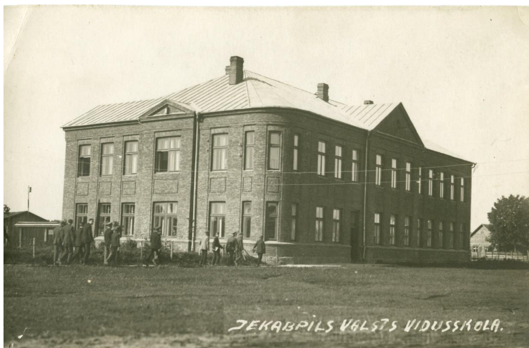
4.1.7.att. Jēkabpils Valsts vidusskola