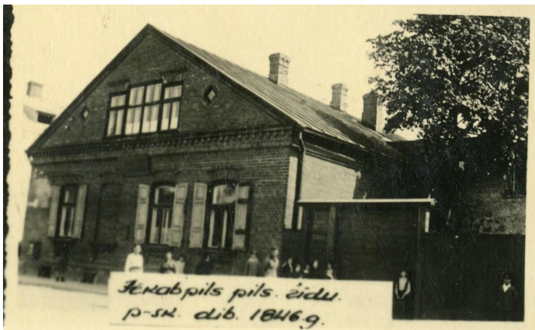
4.1.5.att. Jēkabpils pilsētas ebreju pamatskola