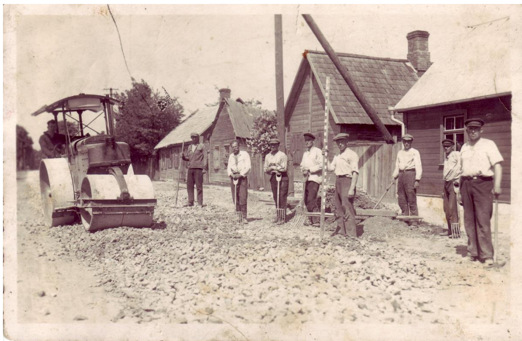
4.2.1. att. Jēkabpils ielu bruģēšana 20. gs. 20. gadi