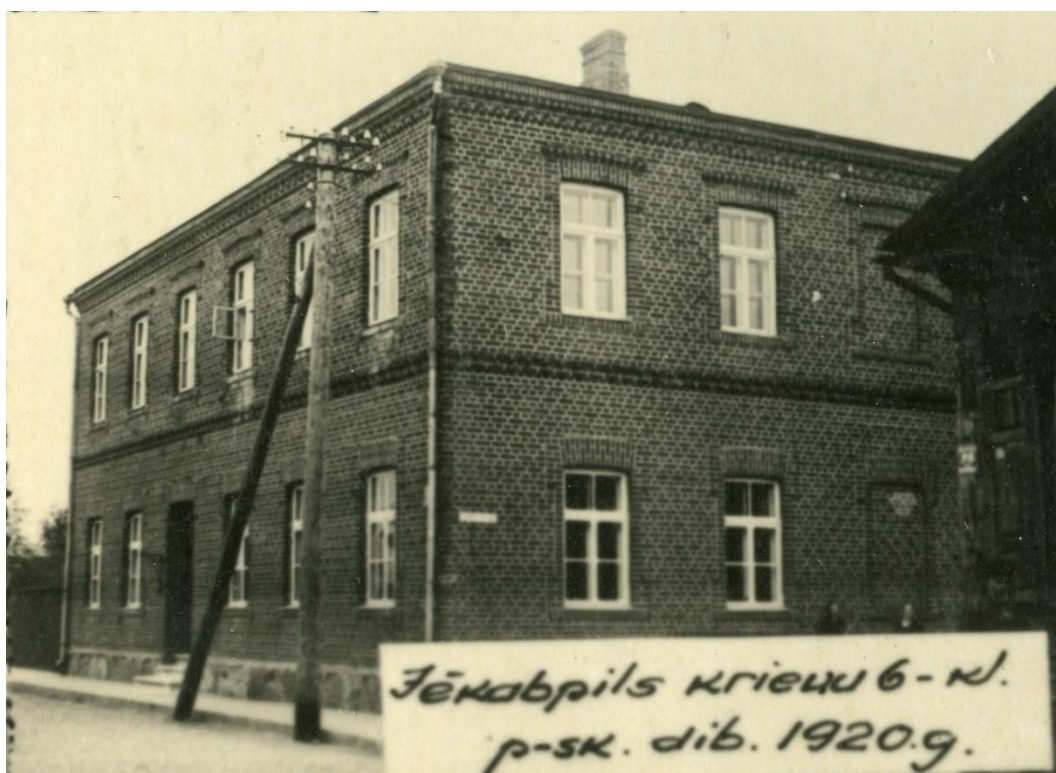
4.1.6.att. Jēkabpils pilsētas krievu pamatskola