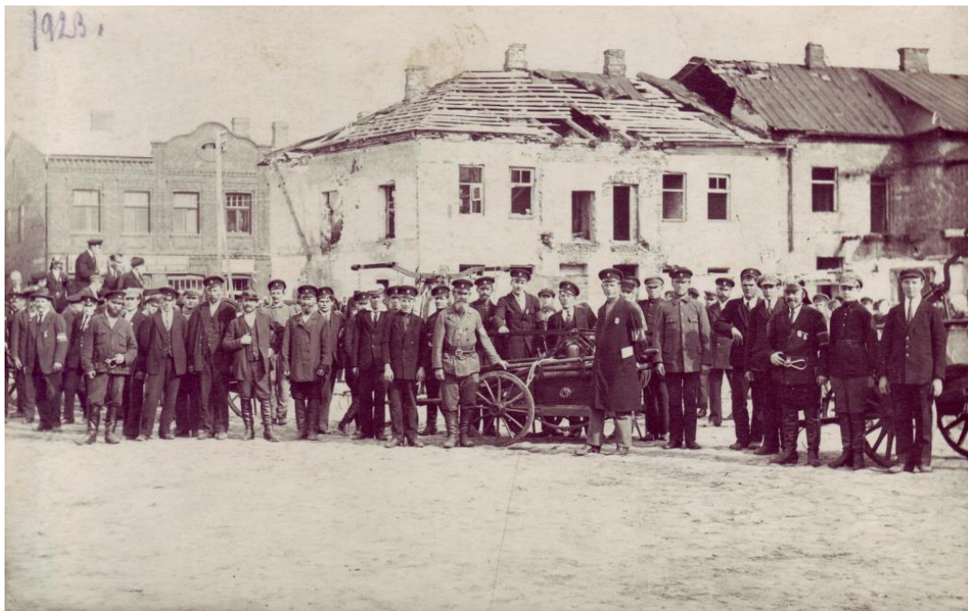
4.1.2.att Jēkabpils Brīvprātīgie ugunsdzēsēji 1923.gads