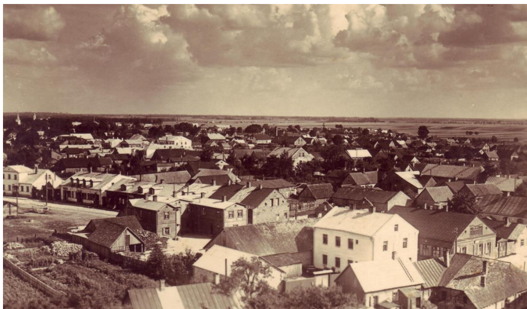
2.1.att. Skats uz Jēkabpili no putna lidojuma 20. gs. 30. gadi