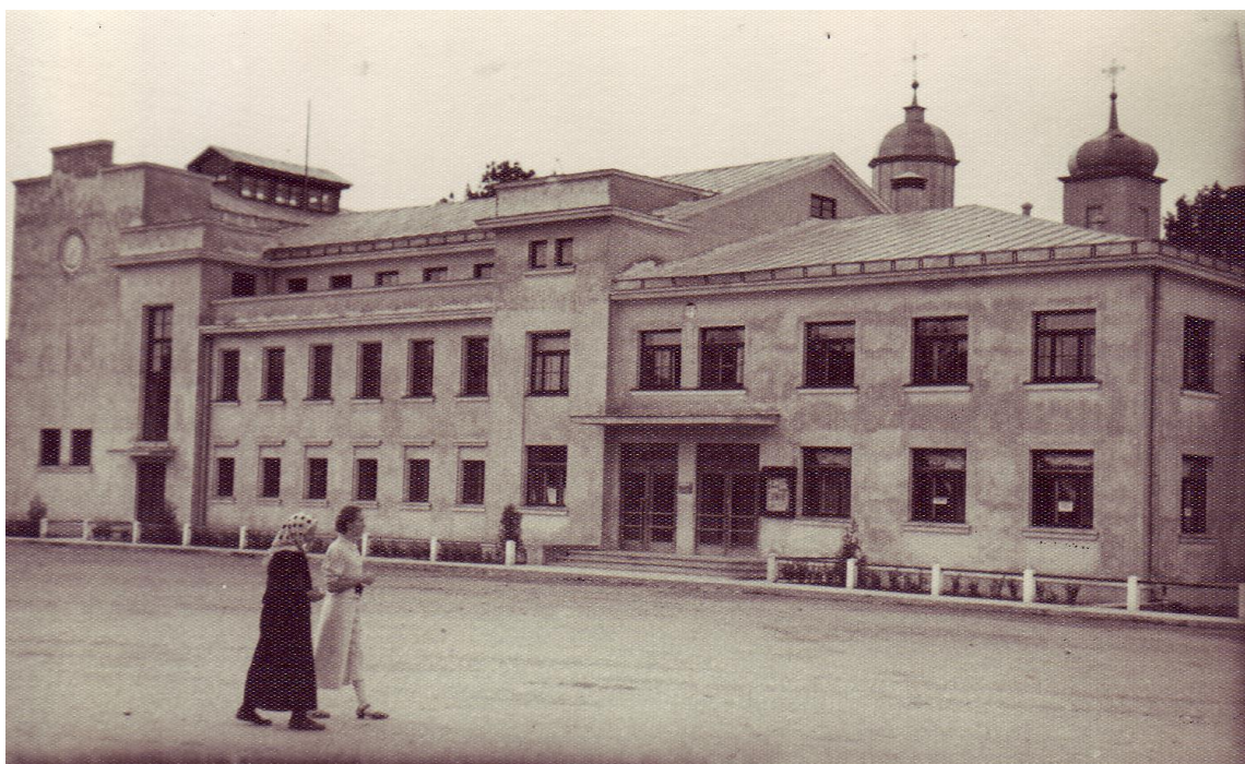
4.1.9. att. Aizsargu nams 20. gs. 30. gadu beigās