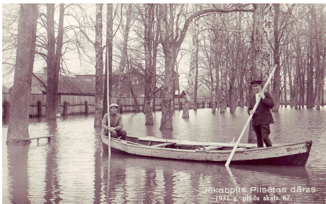
4.1.3.att. Jēkabpils Pilsētas dārzs 1931.gada plūdos