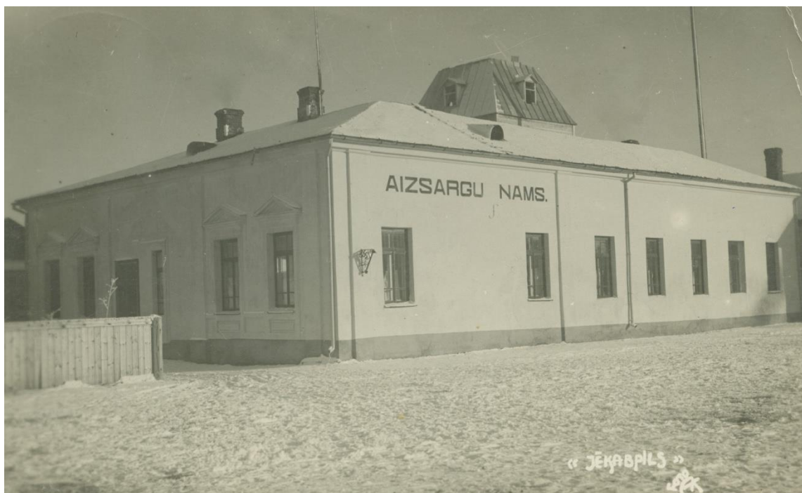
4.1.8. att. Jēkabpils Aizsargu nams 20.gs. 30.gadu sākums