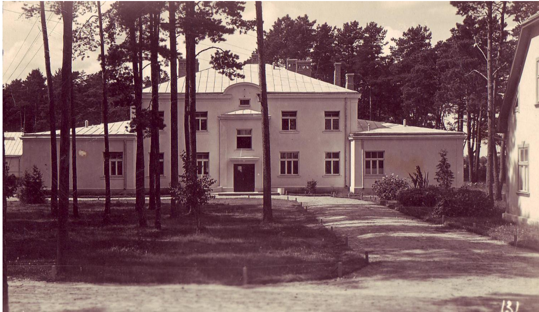
4.1.1. att. Jēkabpils apriņķa slimnīcas jaunais korpuss 1937.gads