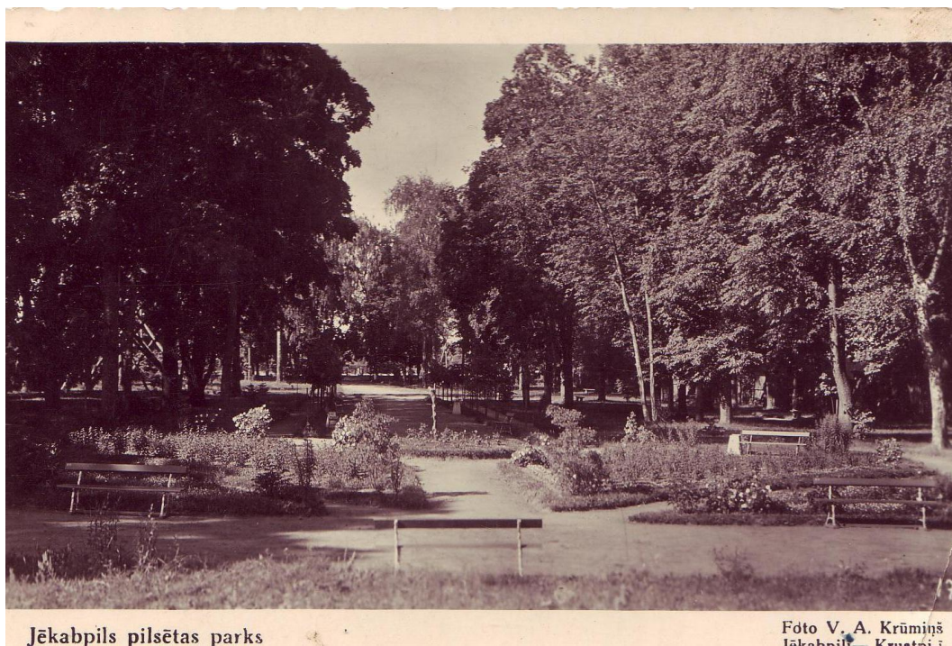
4.1.10. att. Jēkabpils pilsētas parks 30.gadu sākumā