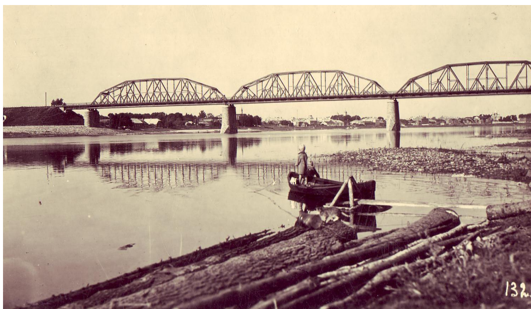
4.2.3. att. Tilts pār Daugavu 1936.gads