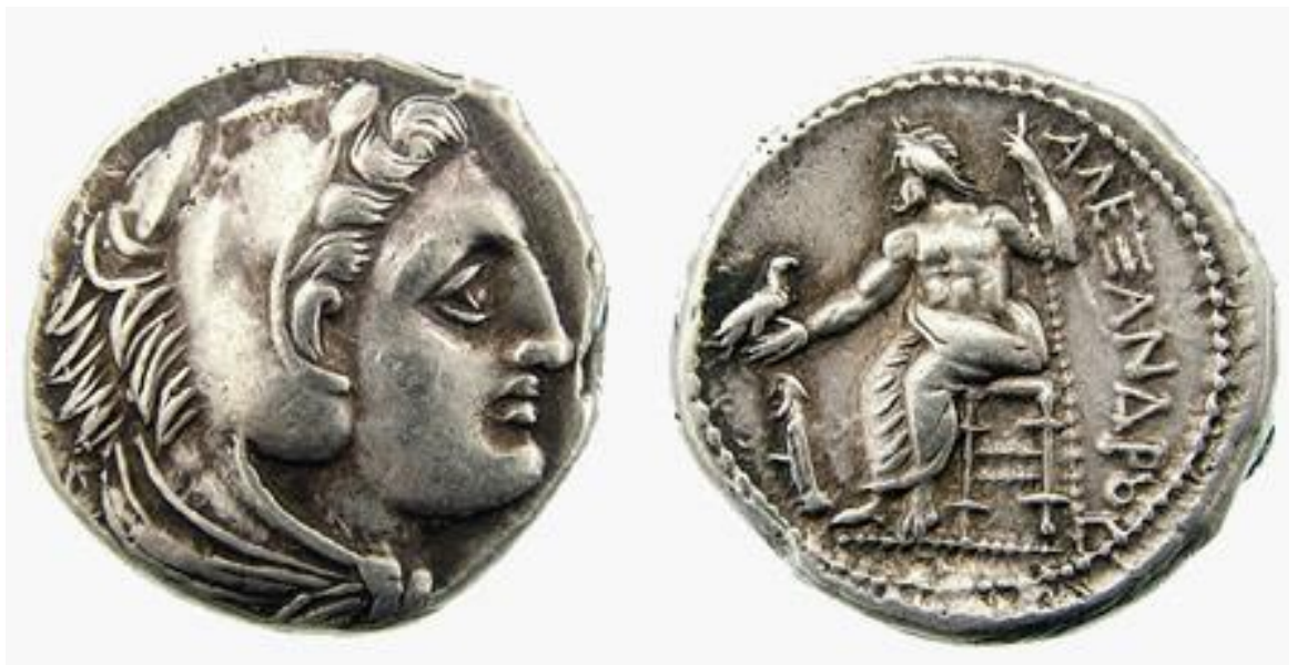
6. attēls. Aleksandra Lielā dzīves laikā izdota monēta. Aversā redzams Hērakls, kurš esot bijis Aleksandra Lielā priekštecis, un reversā – Zevs, kuram blakus rakstīts “Aleksandrs”.