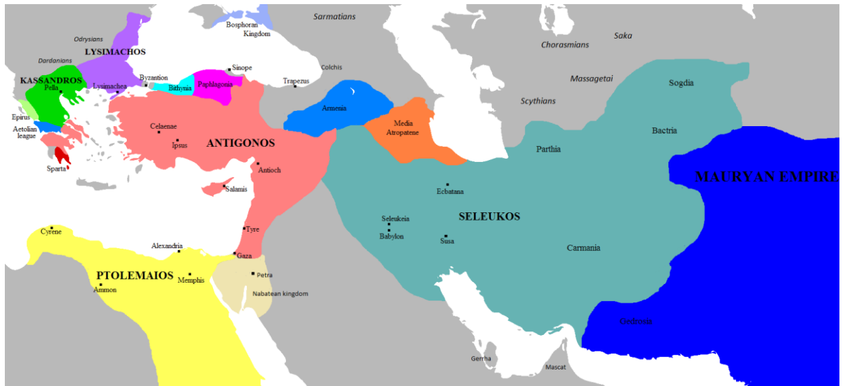
3. attēls. Diadohu valstis brīdī, kad tie sāka sevi pasludināt par valdniekiem.