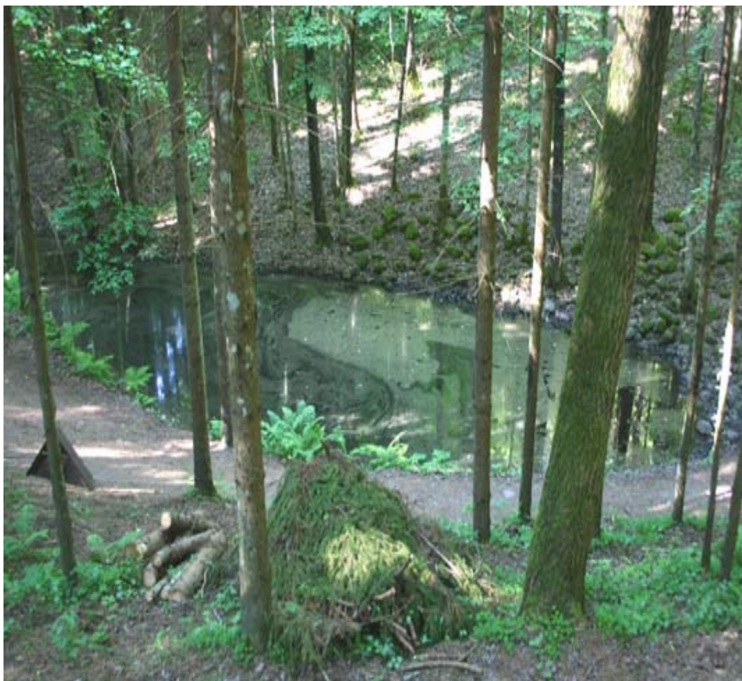
1.7.att. Pokaiņu svētvietas taciņa (45)