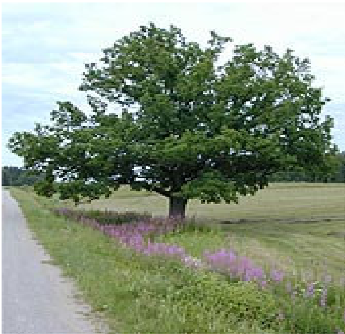
1.8. att. Dziednieciskais koks – ozols (46)