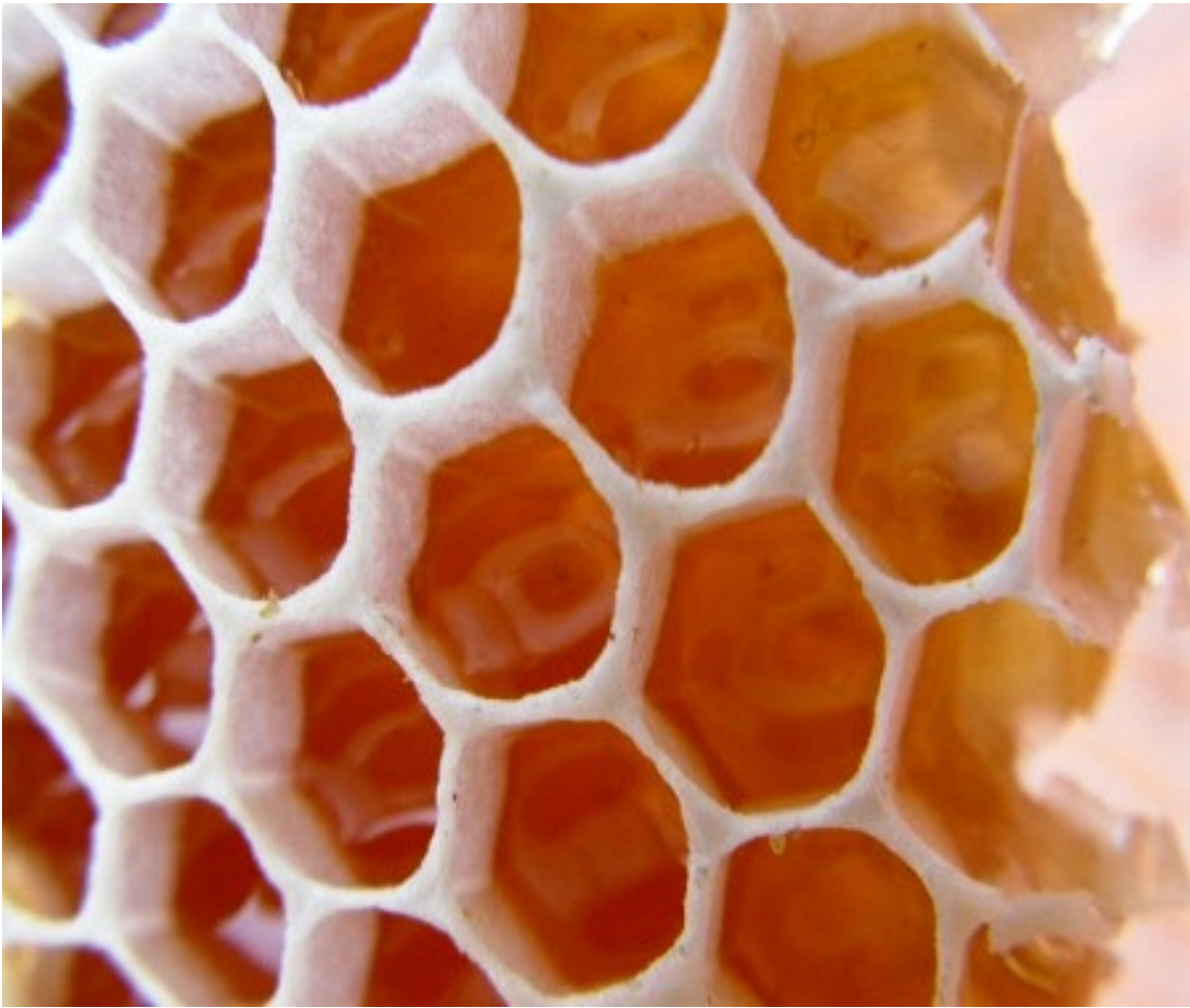
1.9. att. Medus (47)