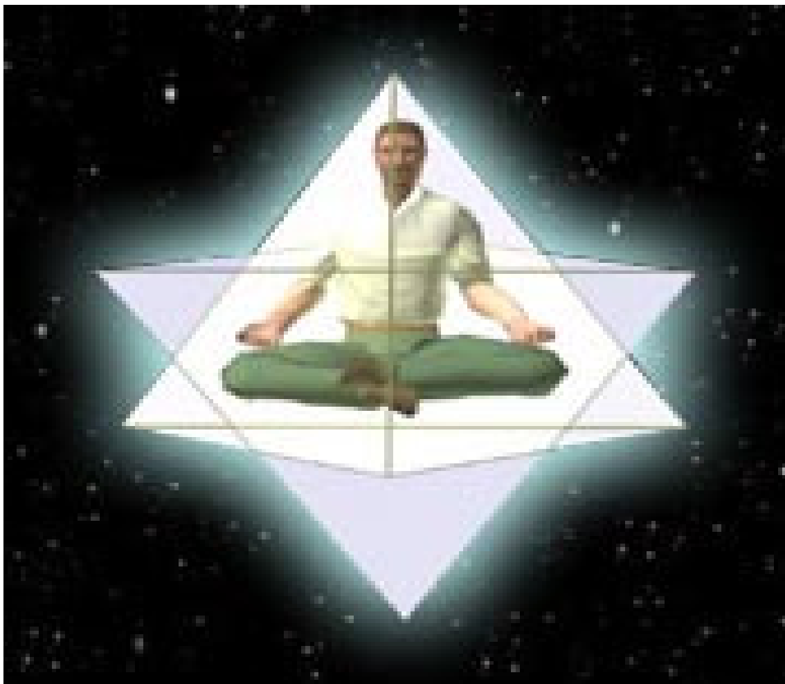
1.11. att. Meditācijas rituāls (49)