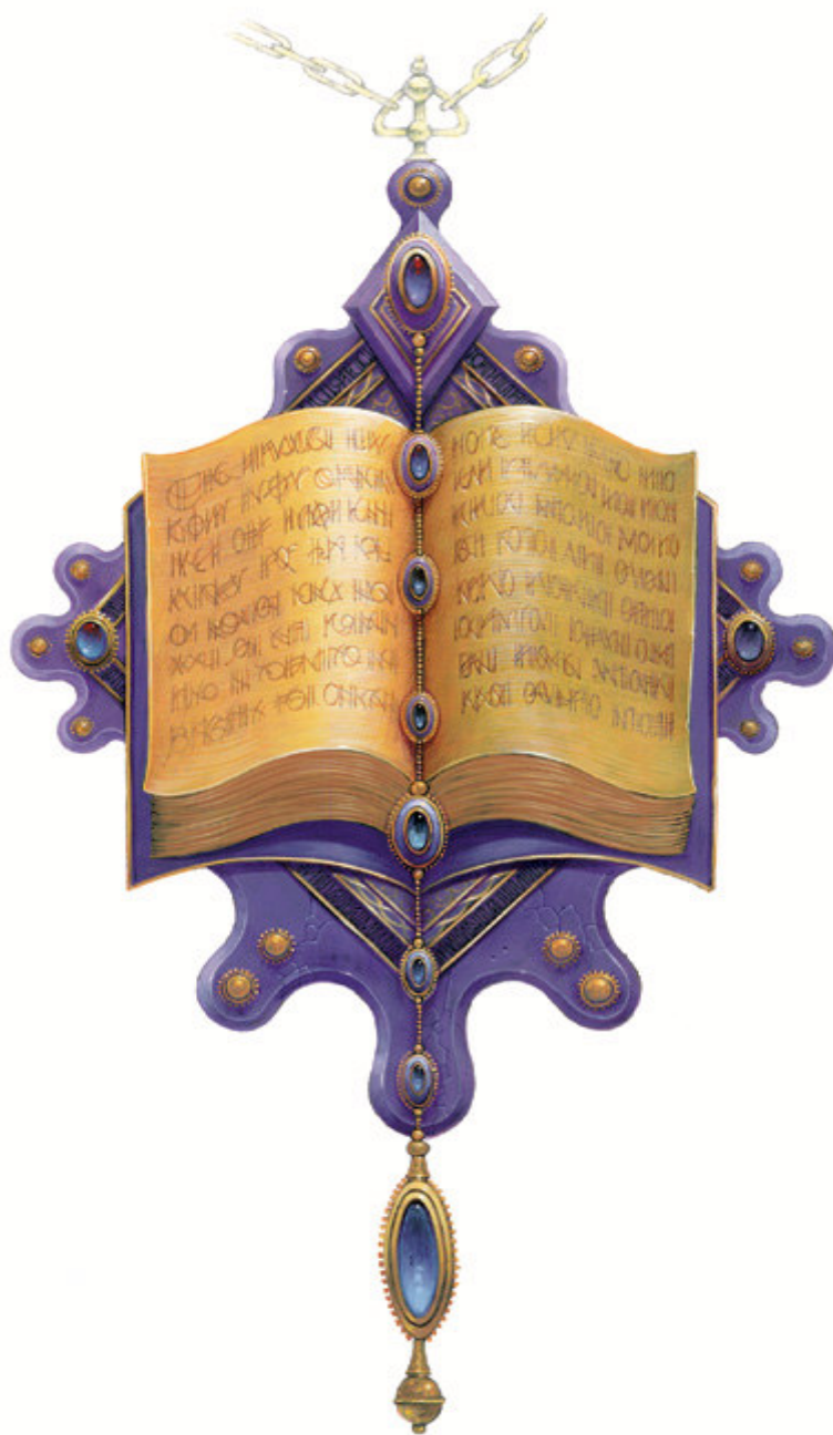
1.6. att. Buramie vārdiņi (44)