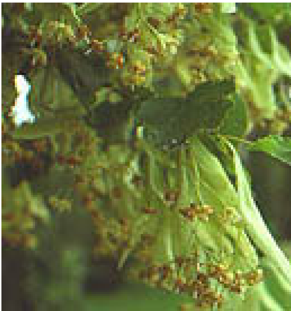
1.10. att. Homeopātijas pamatprodukts – liepu ziedi (48)