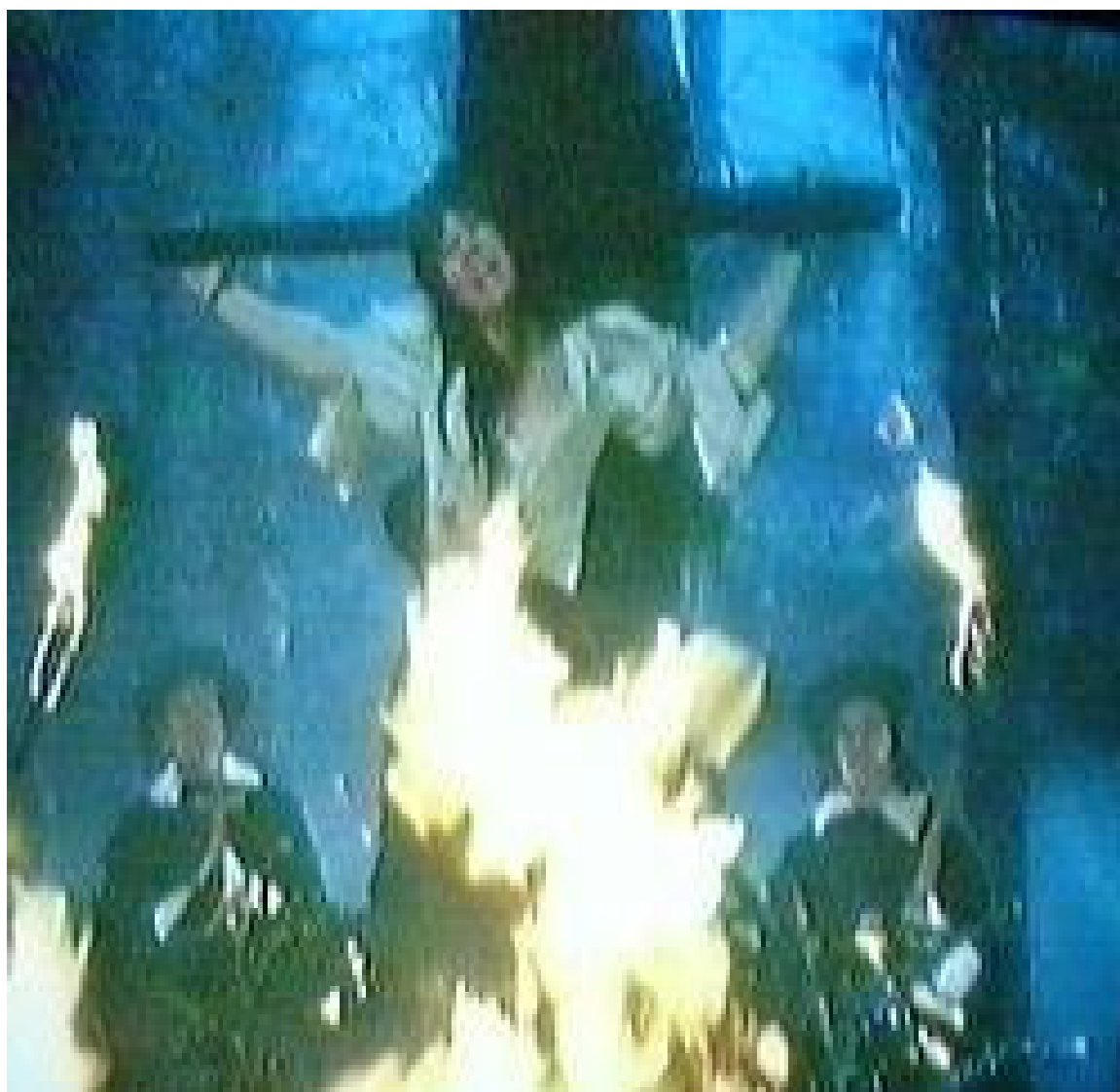
1.2. att. Raganu tiesa (39)