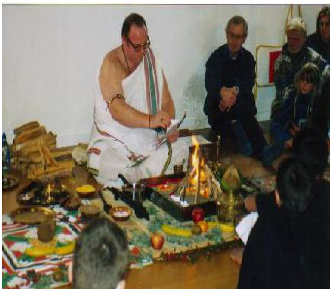
1.3. att. Dziedniecibas metode (41)