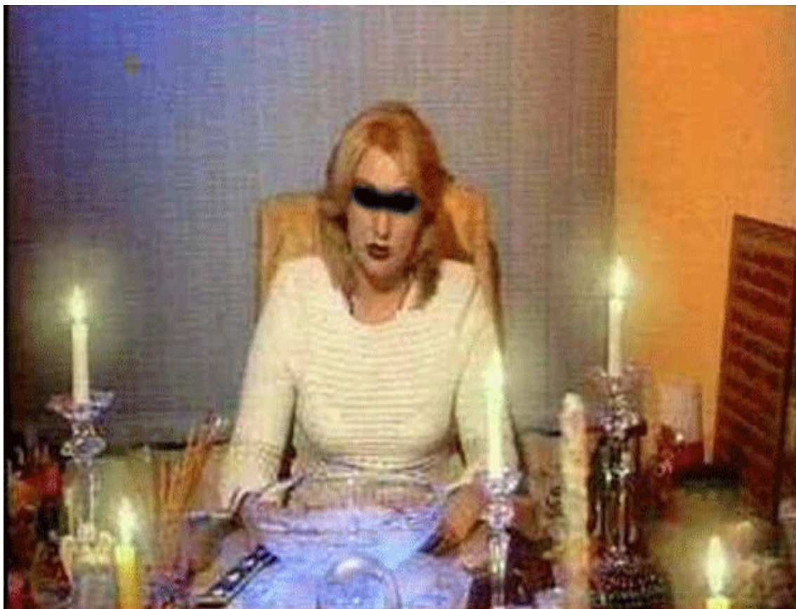
1.4. att. Dziednieka darba vieta (42)