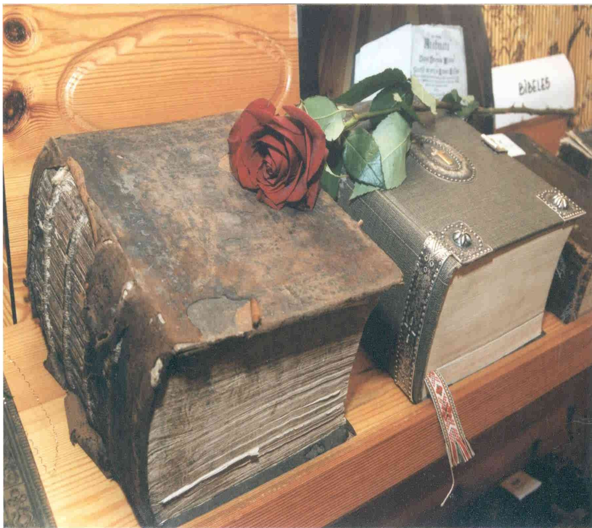
1.2.1.att. Debesu grāmatas (40)