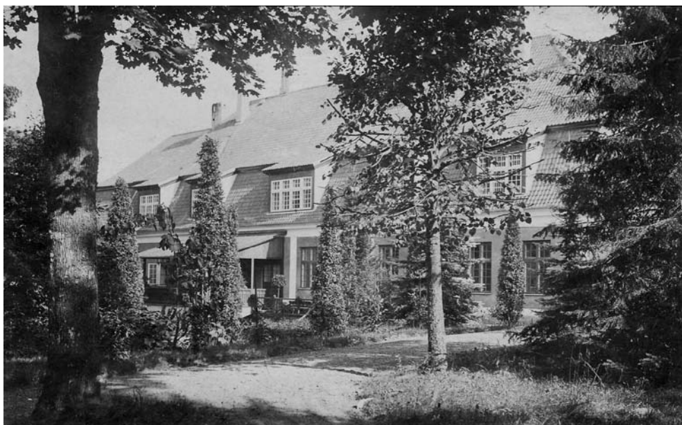
Pielikums Nr. 4

Vecbebru muižas kungu māja pēc atjaunošanas, 1910.gads