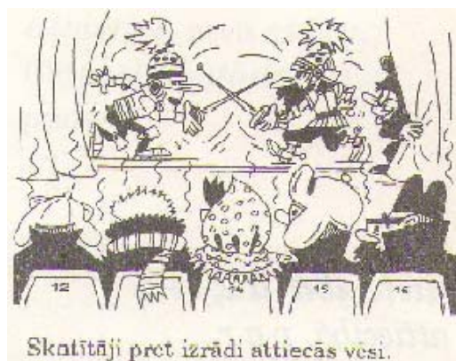
Skatītāji pret izrādi attiecās vesi.