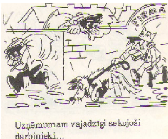
Uzņēmumam vajadzīgi sekojoši darbinieki...