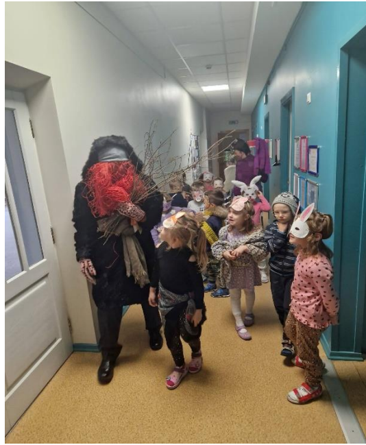
9.attēls (budēļu tēvs)