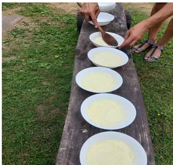
7.attēls (siers katram savā bļodiņā)