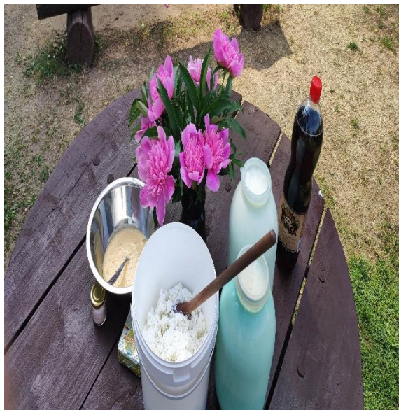
5.att. (viss nepieciešamais Jāņu siera pagatavošanai)