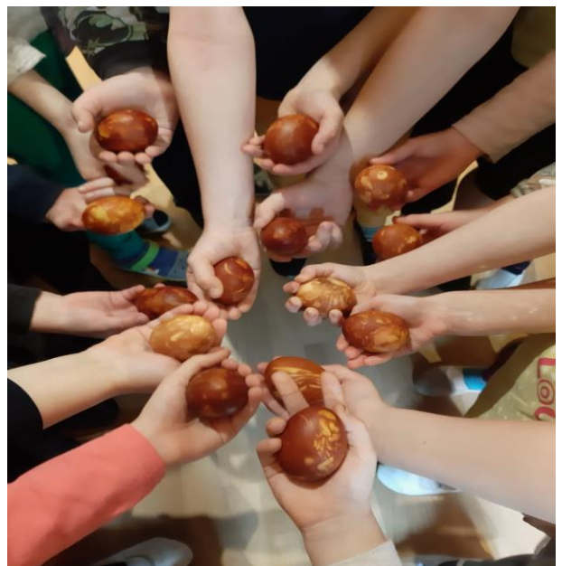
4.attēls (bērnu krāsotas olas)