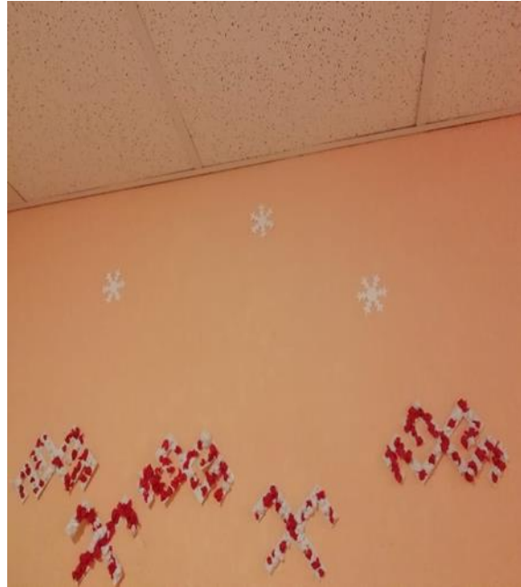
2.attēls (bērnu darbi)