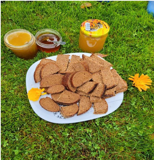
3.attēls ( Meteņdienā, bērni tiek cienāti ar maizi)