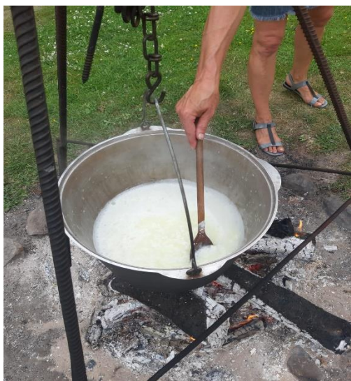
6.attēls (vāram sieru)