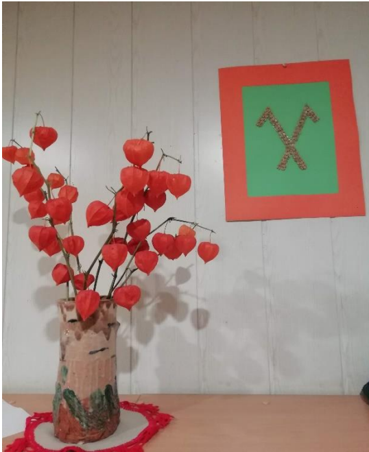
1.attēls ( grupas dekorēšana ar saviem darbiem)