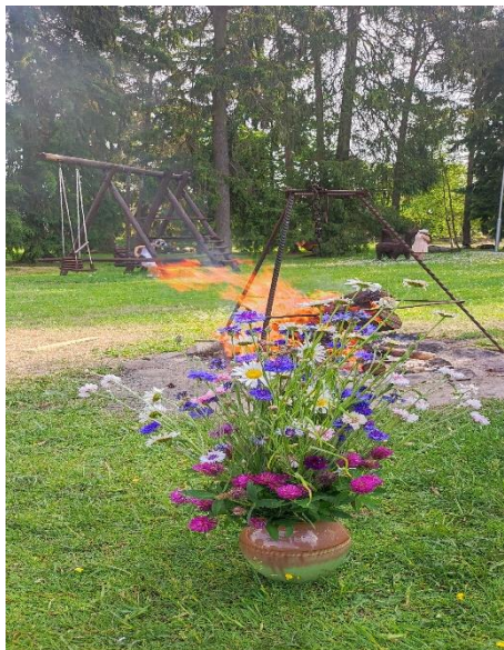
4.attēls (Jāņu ugunskurs)