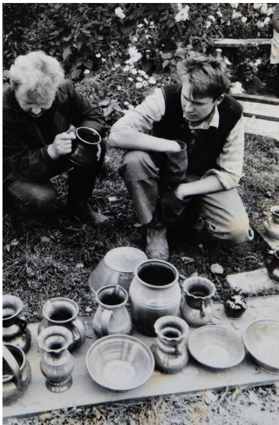
6. att. Dēla pirmā cepļa atvēršana.