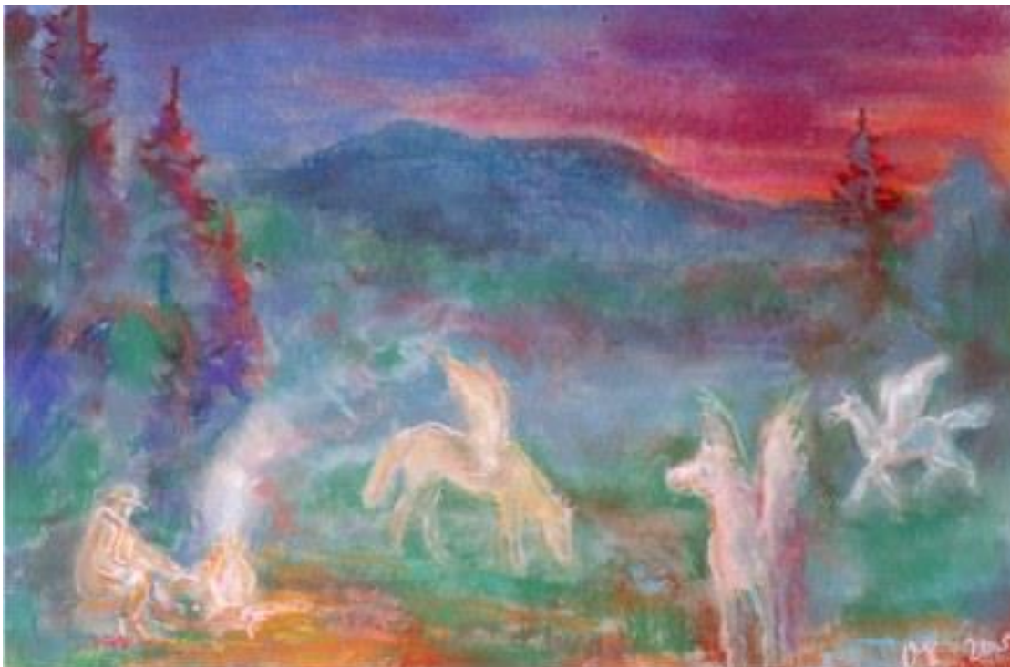
3. att. A. Kūkoja glezna “Nakts pieguļā” (2005. gads).