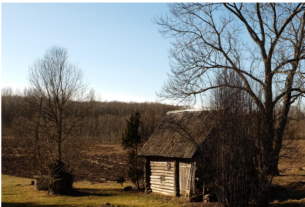
12.att. A. Kūkoja pirts un aka. (K.Kūkojas attēls, 2015.g.).