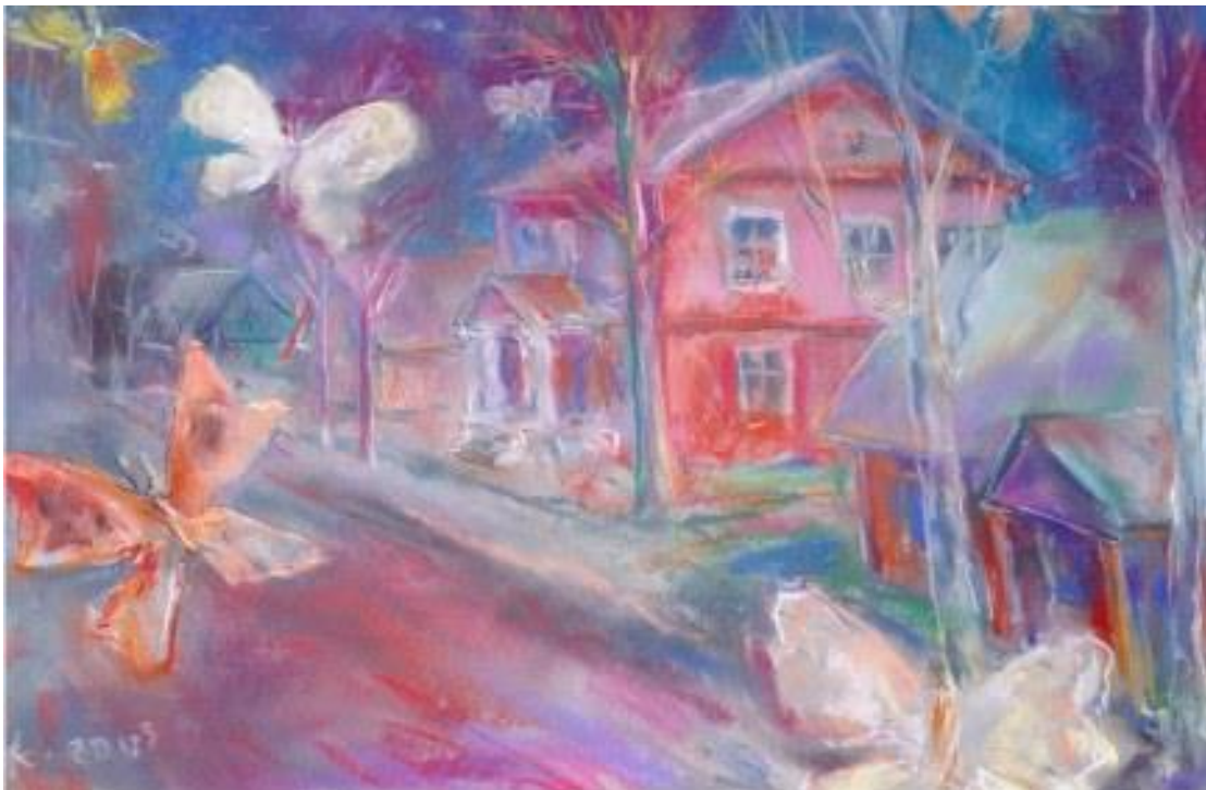
2. att. A. Kūkoja gleznas “J. Soikāna Ludzas Mākslas skola” reprodukcija (2003.g.).