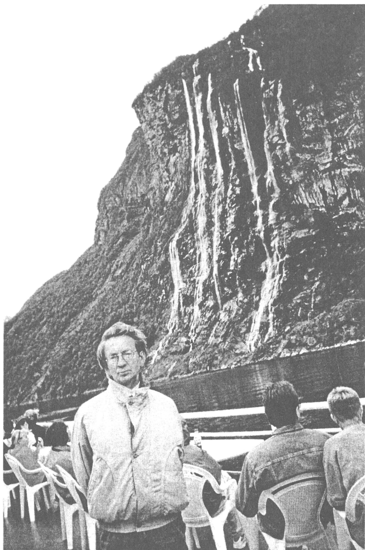
Braucot pa fjordu Norvēģijā 2000. gada vasarā.