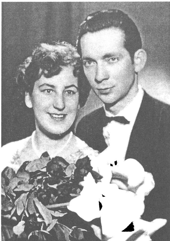
Ar Sarmīti kāzu dienā 1963. gada 5. aprīlī.