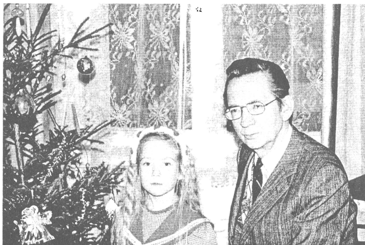
Ar mazmeitu Ievu pie Ziemassvētku egles.