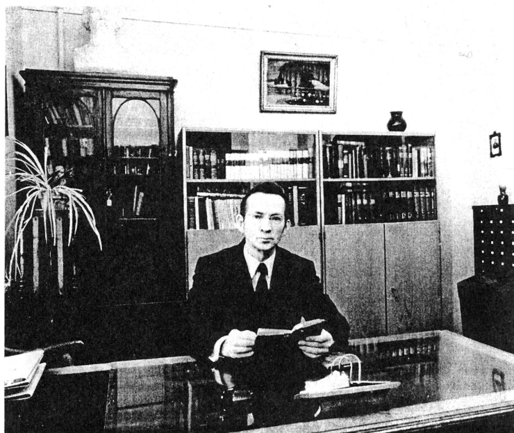
Misiņa bibliotēkā (Vecajos Misiņos Skolas ielā 3) pie darba galda.