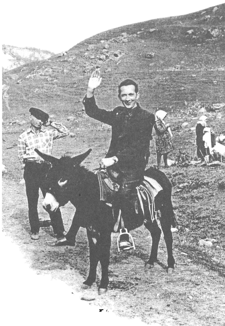
Īsi pēc Kaukāza «iekarošanas» 1974. gada oktobrī.