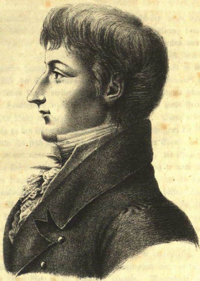
Theodor von Grotthuss der Chemiker.