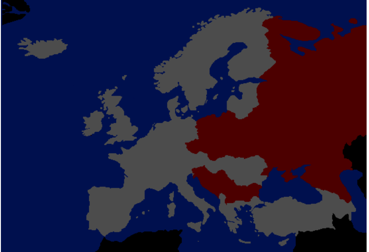
Attēls nr. 1