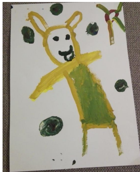
7.attēls. Riharda zīmējums.