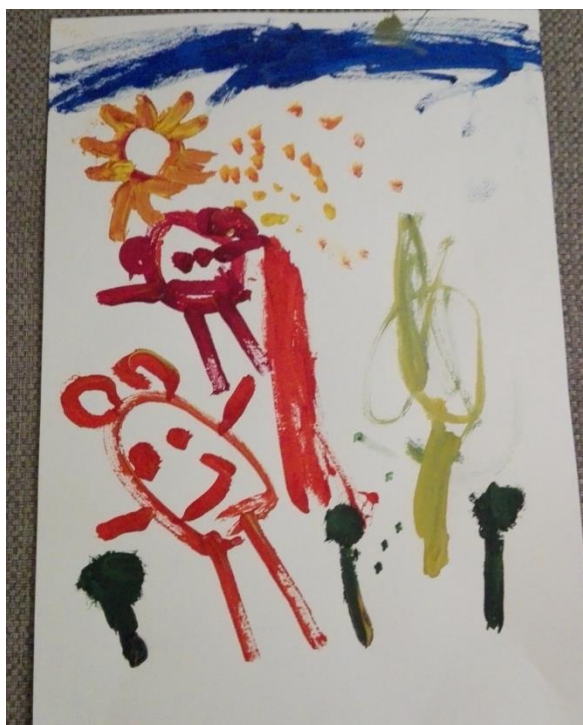
8.attēls. Leonarda zīmējums.