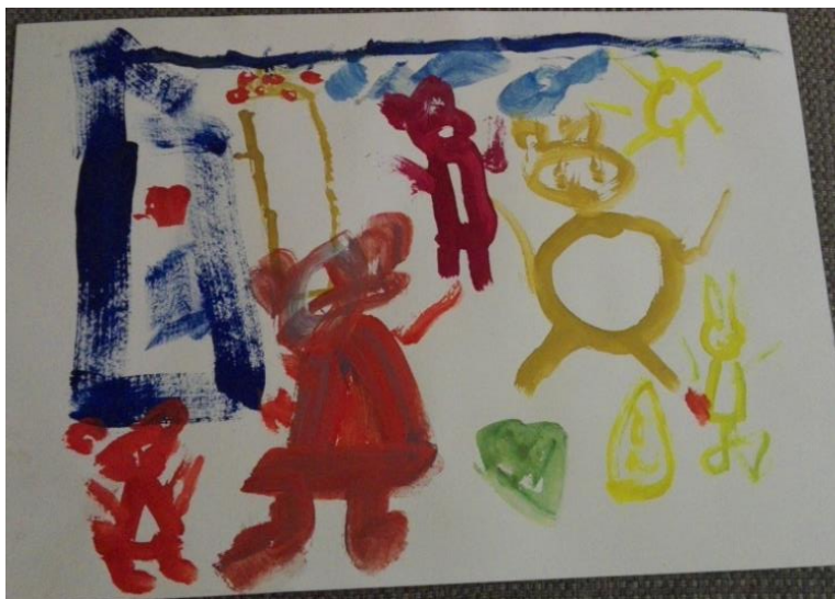
3.attēls. Evelīnas zīmējums.

Es zīmēju zaķu mammu, zaķēnus, ābolus maisiņā ko Zaķu tētis nes saviem draugiem uz mežu. Sauli un mākoņus, lai visi priecīgi. Aiz mākonīšiem vēl ir lidmašīna, mēs ar mammu citreiz lidojām