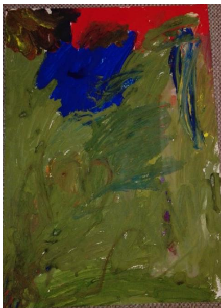
6.attēls. Mārtiņa zīmējums.

Renāte stāsta ar lielu izteiksmi, viņa iejūtas un iztēlojas tēlus, bērni izteica komplimentus, par skaisto zīmējumu, tas viņā stimulēja vēlmi darboties vēl un radīt ko jaunu, Renāte jutās pacilāta un gandarīta par paveikto darbu.