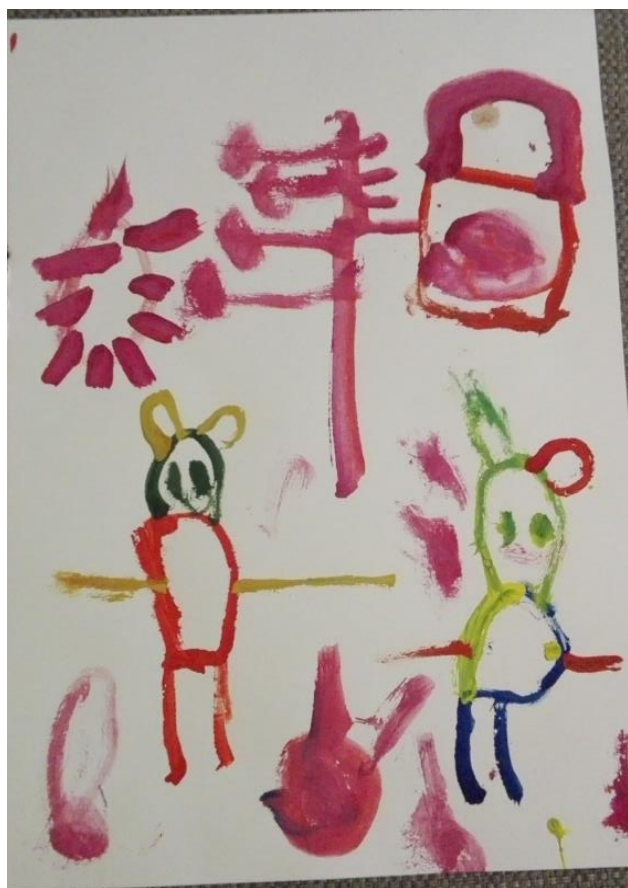
4.attēls. Tomasa zīmējums.

B. Frīdenberga norāda, ka zīmēšana rosina bērnus izteikt savus emocionālos pārdzīvojumus, darbošanās attīsta katra bērna iztēli, viņa pasaule padarāma skaistāka, priecīgāka, daudzveidīgāka un emocionāli bagātāka. Tā rosina bērnu pašu radīt darbus, kas atspoguļo vēroto vai fantāzijā radīto, (Frīdenberga, 2003, 5).