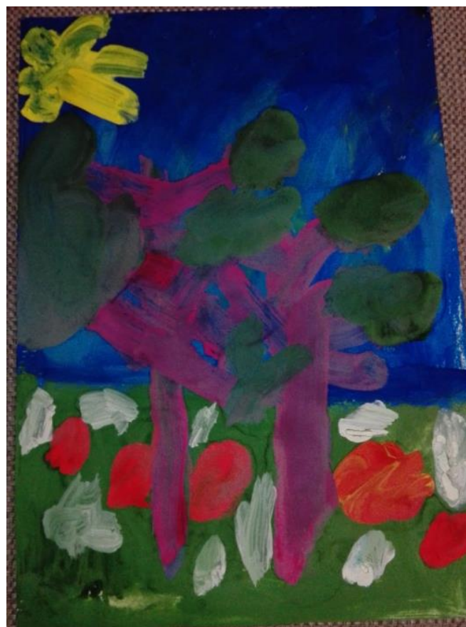
5.attēls. Renātes zīmējums.