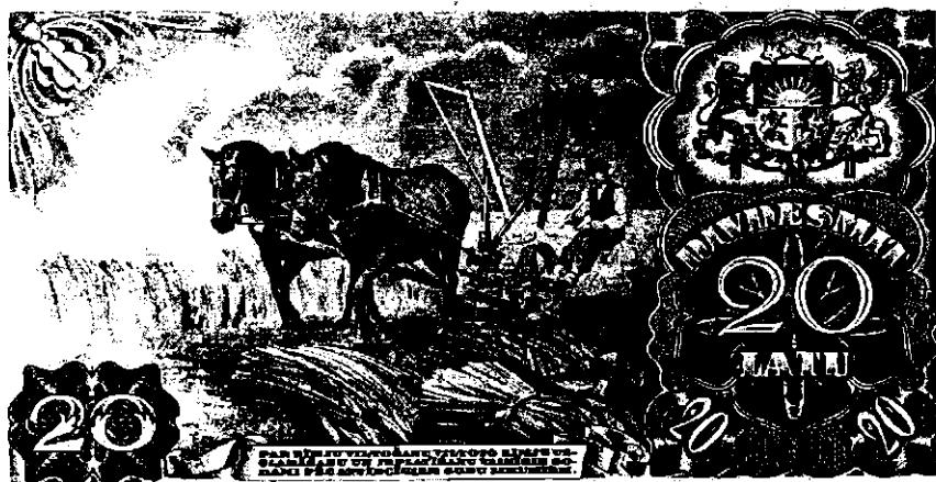
Latvijas valsts kases zīme, iespiesta 1940.g. Rīgā, emitēta pēc Latvijas okupācijas. Mākslinieki A.Apinis, K.Krauze. Papīrs, 141,0 x 77,0 mm.

nevis paceltu uz augšu, nevis gatavu aktīvai darbībai (kā, piemēram, bruņinieks uz Lietuvas monētām), bet nolaistu, ar smaili uz leju. No vienas puses, to var traktēt kā latviešu miermīlīgā, neagresīvā rakstura zīmi (“Mēs neuzbrūkam pirmie, bet vienmēr esam gatavi aizsargāties.”). No otras puses, tas liecina par kaut ko dziļāku un būtiskāku – par Latvijas valsts nespēju 1930.g. beigu Eiropas kolīzijās ieņemt neatkarīgu un aktīvu stāju. Mākslinieki daudzkārt pierādījuši, ka, būdami tālu no politikas no ikdienas notikumiem, viņi bieži tver to daudz dziļāk un būtiskāk nekā politiķi.