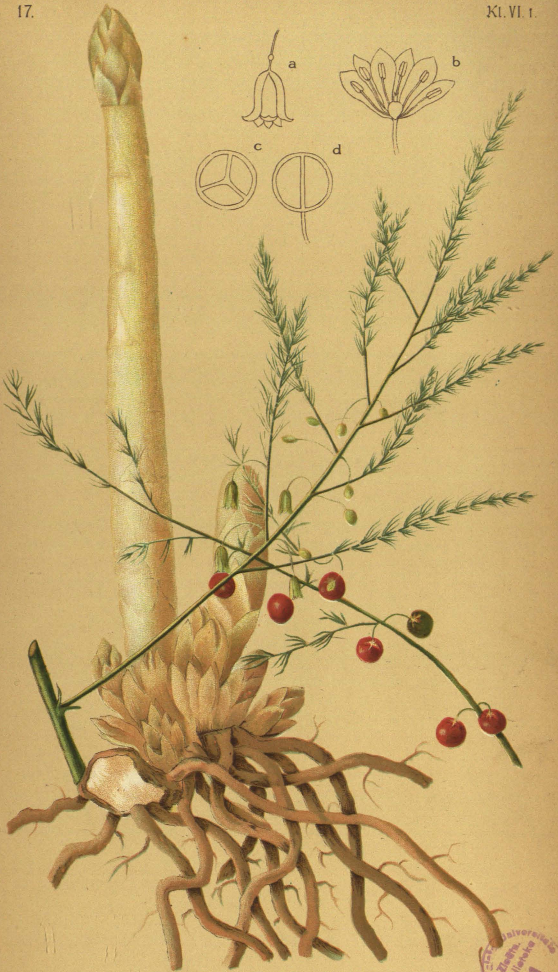
Asparagus officinalis L. Gebräuchlicher Spargel.