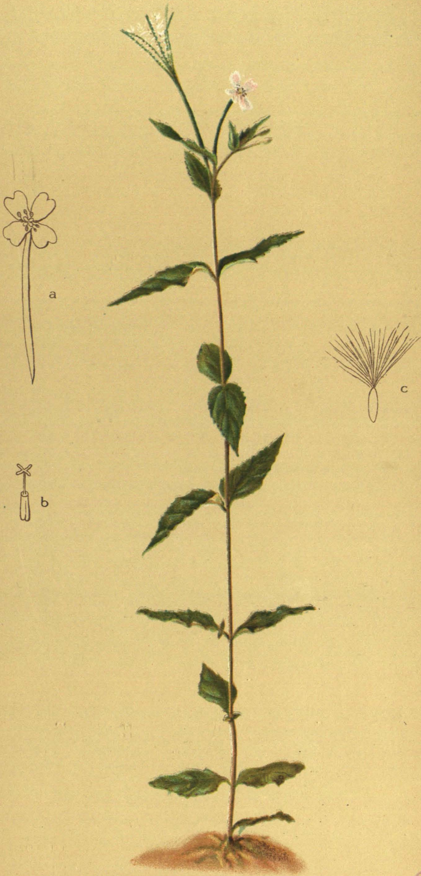
Epilobium montanum L. Bergweidenröschen.