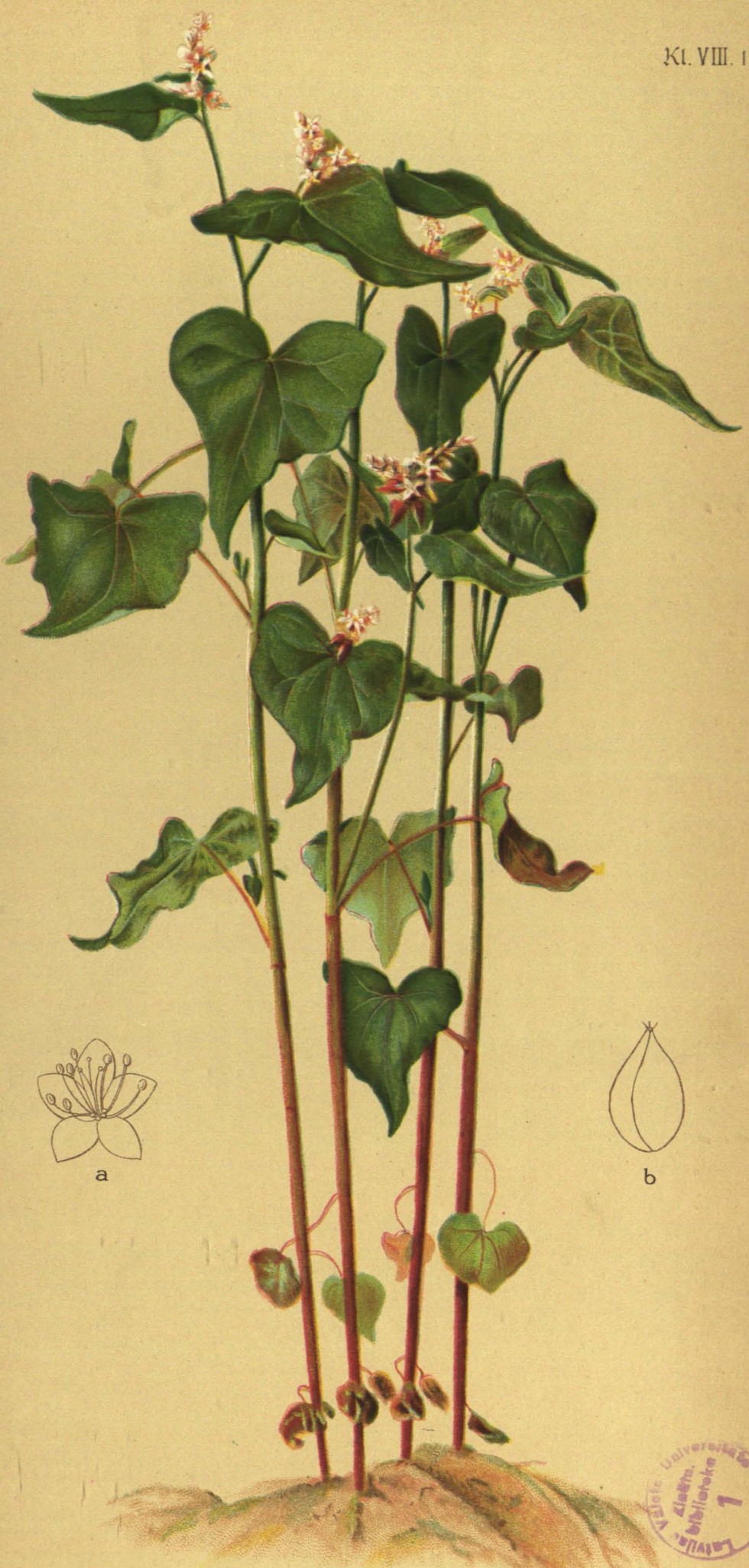
Polygönum fagopyrum L. Buchweizen.