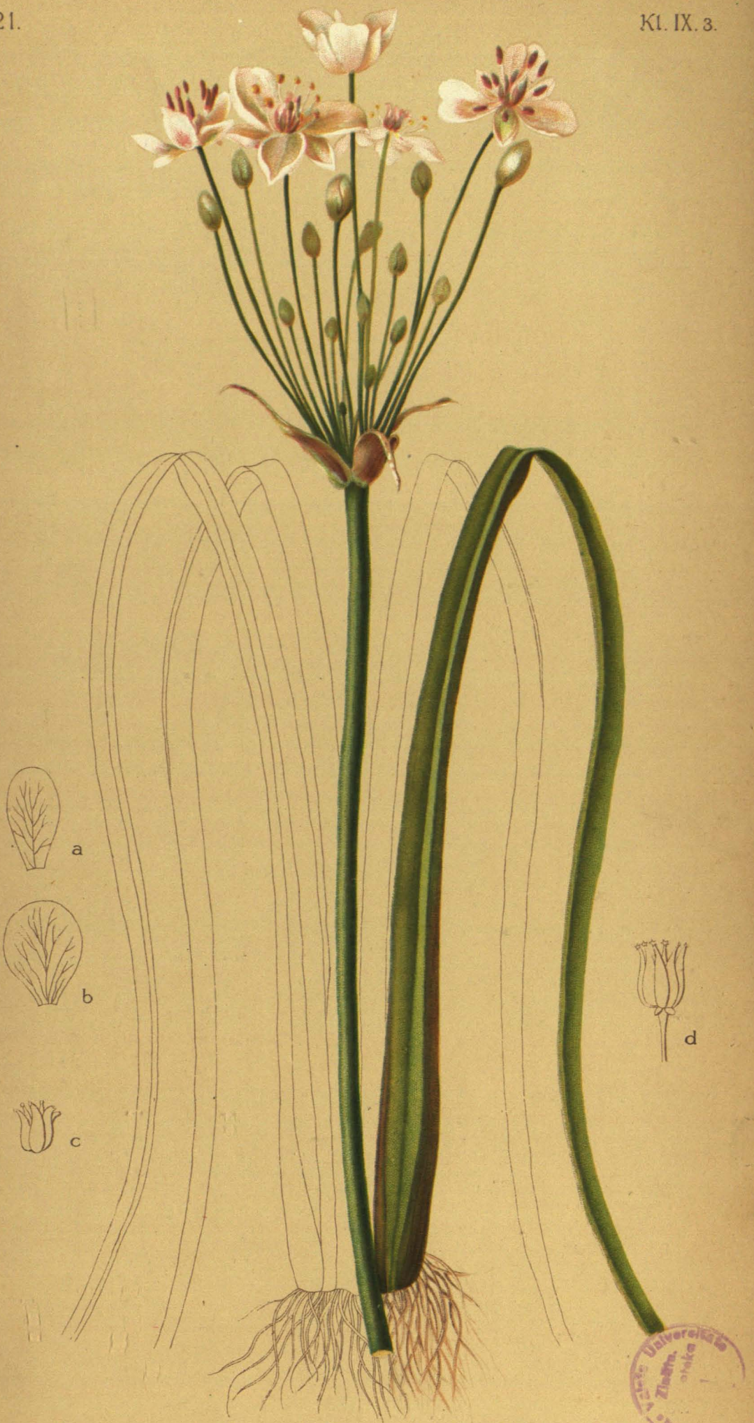
Butömus umbellätus L. Doldenblütige Blumenbinse.