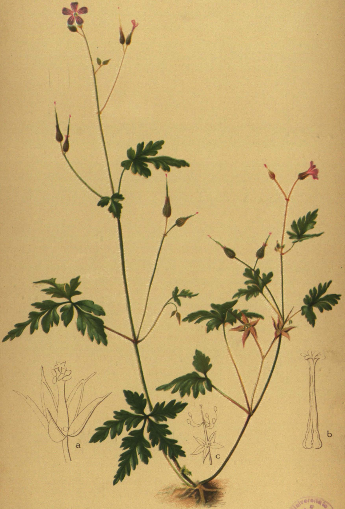
Geranium Robertianum L. Ruprechtskraut.