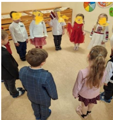
2.4.att. Rotaļa “Klusie telefoni”

Spēles mērķis: Vārdu krājuma paplašināšana ar vārdiem: karogs, himna, Rīga, svinēt .