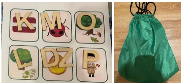
2.2.att. Spēle “Mana Latvija!”

Spēles mērķis: Vārdu krājuma paplašināšana ar vārdiem: karogs, tumši sarkans, plīvo.