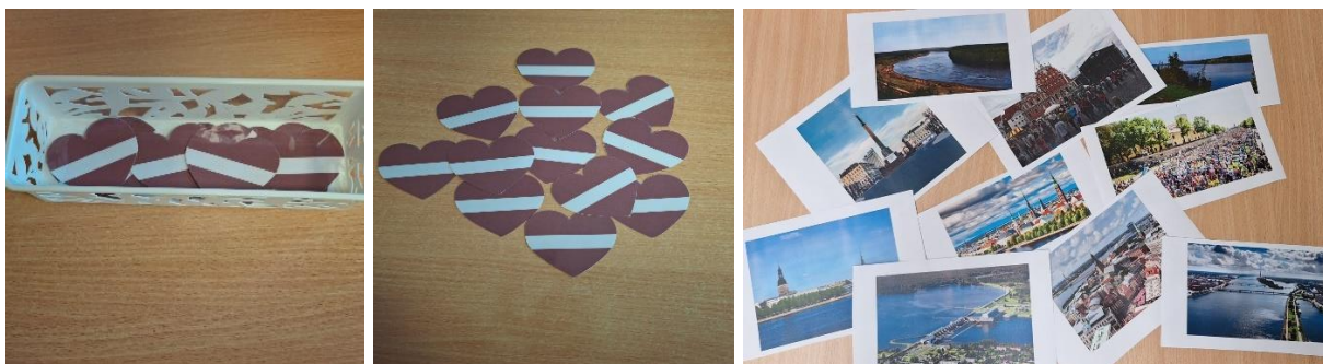
2.3.att. Spēle “Mūsu zeme Latvija”

Spēles mērķis: Vārdu krājuma paplašināšana ar vārdiem: Daugava, plaša, bīstama, plūst, galvaspilsēta, Rīga, trokšņaina.