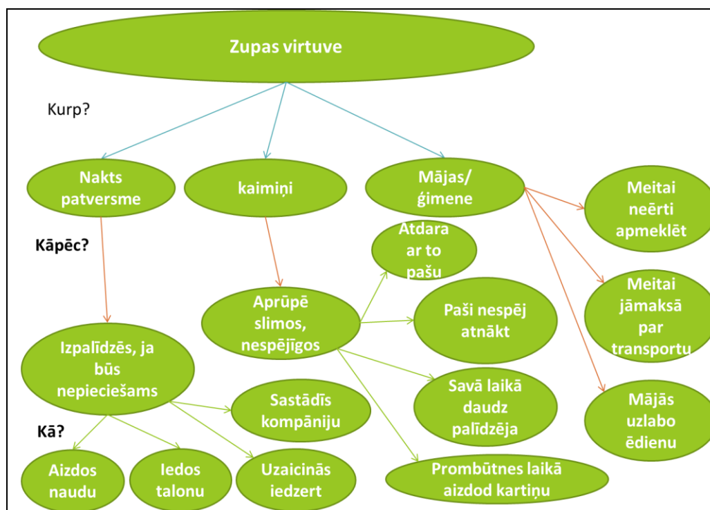
4.1.1. att. Apmaiņas tīkli

Apkopojot pētījumā iegūtos rezultātus, jāsecina, ka Zupas virtuve ēdina ne tikai tos cilvēkus, kas to apmeklē, bet gan daudz plašāku cilvēku loku - ēdiens no ZV nokļūst pie nakts patversmes biedriem, kaimiņiem un mājās pie ģimenes ( ja tāda ir). Dažādie apmaiņas tīkli aprakstīti turpinājumā (sk. 4.1.1. att.)