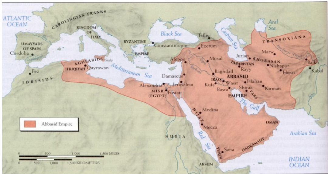
Att. Nr. 1 Ab sidu imp rija 755. gad

http://www.zonu.com/fullsize-en/2010-01-01-11553/The-Abbasid-Caliphate-7501258.html [skatīts 2013.12.10]