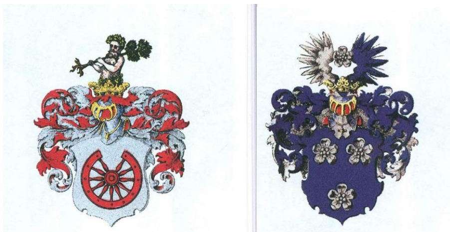
2.6.att. Fon Felkerzāmu dzimtas ģerbonis (pa kreisi) un Fon der Brinkenu dzimtas ģerbonis (pa labi)