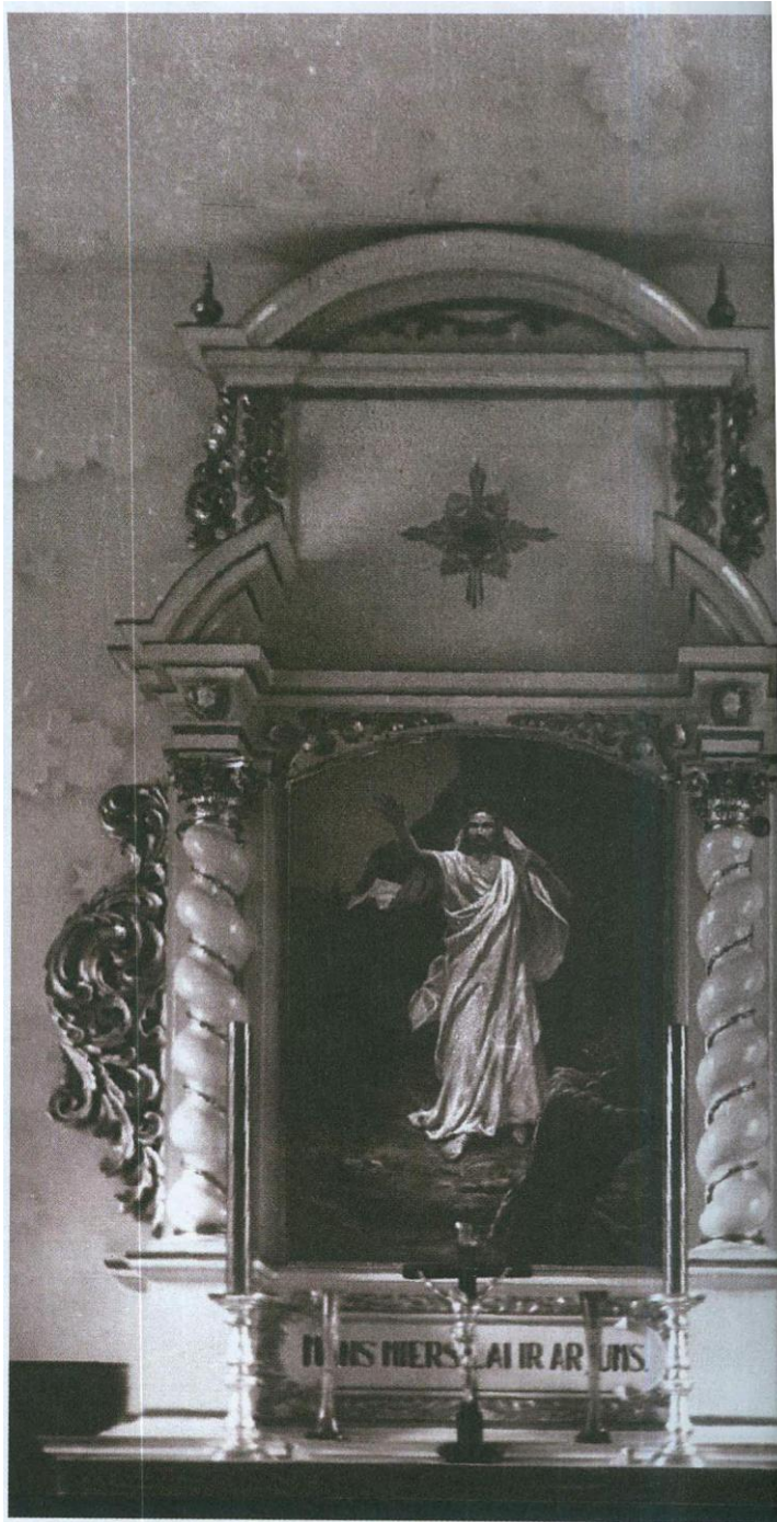
2.4.att. Altāris 20.gs. 30.gadu foto no Mašnovskis, V. „Latvijas Luterāņu baznīcas: vēsture, arhitektūra, māksla un memoriālā kultūra” 3sējums, M-SAL, SIA DUE, 2005.