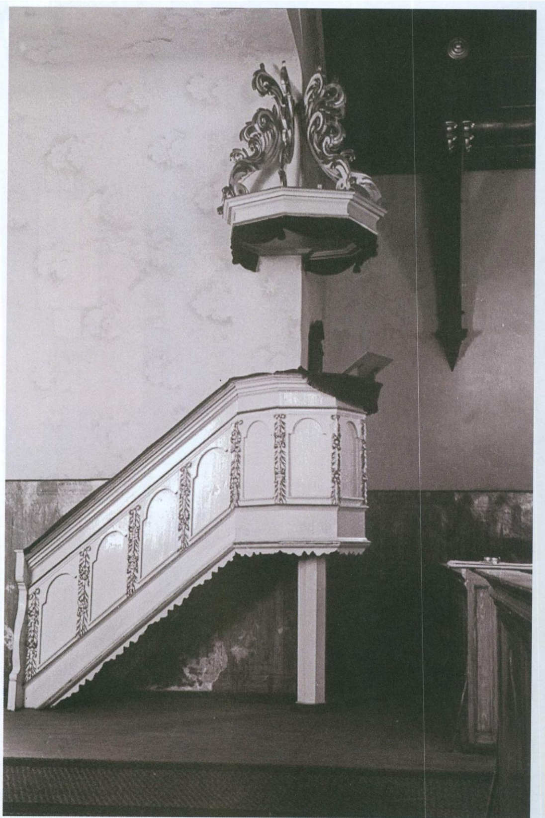
2.5.att. Kancele 20.gs. 30.gadu foto no Mašnovskis, V. „Latvijas Luterāņu baznīcas: vēsture, arhitektūra, māksla un memoriālā kultūra” 3sējums, M-SAL, SIA DUE, 2005.