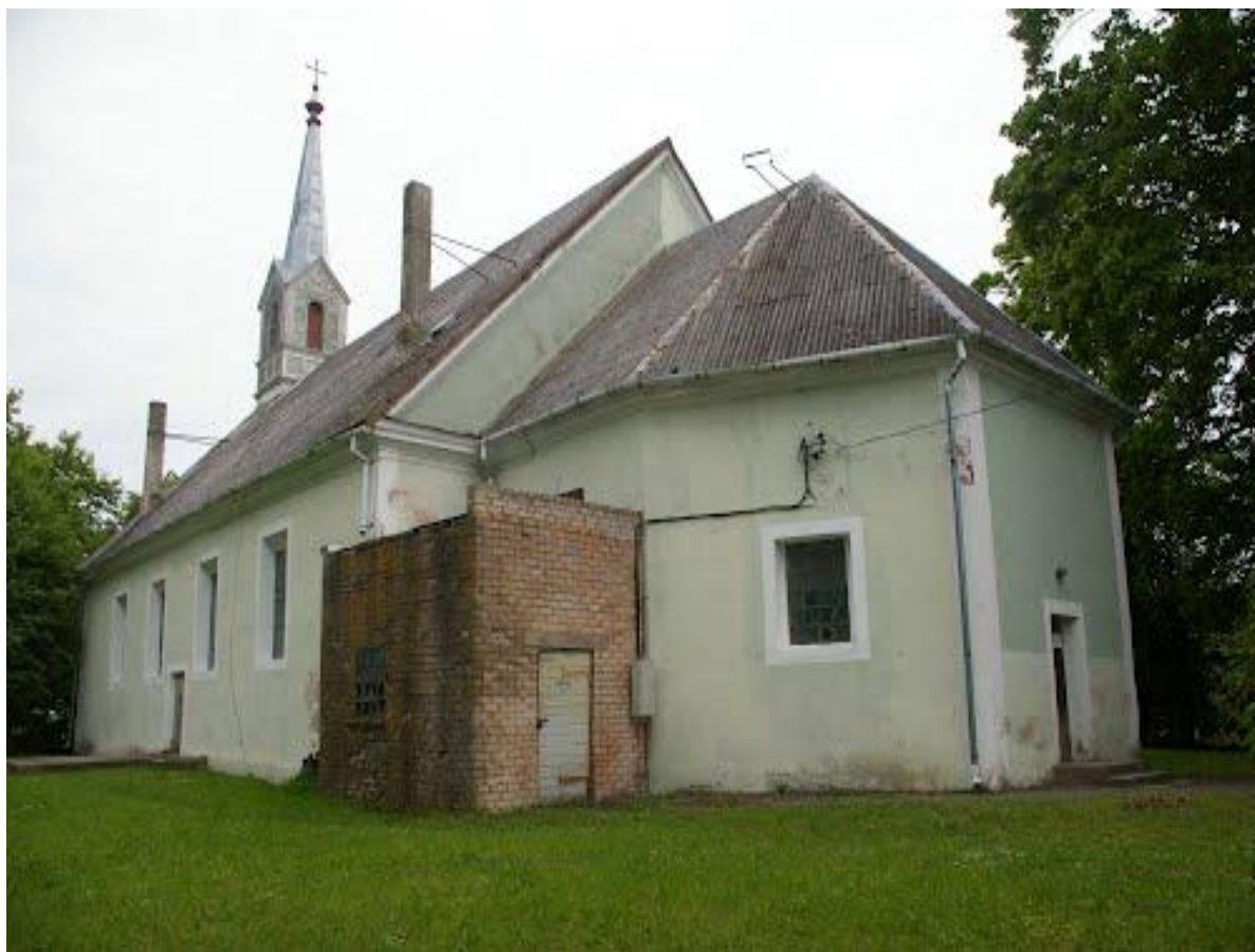
2.9. att. Penkules evaņģēliski luteriskās baznīca ārējā fasāde 2010.gadā