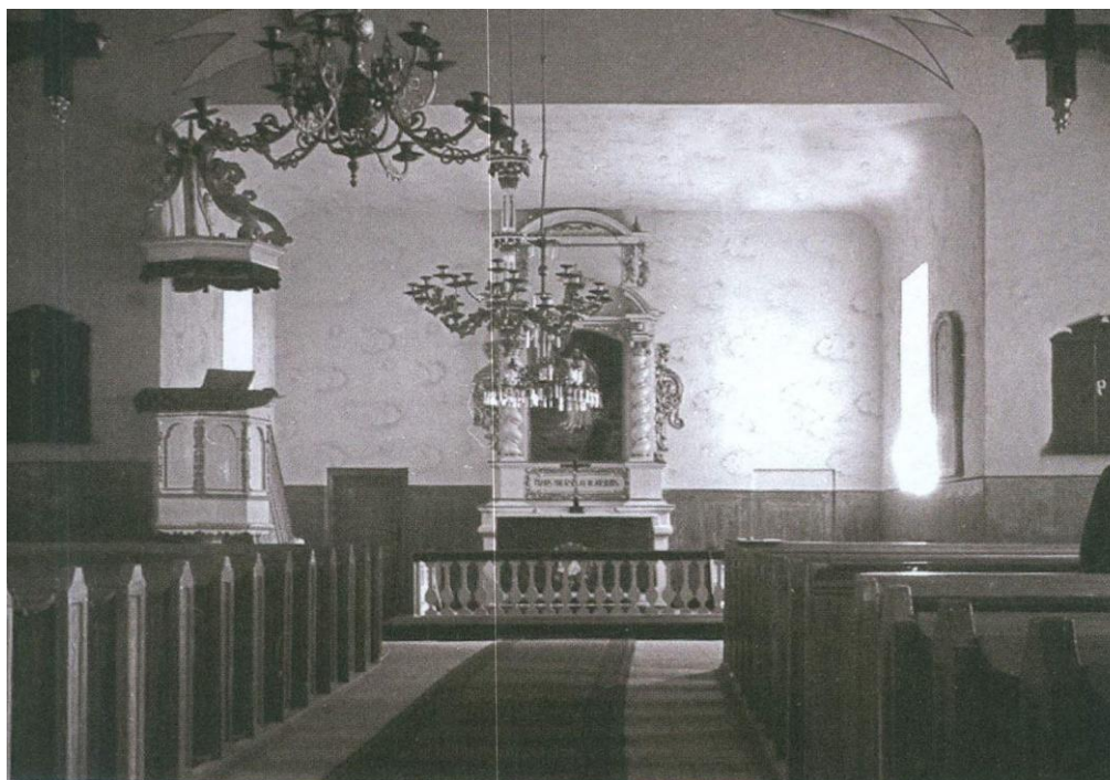
2.1.att. Draudzes telpa skats uz altāri. 20.gs. 30.gadu foto no Mašnovskis, V. „Latvijas Luterāņu baznīcas: vēsture, arhitektūra, māksla un memoriālā kultūra” 3sējums, M-SAL, SIA DUE, 2005.