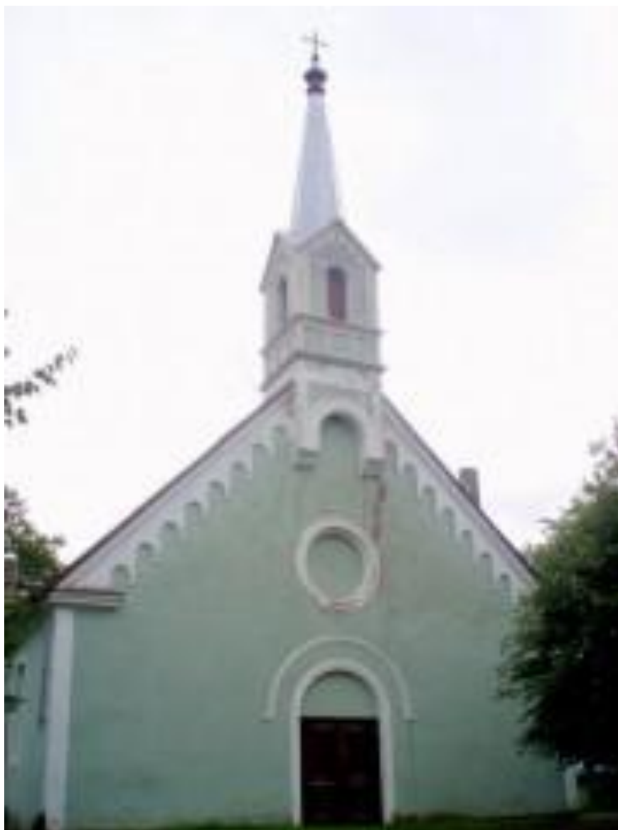
2.11 Penkules evaņģēliski luteriskās baznīca ārējā fasāde 2010.gadā