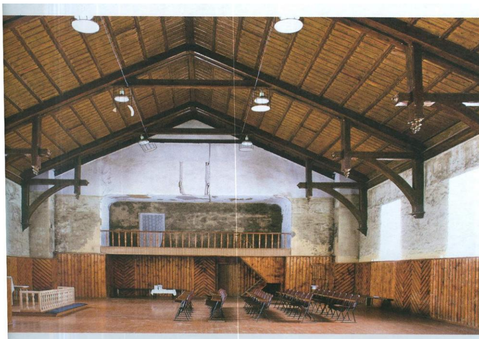
2.2.att. Draudzes telpa. 2007.gada