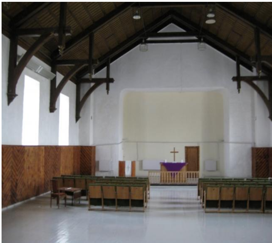
2.3.att. Draudzes telpas 2010.gadā Penkules pagasta iedzīvotājas Baibas Jansones foto.