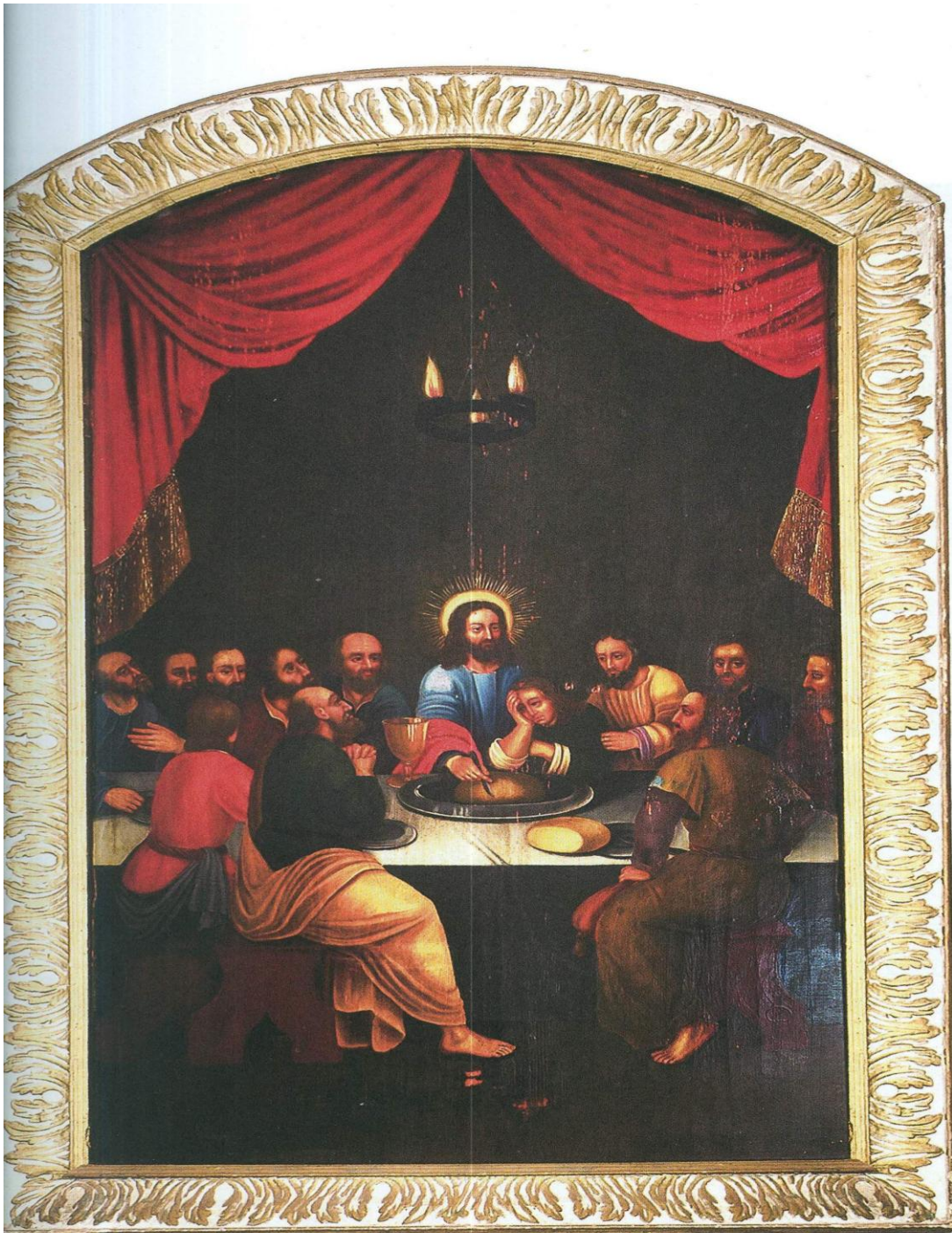
2.8.att. Altārglezna „Svētais vakaraēdiens”17.gs. 2004.gada foto no Mašnovskis, V. „Latvijas Luterāņu baznīcas: vēsture, arhitektūra, māksla un memoriālā kultūra” 3sējums, M-SAL, SIA DUE, 2005.