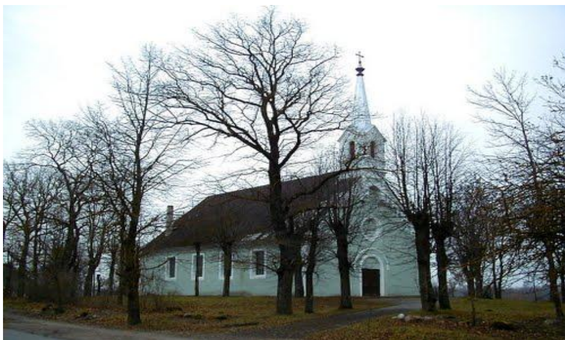
2.10. att. Penkules evaņģēliski luteriskās baznīcas ārējā fasāde 2010.gadā