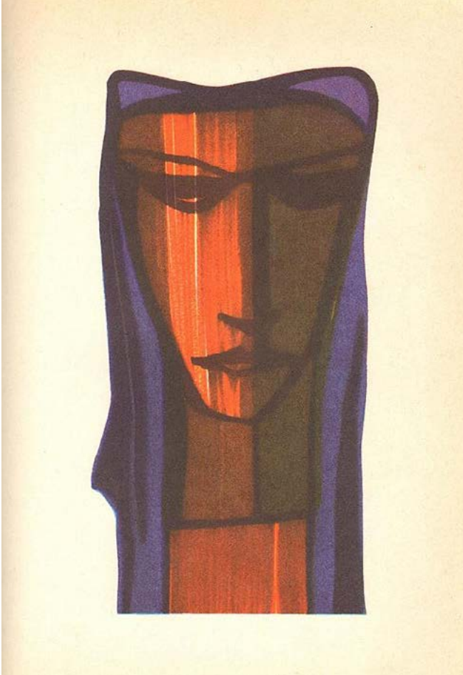
Kurts Frīdrihsons. Flomāsteru zīmējums (Eiripīds. „Traģēdijas”), 1984