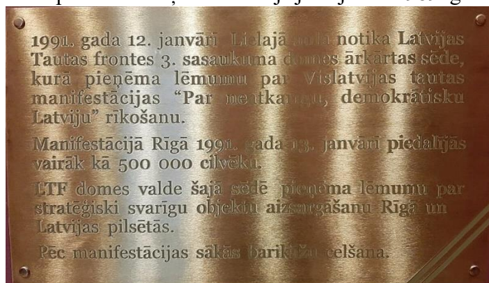
Latvijas Tautas frontes piemiņas plāksne Barikādēm 1991. gadā LU galvenajā ēkā

PSRS okupācijas apstākļos starp Latviju un Lietuvu turpināja pastāvēt starpkultūras sakari , kas izpaudās sevišķi nacionālajā jautājumā. 1989. gada 11. novembrī PSRS prezidenta Mihaila